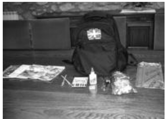
Haur bakoitzak bihar bertan jasoko duen opari sorta. E.MAIZ

200 motxila hauek jasoko dituztenak «haur pobreak dira eta askok 6 kilometro egin behar izaten dituzte beraien eskolara joateko. Euskal Herriko jende solidarioari esker, bihar Asteasutik aterata Olentzero ekuadorrera iritsiko da eta horregatik motxila guztiak ikurrina izango dute», gaineratu zuen Asteasuko alkateak.