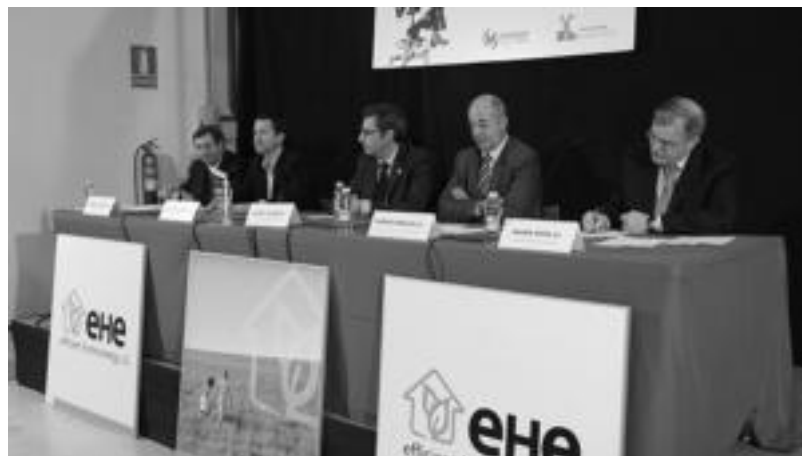
Efficient Home Energyren egoitzan egin zuten atzo sari banaketa ekitaldia. I.T.

Egun bizi dugun egoeraz ere jardun zuten, eta horrelako ekimenak bultzatzeak duen «garrantzia» nabarmendu zuten, «etorkizunerako ezinbestekoak baitira».