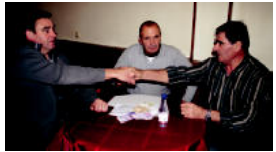
Dirua mahai gainean eta broma gutxi. Garai bateko ohiturak eta desafioak bizirik diraute oraindik Kantabrikan. A. IMAZ