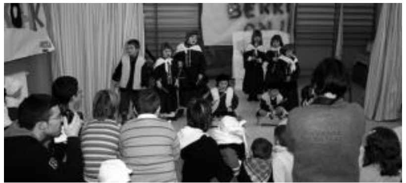
Mari Domingirekin egon dira Villabona-Zizurkilgo ikasleak. Areson berriz Eguberrietako Jaialdia egin dute. HITZA