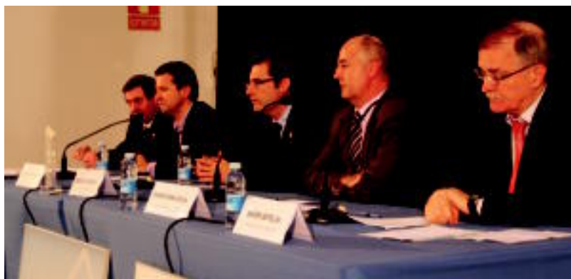
Efficient Home Energyren Tolosako egoitzan egin zuten atzokoan sari banaketa ekitaldia. I.TERRADILLOS

ELKARTASUNA Jasotako babesak eskertzen du kazetari tolosarrak eta «batuta jardutea ezinbestekoa» dela dio »3