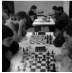
Txapelketaren memento bat. HITZA

TOLOSA ● Berdintasun Sailak txapa tailerra antolatu du gaurko, 18:00etan, Kultur Etxean. Bertara joatearekin nahikoa da parte hartzeko. «Zure leloak asmatu, bilatu gustuko dituzun irudiak eta egin itzazu zure txapak zure leloekin», azaldu dute Berdintasun Sailetik. Tailerraren helburua neska gazteek beraien leloak eta txapak diseinatu dezaten eta aldi berean berdintasunerako jakabuntza landu dezaten da.