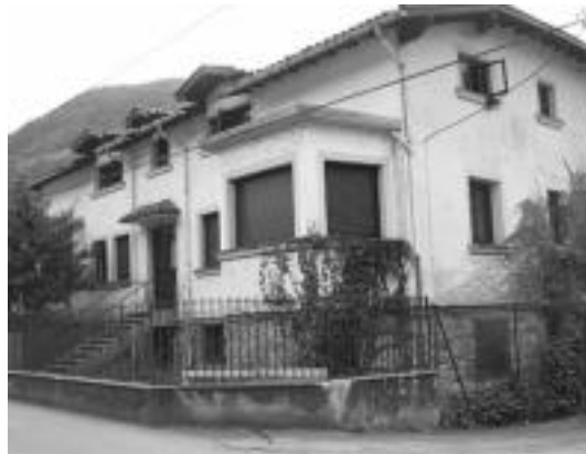
Egun Tolosako Sevendenea ez da lehen harrerako zentroa. I. TERRADILLOS

Orain egun gutxi jarri zuten in- darrean atzeritarren lege berria; zortzi urteetan laugarrenoz be- rritu dute legea. Berrikuntza hone- tan krisi ekonomikoaren ondorio- ak dira nagusi. Galdera hauxe da: zergatik aldatzen du gobernu ba- tek legea aldi jakin bat iristen dene- an? Ez dut uste horrenbeste berri- kuntzen atzean etorkinen arazoei irtenbidea emateko nahia dagoe- nik. Jarraian egindako bi berri- kuntzen arteko denbora urriaren ezinezkoa da emaitzak aztertu ahal izatea edo lehen berrikuntza- ren hutsegiteak antzematea ere. Batzen iritzi legea nahi duten neurriak prestatzen dute. Gertaka- ri honek etorkinen munduari era-