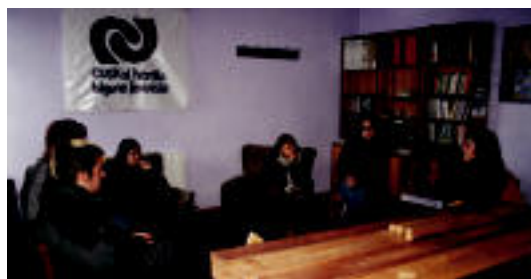
Leitzaldeko Bilgune Feministak eskaini zuen hitzaldia. A. IMAZ

Atxikimendua azaltzearekin batera, agerraldira joan zirenek bailarako herritar guztiei manifestaziora joateko eskatu zieten.