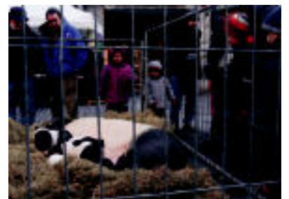
Goian, Odolki Lehiaketako sari banaketa. Behean, jendea San Frantziskon eta Plaza Zaharrean.