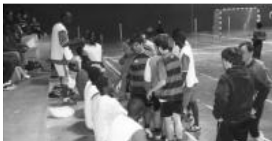
Ereite antolatutako aurtengo Adiskidetasunaren Txapelketaren une bat. HITZA

Ostiralean izan zen Etorkinen Eguna, abenduan, beste hainbat bezala. Neure buruari galdetzen diot urteko garai honetan ezartze- arena kasualitatea den, edo urteak joan eta urteak etorri, aldarrikapen hauek hotz uzten gaituztelako izan ote zen.