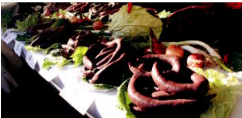
Triangulon herriko dendarien produktuak eta era guztietako jakiak aurki zitezkeen atzokoan. REBEKA CALVO