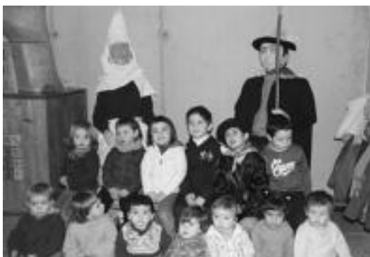
Olentzero eta Mari Domingo joan dira Larraulgo Eskolara. HITZA

Guraso Elkarteak azaldu duenez, Larraulgo Eskola bere etorkizuna lantzen ari da: «2009ko apirillean, 2010-11 ikasturtean 12 urte arteko eskola propioa izango genuela