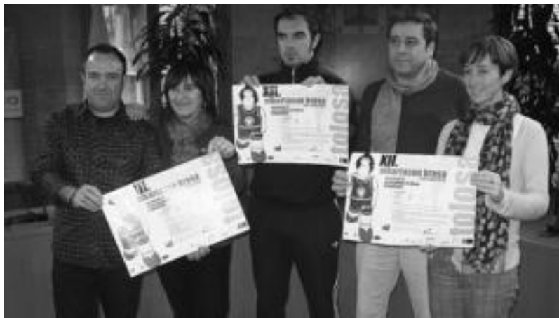
Joan den astean, Samaniego ikastetxeok eta Udal ordezkariak aurkeztu zuten Elkartasun Krosa.

Hamabigarrenez Tolosako kaleetatik barrena, elkartasuna ardatz hartuta, ehunka lagunek hartuko dute parte Samaniego-Orixe ikastetxeak antolatutako krosan. Urteik urtera geroz eta jende gehiago hartzen du parte lasterketa herriko honetan. Aurteangoan hala ere, antolatzaileek deialdi berezia egiten diete emakumei. Udaleko