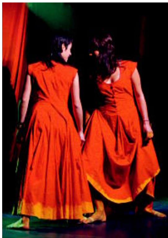
FESTA. Berrobiko San Andres eskolako haurrak, eskola txikien festa antolatzen –ezkerrean–, eta Alurr dantza taldearen Sua ikuskizuna.