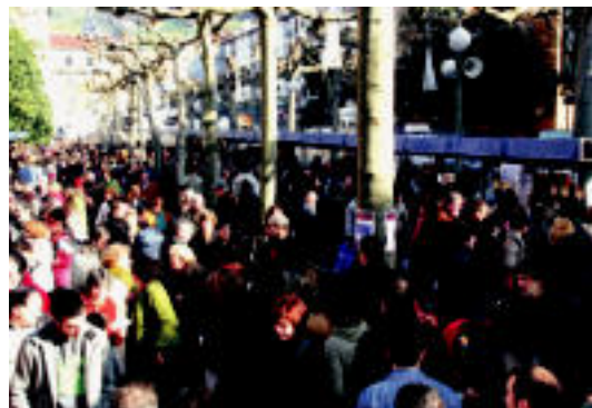
Jendetza izango da, urtero bezala, biharko azokan. ESTIEZEIZA