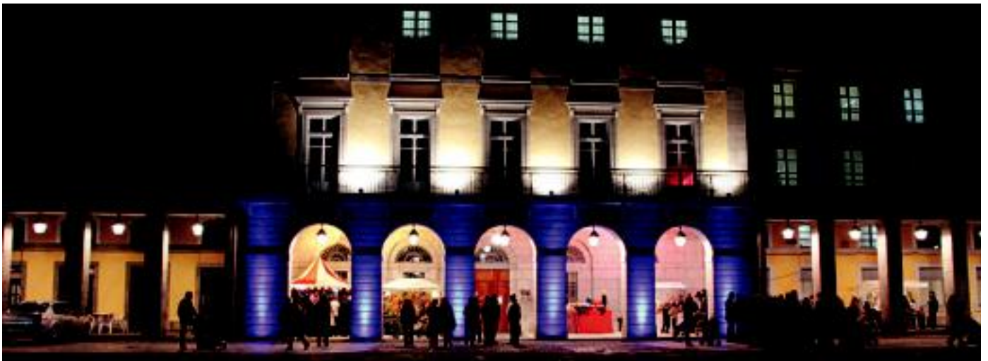
TOLOSALDEKO ETA LEITZALDEKO HITZA