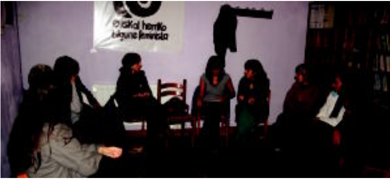
Publizitate sexistaren inguruko hitzaldia egingo dute bihar, 12:00etan, Leitzako Atekabeltz gaztetxean. ASIER IMAZ