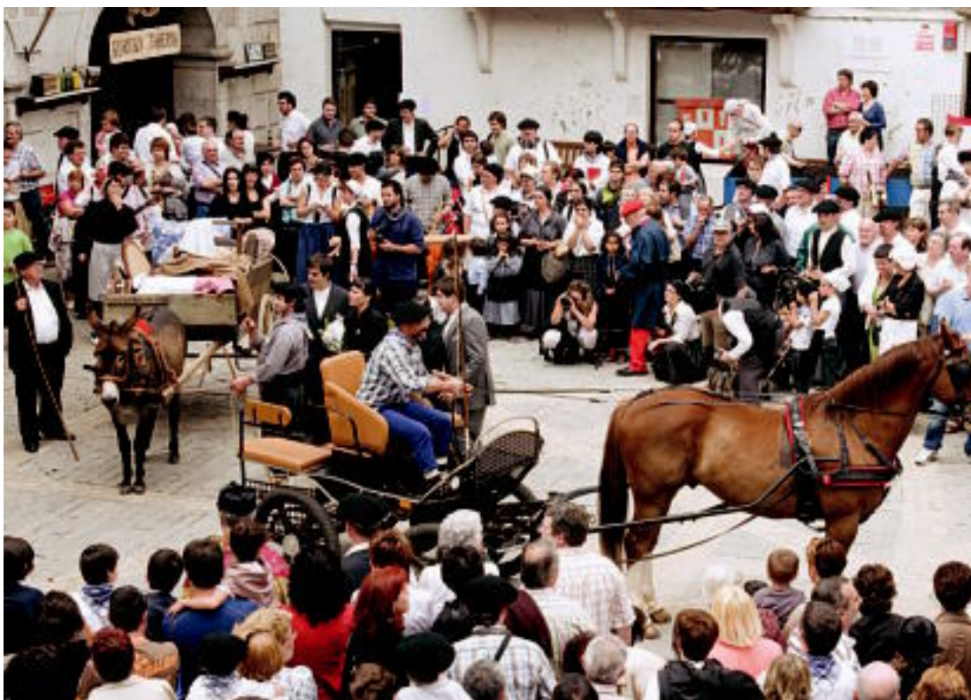
JAIA. Alegia herria goitik behera eraldatu zuten Garai Bateko Alegia jaietan. EDUARRAYET