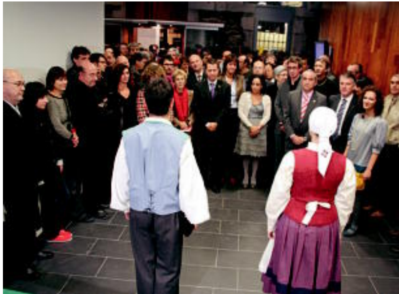
INAUGURAZIOA. Agintariak ofizialki azaroaren 27an inauguratu zuten Topic, baina bezperan herritarrentzat ireki zuten. TOLOSALDEKO ETA LEITZALDEKO HITZA

Batetik, goiz osoan txotxongiloen tailerra izan zuten zazpi urtetik gorako ehunka gaztek. Zentroaren irudia oinarri hartuta, txotxongiloak egiten aritu ziren. Piezatxoak moztu, pintatu, gorputza osatu eta makilatxoak jartzen «oso gustura» pasa zuten goiza, eta, gainera, bakoitza bere txotxongiloarekin itzuli zen etxera.