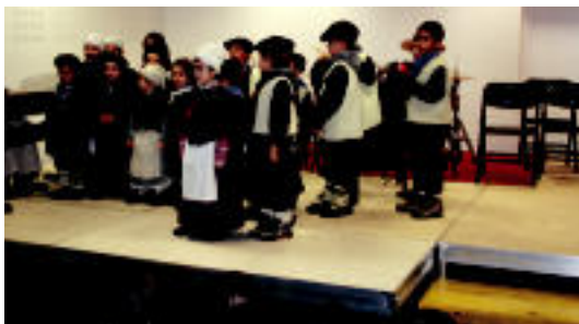
Irurako musika eskola berrian aritu ziren musikari gazteak. I. GARCIA

JOSEBA OTAEGI Zizurkilgo aizkolaria «presiorik gabe» ariko da etzi, Arbizun izango den saioan 6