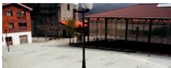
PLAZA. Adunan, herriko plaza oinezkoentzat bakarrik egokitu dute.

B i obra garrantzitsu amaitu zituzten 2009an Adunan. Alde batetik, herriko plaza oinezkoentzat baka-