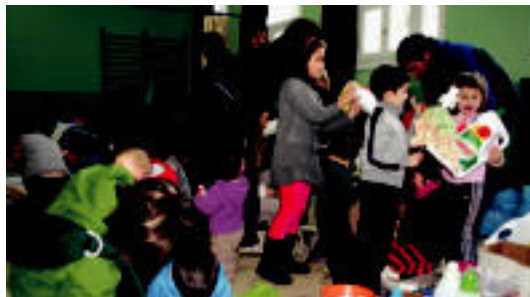
Ekimen irudimentsua egiteko aukera izan zuten atzokoan.

EGUBERRIAK Atzo Iruran eskaini zuten kontzertua eta gaur Altzon izango dira 4