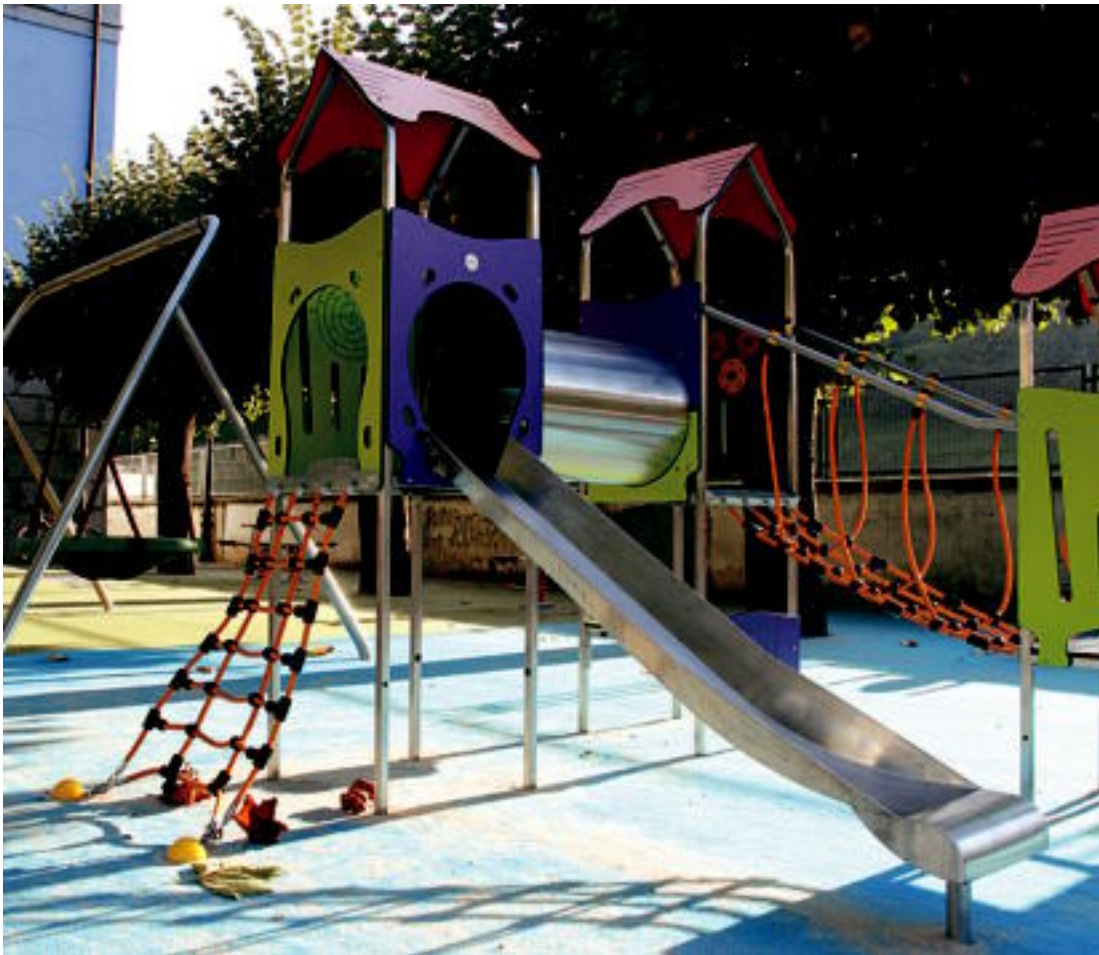
PARKEAK. Udalak udalerriko hamar parkeak berritzea erabaki du, eta lehena San Bartolome plazakoa izan da. REBEKA CALVO