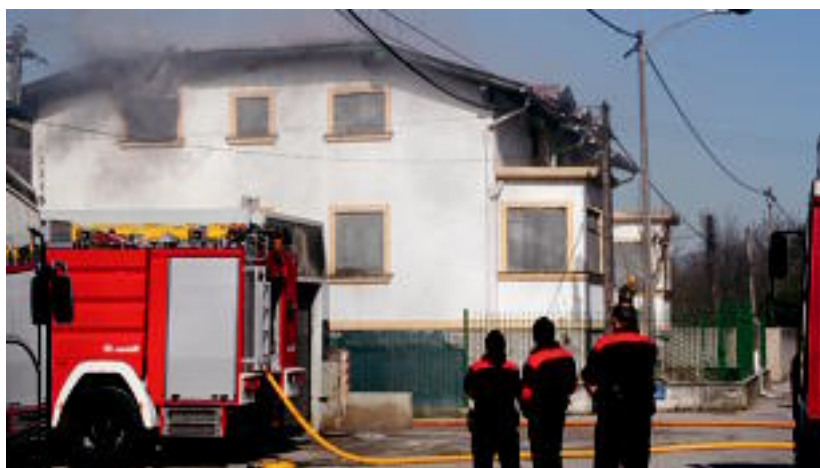
SUTEA. Sevendenea egoitzak, etorkin adingabeen urgentziako zentroak, su hartu zuen otsailaren 16an.