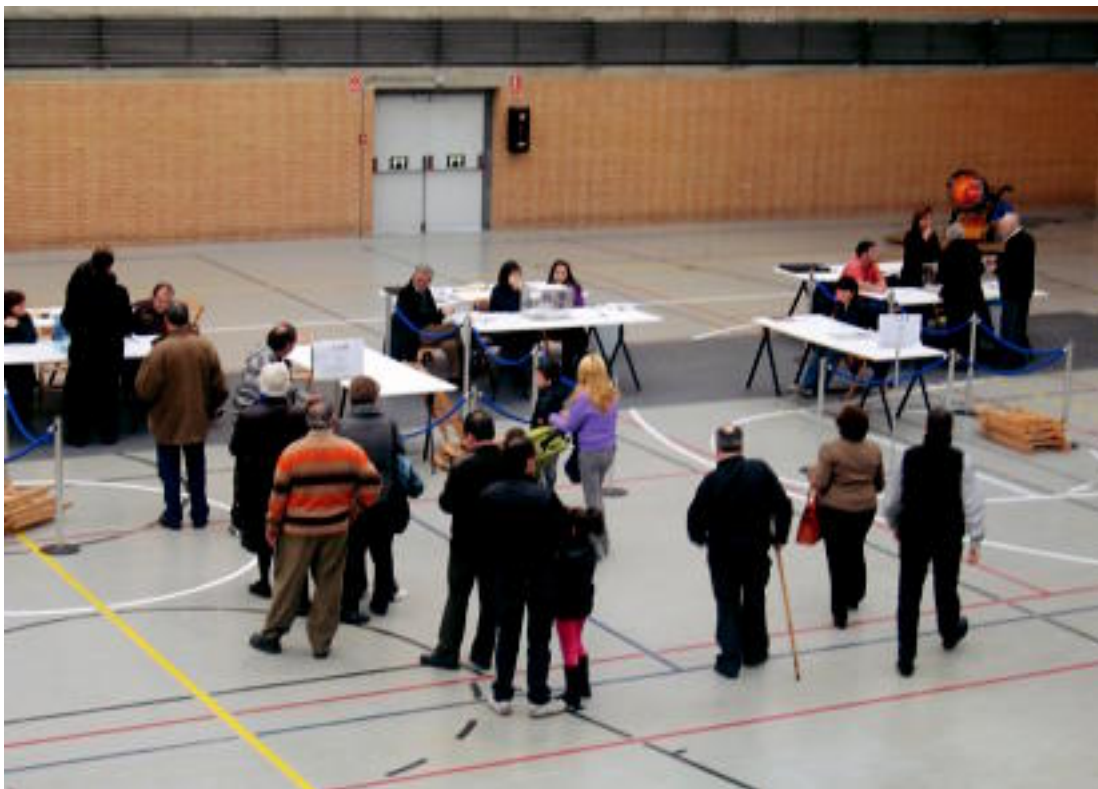
HAUTESKUNDEAK. Villabonan jendea botoa ematen, EAeko hauteskondeen egunean. NOELIA LATABURU