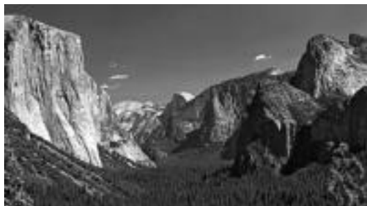
Yosemite eskalatzeko dauden lekuei buruz izango da gaurko solasaldia. HITZA

Alegia » Etziko babarrun bazkarirako txartelak erosteko azken eguna da gaur; ohiko lekuetan daude salgai 10 eurotan.