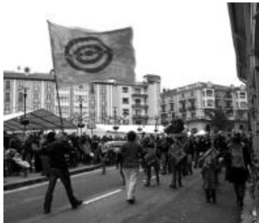
11. urteurrenean Bonberenea txaranga eta Mulambo kalera irten ziren. E.E.

Kultura » Asteburu honetan, antzerkia, kontzertuak eta zineaz gozatzeko aukera izango da.