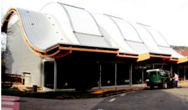
Intxaurre frontoia itxura berria du, atzo oraindik lanean ari ziren langileak. E.MAIZ

Ostiralean, Alberto Zerainek Kachenjunga ikus-entzunezkoak eskainiko du. 19:30ean Atxulondon. Honen ostean, Zizurkilgo kirolariei omenaldia egingo diete. «Omenaldi xume bat izaten da eta bai Udaletik eta baita kirol batzordetik ere, helburua, urtean zehar kirolean ibili eta lorpenak dituzten