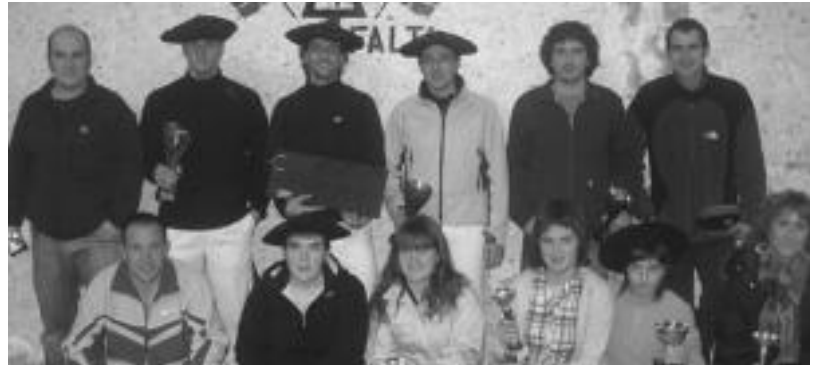
70 pertsona aritu dira txapelketan, irudian finalista guztiak ikus daitezke.

Aipatu bezala aurtengoa 18. edizioa izan da, urteak igaro dira txapelketa lehen aldiz antolatu zutenetik eta jada lehiaketa herrikoia baino eskualdeko mugak gainditu dituen urteroko hitzordua da.