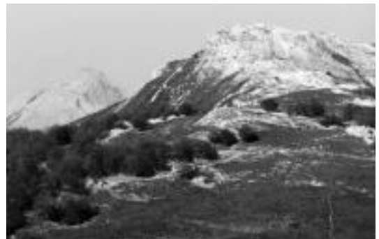
07:00etan irteera dira Olaederratik zirkulu-formako ibilaldia egingo. HITZA

Zirkulu-formako ibilaldia egingo dutela argitu dute antolatzaileek eta gaur da izena emateko azken eguna. Horretarako 649 717 182 telefono zenbakira deitu behar da 20:00etatik 22:00etara. Aizkardi Elkartean bertan ere eman daitezke izena.