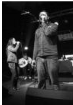
Checkpoint Rock. G. GARAIALDE

Zinema » Gaztetxoentzako 8 film eta helduentzako bat emango dituzte; banaka 3 euro ordaindu beharko da, eta bonua, berriz, 5 euro.