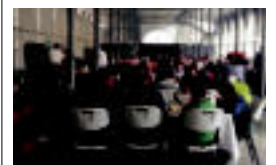
1.500 pertsona izan dira Zerkausian.e.e.

LEITZA 'Bizi!' izeneko olerki bilduma argitaratu du 6-7