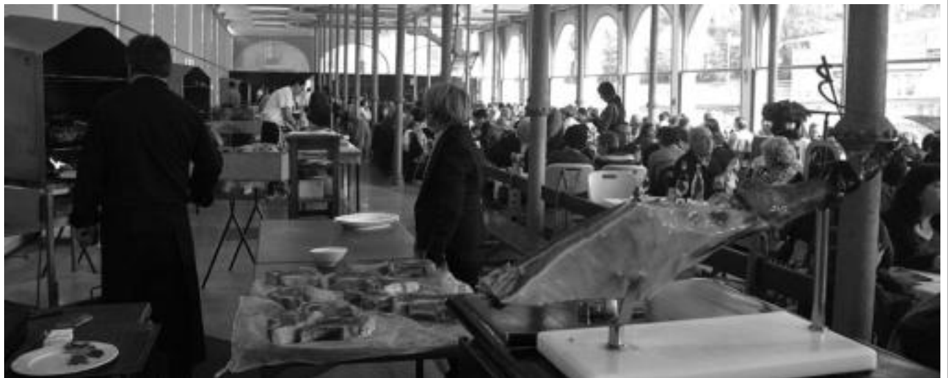
Atzokoa Txuletaren Festaren azken eguna izan arren jende asko bildu zen Zerkausian Tolosako erretegiatiko sukaldarien jakiak dastatzeko.