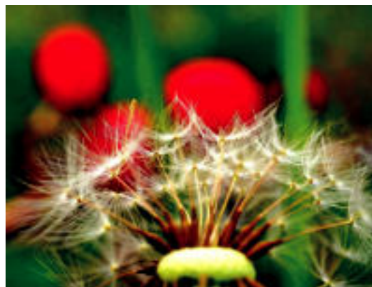
Publikoaren saria Mediavillaren Putz egin! argazkiak jaso zuen. AIZKARDI