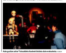
Aste guzian zehar Tolosaldiko ikuskek bitxitsu dute erakusketak.