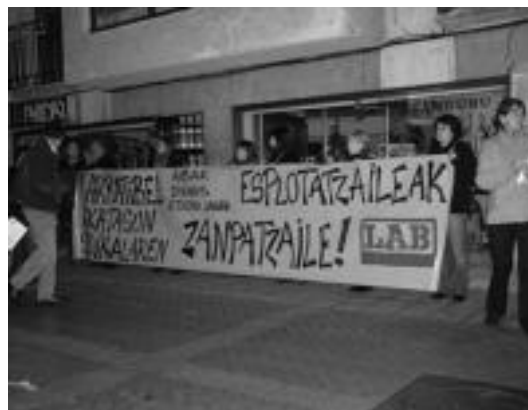
ESkuorriak banatzen aritu zituzten Txuleta Festaren aurrean. E. MAIZ

«Diktadoreez» aspertuak daukela eta «Aibako langile guztien interesen alde borrokatuko gara eta ez dezala pentsa kalte ordaina kitatuz konpontzen denik», argitu nahi izan zuten. Bestalde diruagatik ez baino «jarduera sindikalak eta lan baldintza hobekoak definitu nahian» ari direla borrokan