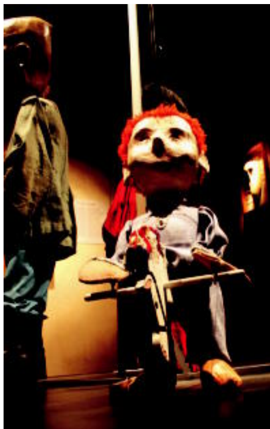
Erakusketa ikusgarria da Aranburu jauregian jarri dutena.

TOLOSA Txuleta-ren Festa herenegun gauetan hasi zen Zerkausion; honen baitan, hainbat ekitaldi daude, tartean artisautza azoka 6