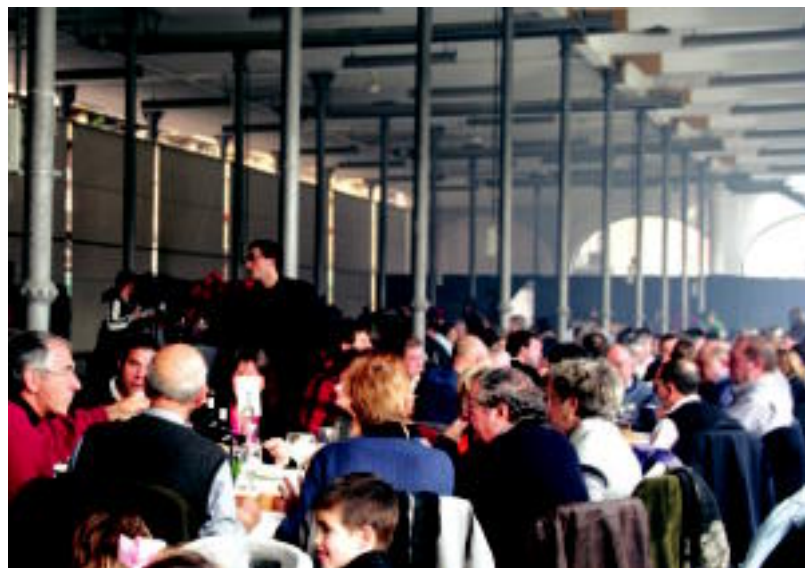
Goian, San Frantzisko pasealekuan artisautza azoka. Behean, Txuleta-ren Festan, atzoko bazkaria.