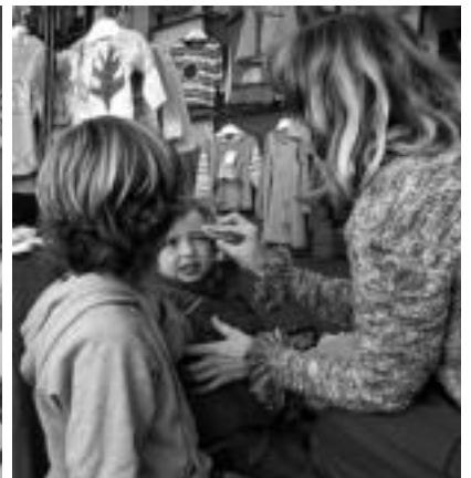
Produktu desberdinak aurkitu daitezke azokan; haurrei aurpegiak ere margotzen dizkiete bost euroren truke. R. CALVO