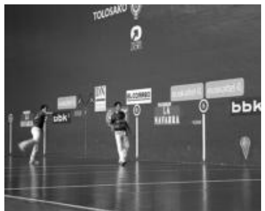
Txuletarekin Festan bazkalten eta Beotibarren jokatuako partida. E. MAIZ