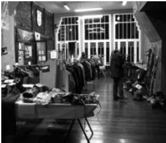
Oraindik ere aukera zabala dago Oargiren azokan. I. TERRADILLOS