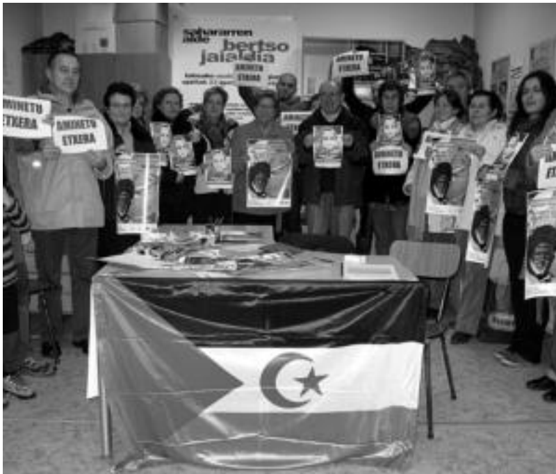
Abenduaren 10etik urtarrilaren 31 bitarte jaki desberdinak eta eskolarako materiala bilduko dute. R. CALVO