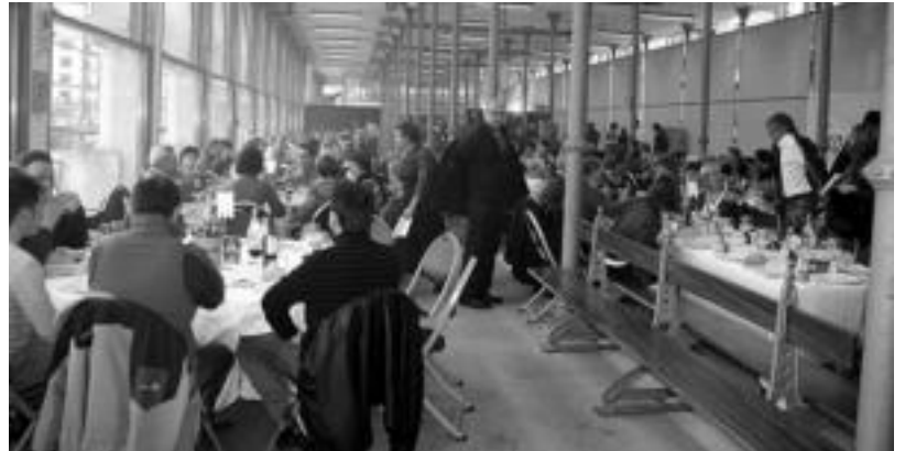
Ehunka lagun bilduko dira bihartik aurrera Zerkausion, txuleta osagai nagusia duen menuaz dastatzeko. A. IMAZ

■ Adiskidetasunaren Txapelketa. Hirugarren eta laugarren postuak eta finala jokatuko dute. 11:00etatik aurrera Tolosako Uzturpe pilotalekuan.