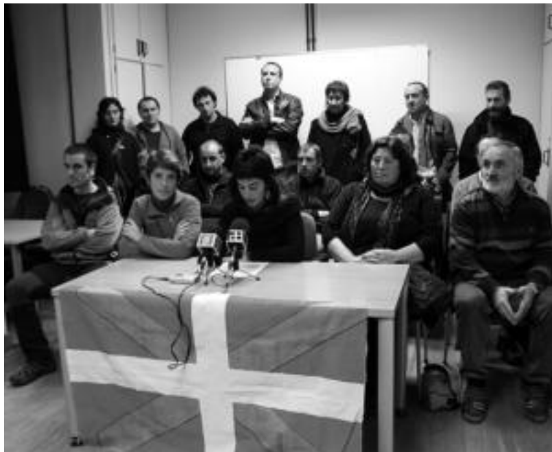
Herenegun agerraldia egin zuten eskualdeko herri ezberdinetako hautetsi independentistek.