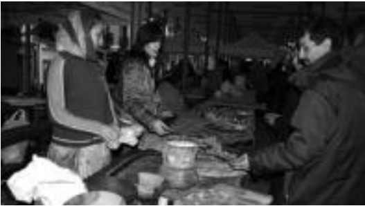
Etorokinaren egunaren harira, antolatutako jardunaldien baitako azoka. E.E