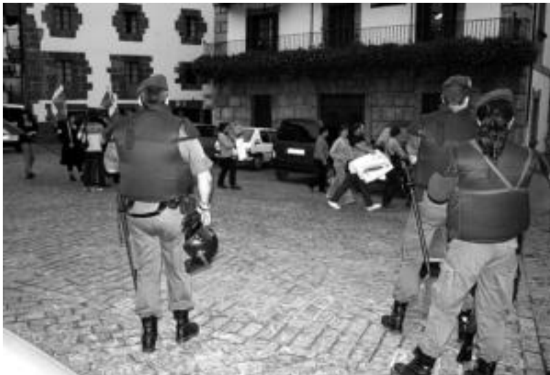
Leitzako hautetsi independentistek eta EAK «indar armatuaren presentzia bertan behera geratzea» nahi dute. A. IMAZ