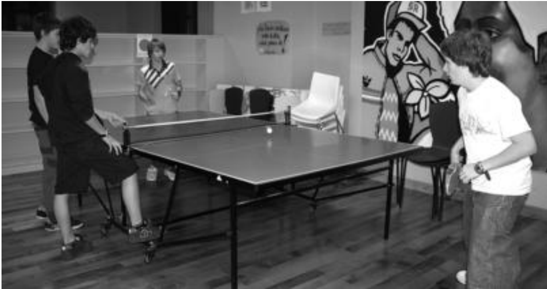
Mahai teniseari, billarrean, ordenagailuetan eta abar aritu daitezke gazteak Kultur Etxeko lehen solairuan kokatuta dagoen Gazte Topagunean. E. EZBIZA