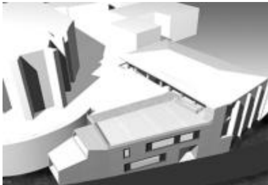
Eraikinak goitik begiratuta izango duen itxura. HITZA

zaio Udalariparkea handitzearena eta eraikin horrekin «aukera ematen digu parkea bera handitu eta hobetzeko».