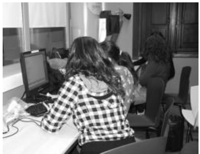
Adin talde, koadrila eta ikastetxe ezberdinetako gazteentzat bilgune da Topagunea. E. EZBIZA