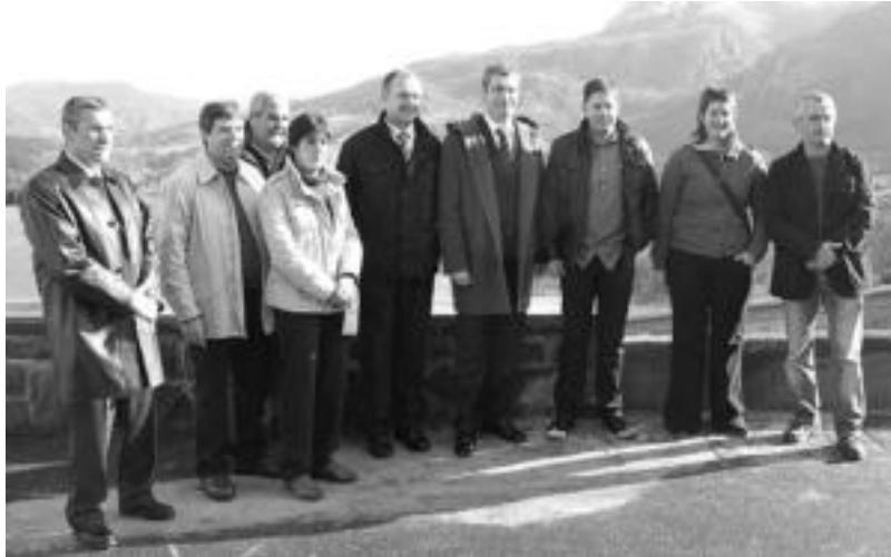
Foru Aldundiko eta Landagipuzkoa 32ren bidez inbertsioak egingo diren zenbait udalerrietako ordezkariak. I. GARCIA

Aurreneko solairuan zerbitzu alorreko enpresentzat izango litzateke. «Herrikeri leku eskaerak baditugu», dio alkateak. «Interesantea iruditzen zaigu herriko enpresa berriak bertan gelditzea, bestela arriskua daukagu alde egiteko». Bestalde, Agenda 21etik eskatu