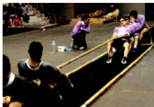
Ibarrako sokatira taldeko kideak lehiatzen.