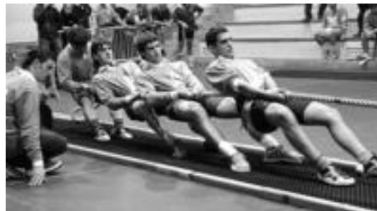
Bikain aritu dira sokatiralari ibartarrak euren lehen urtean. HITZA

Finala jokatu aurretik sailkatze-ko bi jardunaldi jokatu zituzten, non, Abadiño A eta B sailkatu ziren aurreneko bi postuetan, larunbatean gertatu bezala, alegia. Sokarrik podiuma osatzeko asmoa zuen, eta Berrundia mendean hartu bazuen ere, Auzolan taldearen aurka tiraldi bat galdu zuen eta hiru falta adierazi zizkion epaileak.