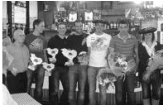
Omenaldia jaso zuten kirolariak.