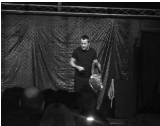
Urteurrena ospatzeko ekitaldien baitan, Txan magoaren emanaldia izan zen azaroan.

Urtean zehar hainbat ekitaldi egiten dituzte. Ikasturte hasieran, honi ongi etorria emateko festa bat egin zuten, baita mahai-futbol eta billar txapelketa ere. Azaroan berriz, urtemuga ospatu zuten. Oro har, hilabetero egiten dute ekitaldiak. Horretarako, eta erabakitzeke zer egin, gazteei galdetzen diete, hauek ere proposatu dituzten jarduerak.