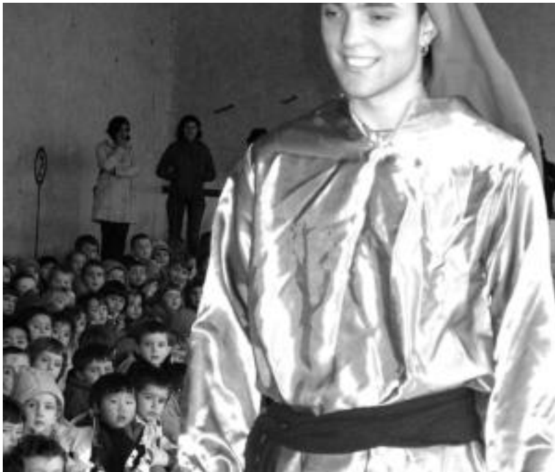
Hainbat ikastetxetan egin ohi dira ospakizunak Euskararen Egunean. Argixoren bisita lekuko. HITZA