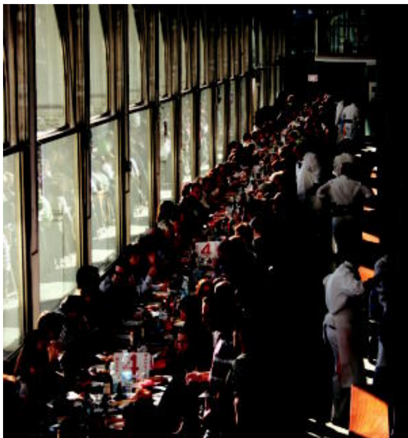
520 lagun elkartu ziren Zerkausian egin zuten herri bazkarian. GURE KAIOLA