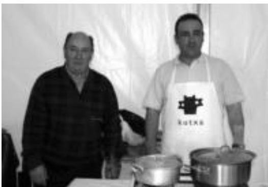
Aramendi aita-seekek. GURE KAIOLA

Ez dut sekreturik. Guztiok aurreko eguneko lehiaketan irabazte