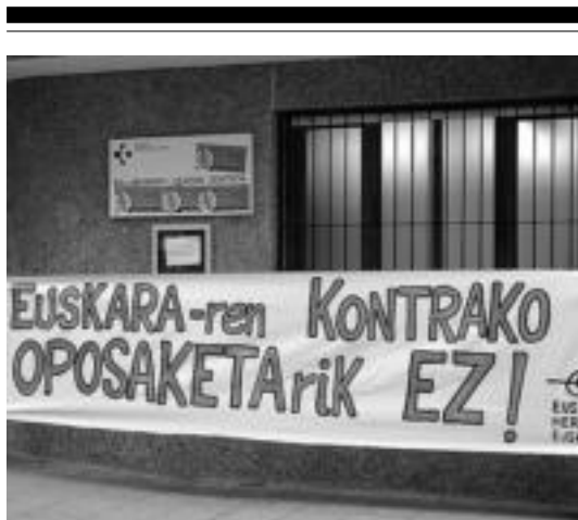
Villabonako EHEk pasa den martxoan Osakidetzaiko oposaketan euskaldunen hizkuntza eskubideen urraketa salatu zuen. HITZA