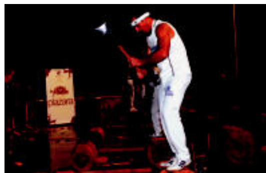
Asteasuko Usarrabi pilotalekuan izan zen herenegun kanporaketa. SARA GOMEZ

IRURA Iruñeko saioan hirugarren geratu zen, eta sailkapen orokorrean bigarren postuan dago 5