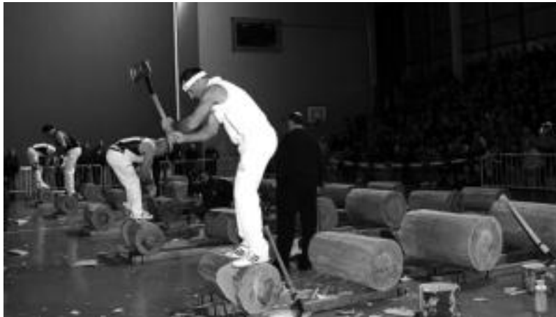
Usarrabi pilotalekuan, hamaika aizkolariek hiru txandatan aritu ziren lanean.