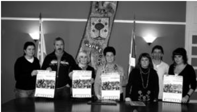
Villabona, Anoeta, Irura, Altxo eta Alegiako udal ordezkariak Loatzo Musika Eskolako kideekin elkartu ziren atzo. A.I.