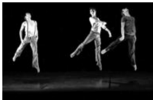
Etzi ikusgai izango den emanaldiko bi une. HITZA

izan zen, eta orain gizonezkoentzat egokitua izan da. 3 pertsonaen unibertso onirikoa sartzea proposatzen digu. Bere burua alegiazko munduaren mende utziko dute baina, aldi berean, bere kontraborrokatu dute, kolpatuko dira, inoiz etsi gabe. Nahiz eta amets motza izan, bertan atxikitzea beti merezi du, une batez errealtatetik ihes egiteko.