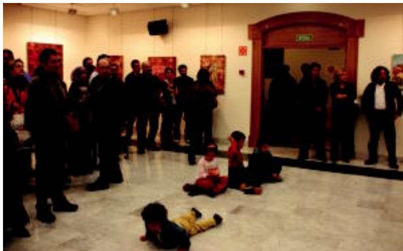
Ekuadorko, Saharako eta Ibarako ordezkariak izan ziren herenegun, Kultur Etxean egin zuten inaugurazioan. R. CALVO

EKITALDIA Alkatearen ustez, onuragarria da herriarentzat; azken txapelketa duela 25 urte jokatu zen bertan » 4