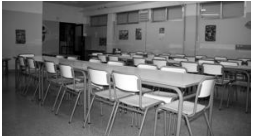
Tolosako Samaniegoko ikasleak etxera bidean, bazkaltzera; Asteasun, jangela hutsik. I. TERRADILLOS / E. MAIZ