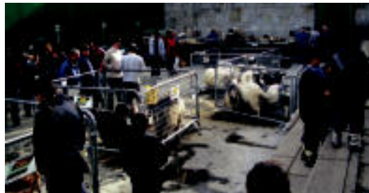
Amezketan ere herriko produktuak erosi ahal izan zituzten. HITZA

Berastegin giro ona izan zuten. Herriko produktuak izan ziren nagusi eta 15 bat postu bisitatu ahal izan ziren herriko futbol zelaian. «Jende asko gerturatu zen eta postuetan salmenta onak egin zituz-