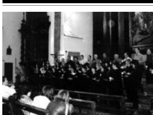
Txintxarri abesbatzako kideak. HITZA

ezkondu eta ezkongabeen arteko herri kirolak ospatu zituzten eta ondoren, amasarrek, datorren urtera arte agur esan zioten Martina sorginari eta XX. Intxorren aldatzea egin zuten. IDOIA LAHIDALGA