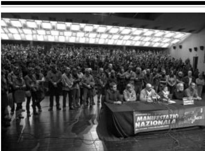
Etixeratek IX. Batzar Nazionala egin zuen herenegun Leidor Aretoan. 800 lagundik gora elkartu ziren bertan.