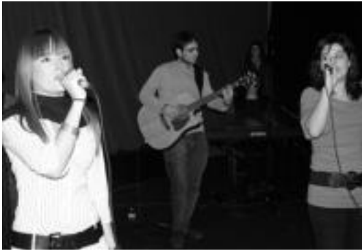
Villabonako Izaro, Aiora eta Garazi taldeko kideak. KANTUZALE ELKARTEA