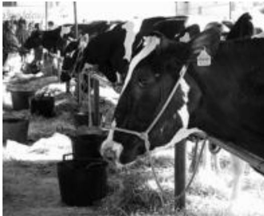
Denera, bederatzit baserriatik hurbildu ziren lehiaketan parte hartzeraz.

Ekonomia » Euskal Herriko Frisoi Txapelketa jokatu zen larunbatean; Asteasuko bi ganaduzalek hartu zuten parte bertan.