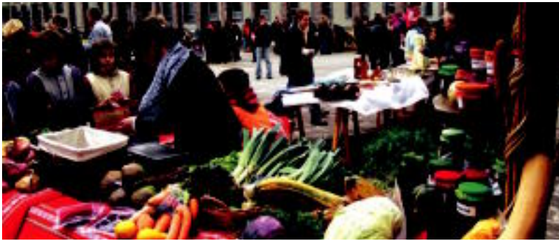
15 bat postu bildu ziren herenegun Berastegiko futbol zelaian Azoka Berezian. I. LAHALDAGA