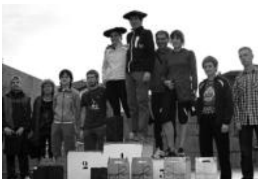
Sariak lortu zituzten korrikalariak. HITZA

gain Mendi Taldeak, bere aldetik, mendi ibilaldia antolatu zuen eta ondoren bazkaria egin zuten. 30 lagun inguruk egin zuten Otsabi-Belabieta-Loatzo-Alustiza ibilaldia eta gero bazkaria Alustizan egin zuten (eskubiko argazkian). Bestalde, gogoratu, GPS ikastaroa antolatu dutela Sagainekoek. Hilaren 23, 25, 27 eta 28an egingo dute. IDOIALAHIALGA/SAGAIN MENDI TALDEA