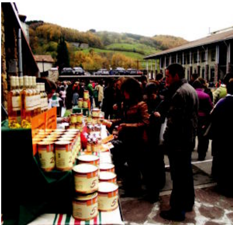
Berastegiko azoka berezian jende ugari izan zen, Amezketakoan eta Gaztelukoan bezala. I. LAHIDALGA