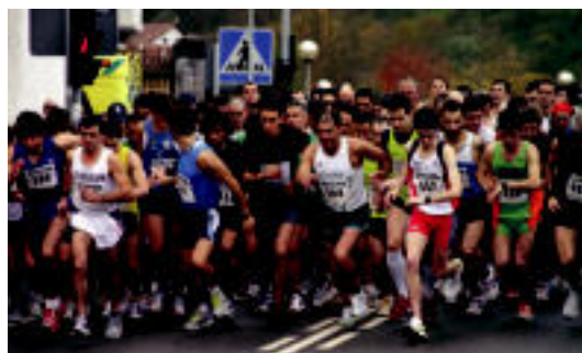
Kros Herrikoieko une bat, herenegun. HITZA

LIZARTZA Espainiako Auzitegi Gorenak bi urtetako espetxe zigorra ere berretsi du 4