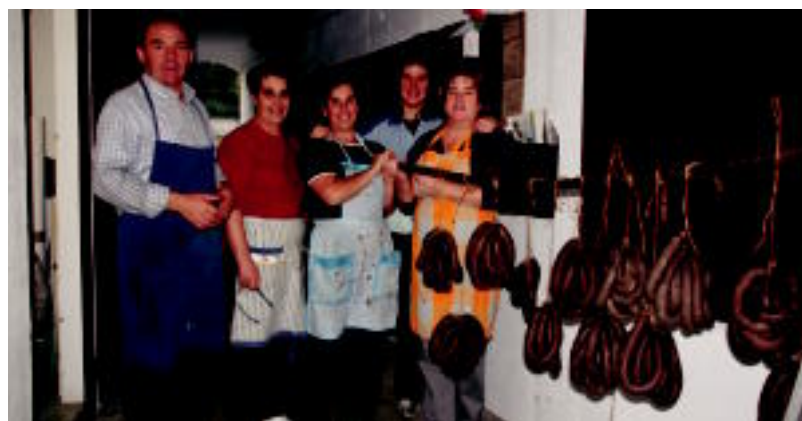
Amasan haurrak korrika saioa egin zuten eta Hernialden odolki mordoia egin zituzten.