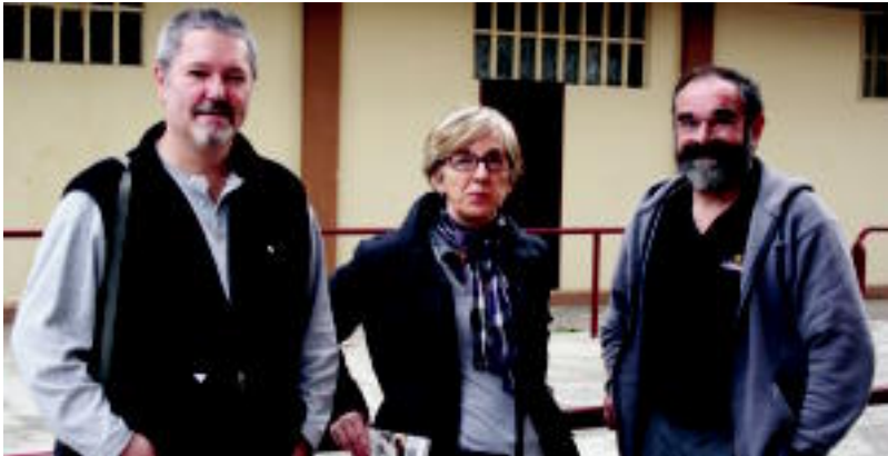
Ijurkok, Salaberriak eta Galarragak euren senide eta lagunen egoera salatuko dute gaurko batzarrean.