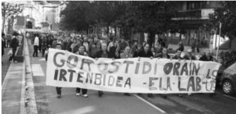
Triangulotik abiatu dira ehunka lagun Gorostidikoari irtenbidea eskatzeko. IMANOL GARCIA

Atzo eguerdiko 12:00etan jende asko elkartu zen Triangulo plazan. Gorostidiko langileak, familiako kide, langunak, beste enpresetakoak... elkartu ziren Gorostidiko zuzendaritzari irtenbidea eskatzeko. Tolosako kaleetan barrena beraien egoera salatu eta kezkek eta amorruek adierazi zituzten.