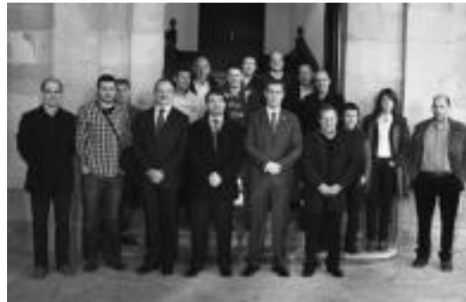
15 udalerrietako alkateak eta hainbat agintari, Ordizian. I. GURRUTXAGA