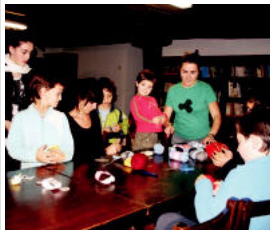
Gazteluko Kultur Astearen baitan, eskulanak izan zituzten atzo

TOLOSA Presoen senideek oinarrizko eskubideak errespetatzea eskatzen dute; «argazkiak harro erakusten ditugu ez harrokeriaz», diote 4