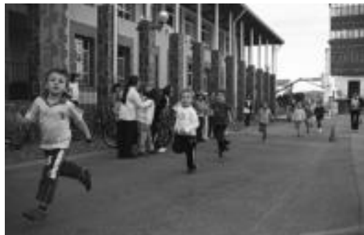
Berastegiko haurrak I. Duatloian parte hartzen eta Gazteluko gaztetxoak eskulan tailerlean. ENERITZ MAIZ

Berastegin goiza hitzaldiarekin hasi zuten eta bazkal ostein mus txapelketa eta I. duatloian parte hartu zuten. Adinaren arabera taldeka banatu zituzten eta baita ibilbidea ere. Korrika eta bizikletan egin behar izan zuten eta lasterketaren ostein merienda izan zuten. 18:00etatik aurrera Oñatiko ganbarako abesbatza eta gauean, Euskal musika emanaldia Ansa ahizpen eskutik.