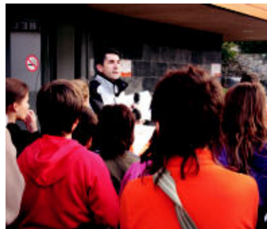
Asteasun mendian orientatu ahal izateko jokoak egin zuten.