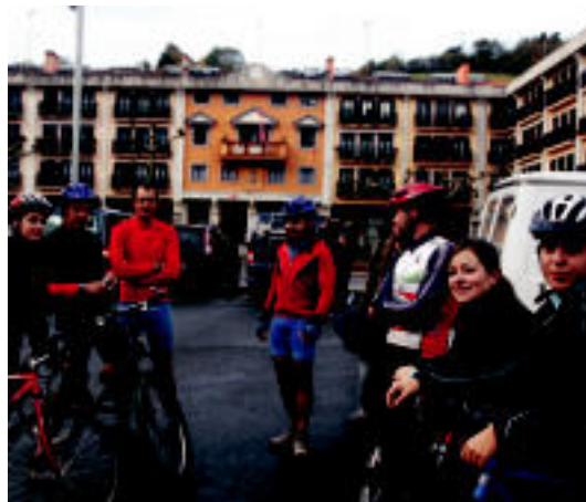
Anoetan 18 kilometroetako BTT irteera egin zuten. R. CALVO

Gaurkoan, aldiz, Anoetanginkana familiarra egingo dute kiroldegian 11:00etan eta Asteasun mendi irteera egingo dute goizean.