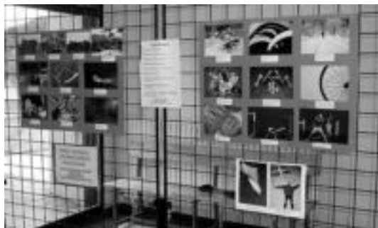
Argazki lehiaketan parte hartu duten argazkiak ikusgai. HITZA