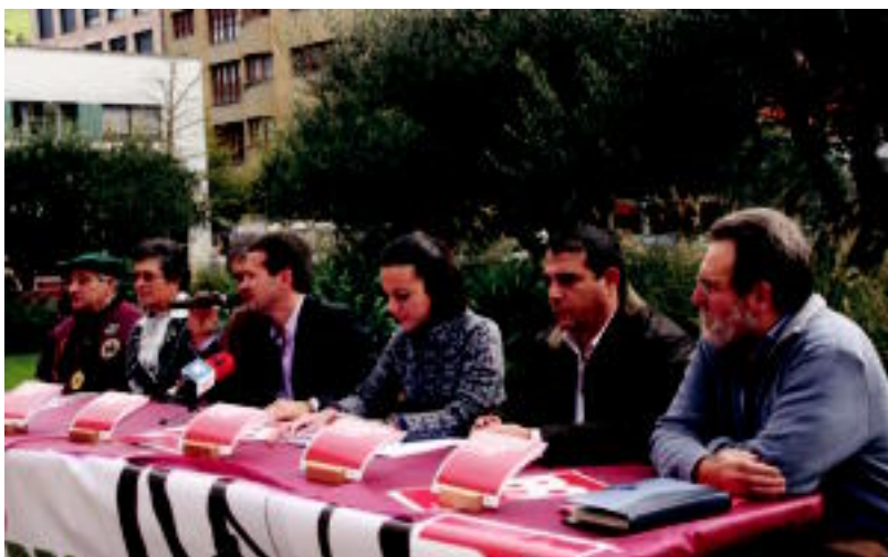
Atzo egin zuten Babarrunaren Asteko aurkezpena, Emeterio Arrese plazako baratzan ondoan. ESTI EZEIZA