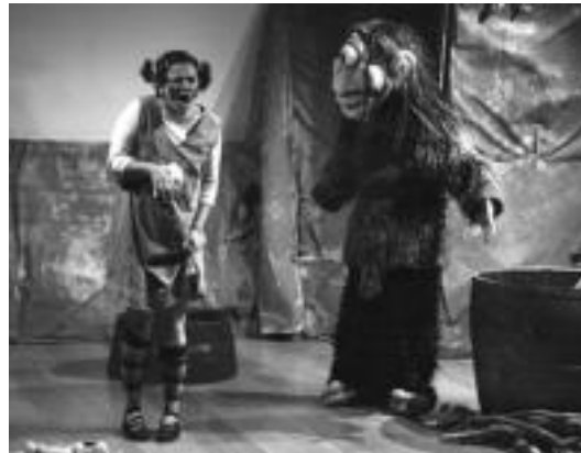
Asteasun ere jaso zuten Oihanaren eta Tartaloren bisita pasa den hilean. E.E

Tenconten antzerki taldearen ingurumenua emanaldia zuten aurreikusita hasiera batean. Baina taldearen arazoengatik, bertan be-