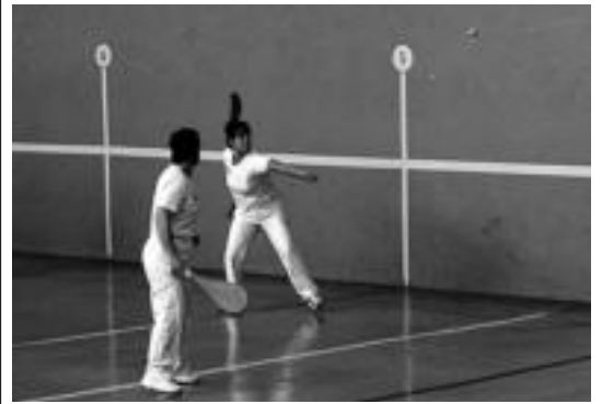
6. jardunaldiko Aiako partidetan ateratako irudia.

■ 12:00. Ekuadorreko eta Saharako jakien dastatzea San Bartolome plazan.