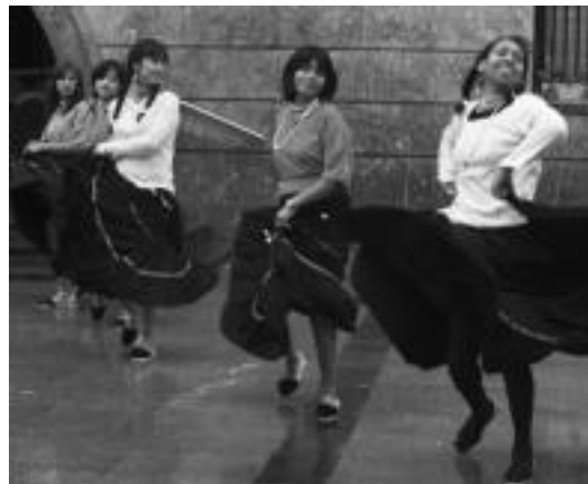
Iaz ere Ekuadorreko dantzak ikusteko aukera izan zen. IYUYA URRUTIA

51º film laburra Jose Requejo zuzendariarena da. Lanak bi zati ditu: lehenengoan Saharako kanpamenduetako bizitzari buruzko informazioa ematen du egileak, eta bigarren goan, kutsu dramatikoak ematen dio lanari telean zere monia aitzakizat hartuta.