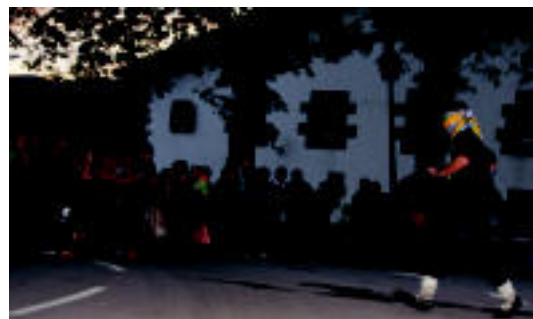
Urtero bezala, umore onari gogor eutsi zioten gazteek. E. MAIZ

AMASA Gazte egunaren ondoren txikien txanda izango da, Pirritx eta Porrotxen emanaldiarekin 5