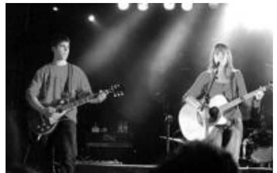
Lain taldea zuzenean entzuteko aukera izango da bihar gauean.