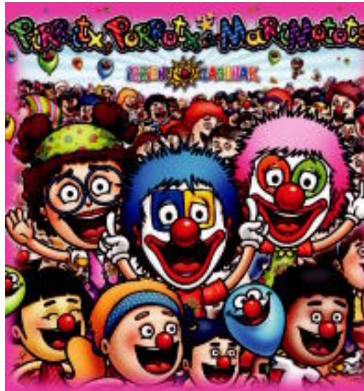
Gaurtik aurrera, HITZAren harpidedunek Pirritx eta Porrotx pailazoaren disko eta DVD berria eskatu ahal izango dute. HITZA

Ikuskizun hori grabatu egin dute pailazoek, eta gainera erreportajeekin, bideoklipekin, abes-