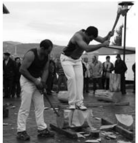
Otaegi ari da aikorran eta beste aikolaria Otaño izan zen. E. MAIZ