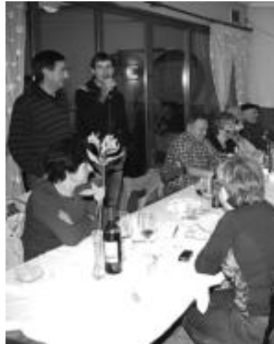
Bazkaldu ostean bertsolariek saioa egin zuten eta haurrak puzgarrietan ibili ziren. IMANOL GARCIA

Kultur Asteko egitarauarekin gaur jarraituko dute. Ipar gazi hego geza 20:30ean balioaniztun gelan ikusteko aukera izango da. Bertan, familia giroan bizikletaz bidaiatzeko esperientzia hurbiletik erakutsiko dute, ekintzak igandera bitarte izango dira.