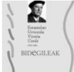
'Bidegileak' liburuaren azala.

an; Igorre, Artxanda eta Laredon ondoren. Hemen preso hartu zuten 12 urteko zigorra ezarrita. Espetxean zela Metodo Aleman idatzi zuen, bizi izan zituen torturen eta gerragordinaren berri emanaz. Herria utzi eta Valentziako Burrianara alde egin zuen baina herriminak jota Tolosara bueltatu zen 70. hamarkadan. Ondoren, isilpeko sindikalgitza aritu zen lanean. Jubitlatu arte, Eskolapioetan aritu zen irakasle lanetan. Artiku-