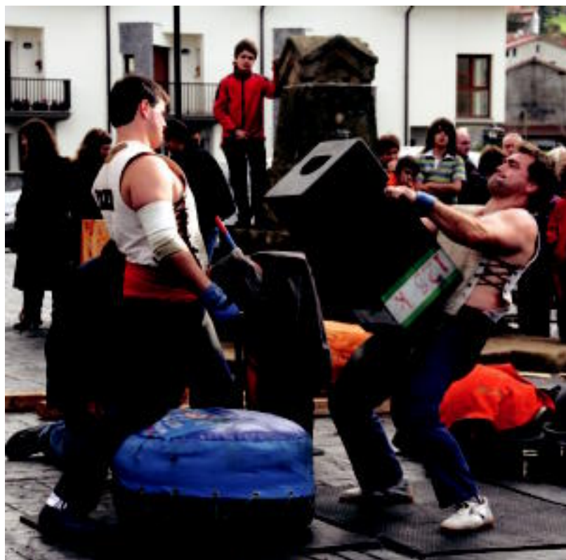
San Martin Egunean eguraldiak etenalditxo eskaini zuen eta herri kirol erakustaldia egin ahal izan zen. E.MAIZ