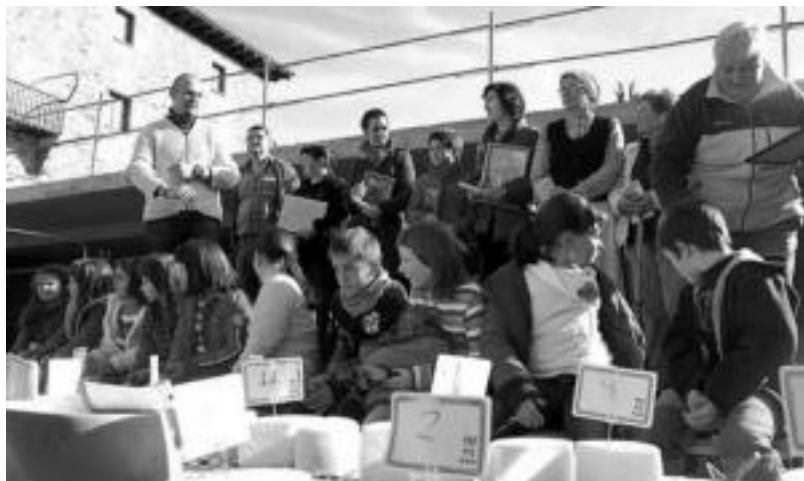
laz Azoka Eguneko Gazta Lehiaketan 15 gaztagilek hartu zuten parte. HITZA

Euroa sartu zenean pezeten eta euroen arteko aldatuta errazteko egin zuten Azoka Eguna lehen aldiz orain hamaika urte, baina bailarako produktuak plazaratzeko garrantziaz ohartuta urtero egitea adostu zuten Udaleko arduradunek. Bilduko diren 15 postuez gain, hala ere, Azoka Egunean txapelketa desberdinak ere egingo dituzte. Batetik, II. Ardi-Ahari-Bildots