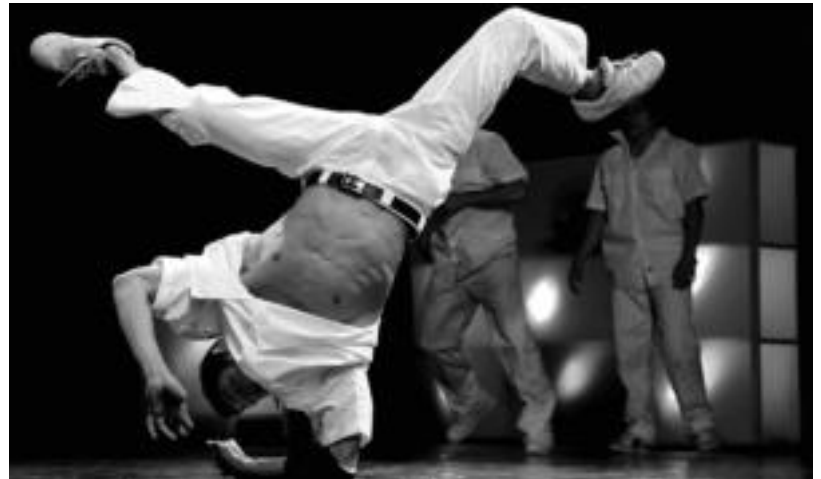
Breakdance dantza estiloa eta multimedia uztartzen dira 'Papiro Flexia' izeneko emanaldian. HITZA

Papiro Flexia lanaren helburua da, metaforikoki, papiroflexia eta gizakion sormen prozesua alderatzea. Horretarako, Logela Multimedia irudia eta soinua jarriko