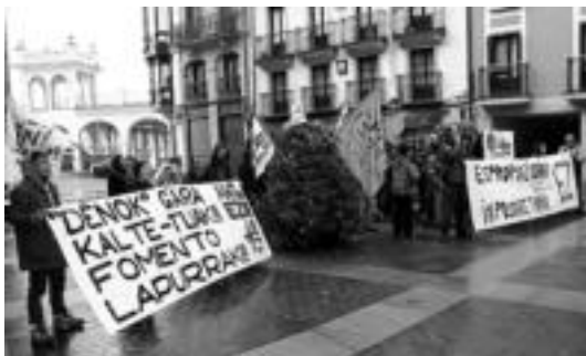
Ertzaintzaren presentzian burutu zuten elkarretaratzea, atzo. I.T.