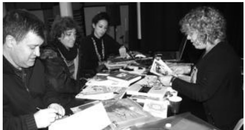
Historian eredu izan diren hainbat komikiren bitartez aztertu zuten atzo gaia, Tolosako Kultur Etxean. E. EZEIZA

emakumeak isladatzen diren aztertzerako garaian, hiru dira kontuan hartzen diren puntuak. Alde batetik, begirada dago. Hau da, komikiak emakumearenganako