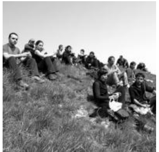
Mendibil Mendi Taldeak aurten 'Mugarrien Itzulua' antolatu du.