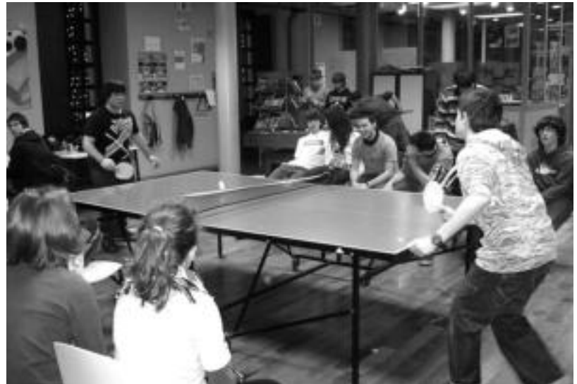
Urtean zehar hainbat ekitaldi egiten dituzte Topaguneak, tartean, Gazte Astea. HITZA

Tolosako Topaguneak, asteburuetan, bertan egoteko eta lagunartean elkartzeko aukeraz gain, tailerrak, ikastaroak, jolasak eta hainbat irteeratan parte hartzeko aukera eskaintzen du. Hau 13-17 urte bitarteko gazteei zuzenduta dago, eta bi dinamizatzailerak gunearen arduradunak dira. Ostegun eta ostiralean, 17:00etatik 20:00etara dago zabalik, eta asteburuetan, 16:30etik 20:30era.