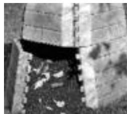
Duela bi urte ere egin zuten kanpaina; irudian, Fraisoron egindako saioa.

Era berean, posta elektronikoz eta telefonoz aholkularitza-zerbitzua eskainiko da sortzen diren zantziak eta arazoak konpontze alderantz.