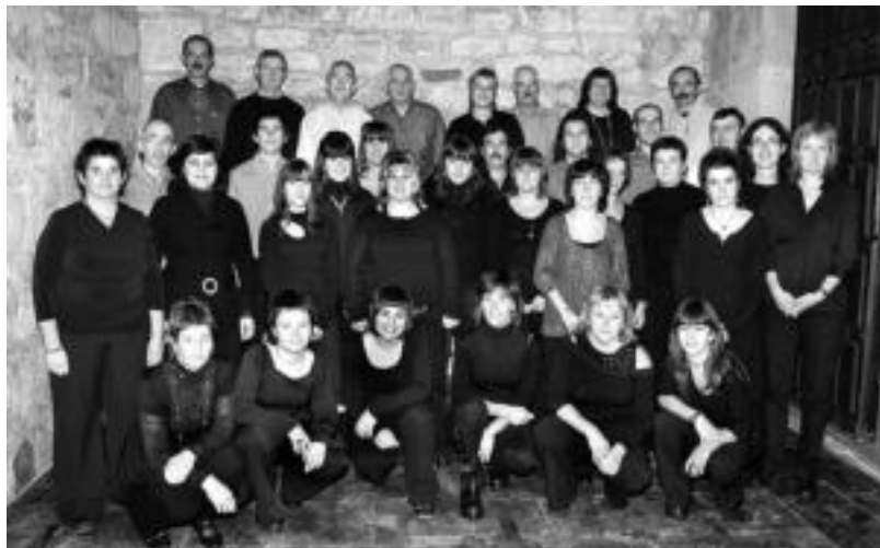
Txintxarri abesbatzako kideak iazko Txintxarri Egunean.