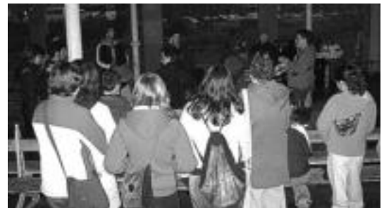
Duela bost urte inauguratu zuten Tolosako Gazte Topagunea. M. SOROA

■ 16:00. Argazki emanaldia. Kultur Etxeko Topagunean.