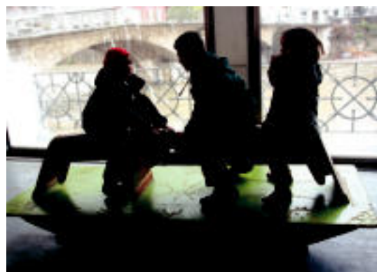
Arratsaldean, aldiz, umeen eta herri jolasen txanda izan zen. R. CALVO