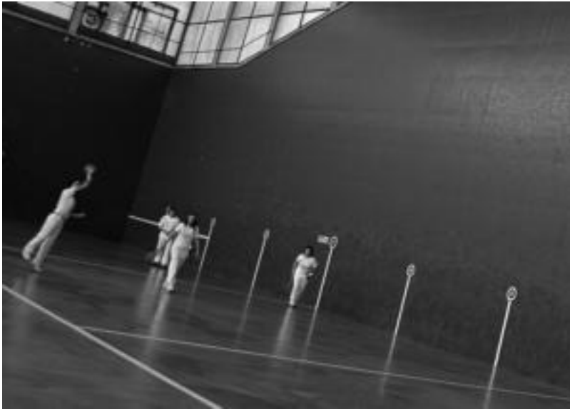
Ikaztegiatan pilotalekuan Emakumea Pilotari txapelketako partidak jokatu zituzten atzo. A. IMAZ