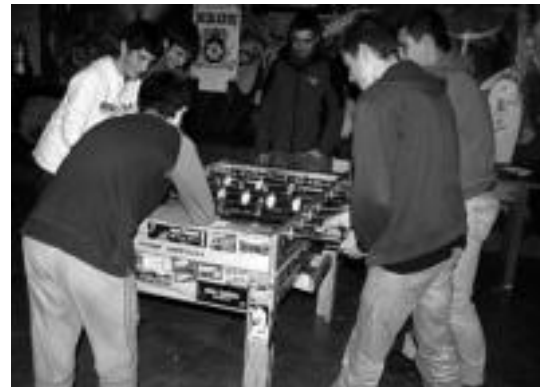
Ibarrako Gazte Asanbladaren Kultur Astean futboli txapelketa. A. IMAZ