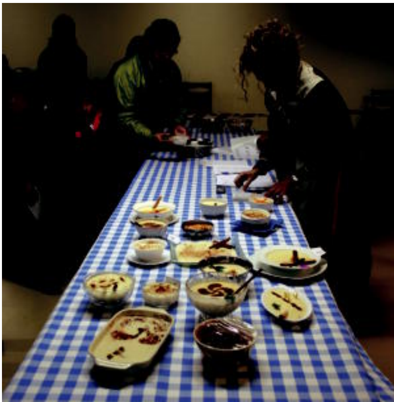
Berastegin arroz esne lehiaketa antolatu dute aurtengoan. Irudian, atzo, parte-hartzaileak platera prestatzen. A. IMAZ