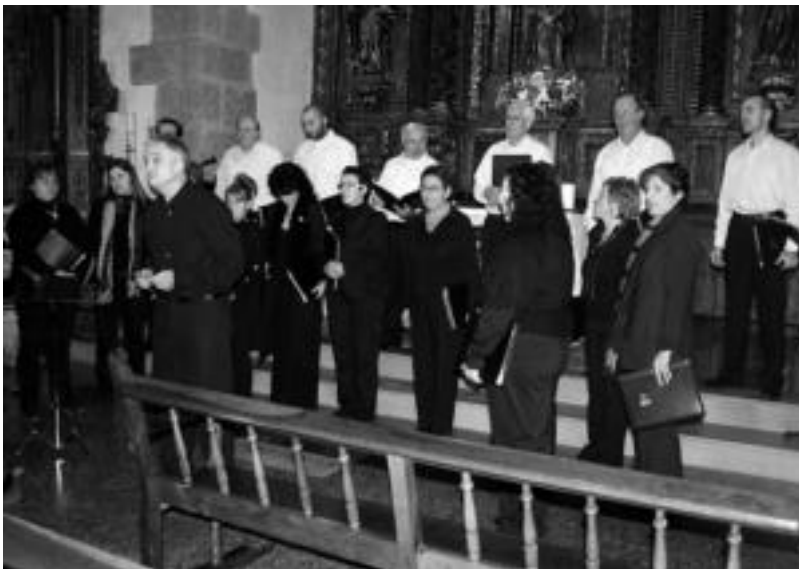
Amezketako Kultur Astearen baitan, bi ekitaldi izan zituzten Ugarten. Irudian Eresargi abesbatzaren emanaldia. A. IMAZ