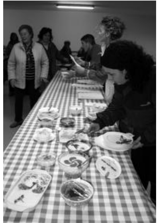
Arroz esne txapelketa egin zuten Berastegiko Kultur Astean.