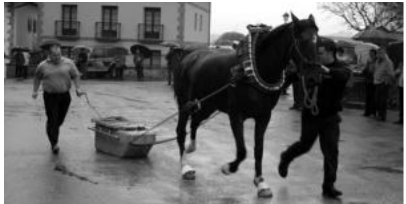
laz Amasako jaietan zaldi proba izan zuten, aurtien idiak izango dira. IMANOL GARCIA

VILLABONA ● Gaztelekuaren sortzeko prozesu parte-hartzailearen barnean, herriko nerabeek beste urrats bat eman dute. Gaztegunean bertan grabaketa lanak egiten aritu dira DBH1 eta 2 mailako ikasleak. Kazetari bihurtu eta aste honetan erreportaje bat grabatu dute. Bertan gaztelekuak behar dituen, igogailua, sukaldea, jolaserako gunea... bildu dute. e.m.