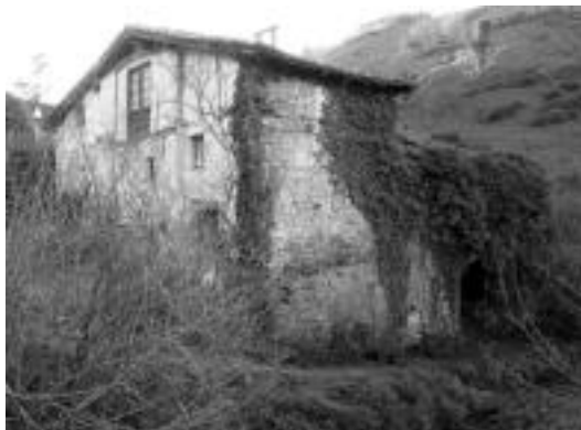
Goian, Ierabizkar Behekoa errota berritua. Behean, berritua aurretik.

keztuko dute. Etxe horretan Pernando Amezketarrari buruzko interpretazio zentroa egiteko asmoa dago.