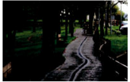
Bide egokituaren zati bat Larraitz auzoan. I. GARCIA