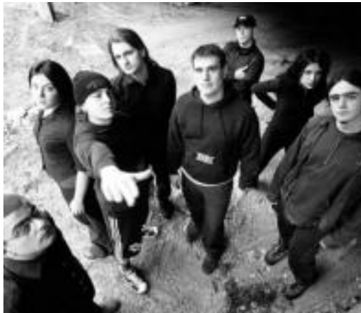
'Zirikatzen jarraituz Tour' ibilbidearen azken kontzertua eskainiko du Arrasateko taldeak, bihar, Anoetako Gaztetxean. HITZA

Hala, 2003az geroztik isilean egon den taldea berriro ere taula gainean ikusi ahal izango dute Anoetara gerturatzen direnek. Pasa den urtarrilaren 8an egin zuten beraien itzulerako aurkezpena Bilboko Kafe Antzokian. Zirika-