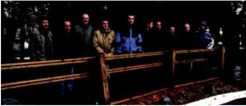
Enirio-Aralar Mankomunitateko zenbait alkate, Uribarren, Iturbe eta Olanorekin batera. I. GARCIA