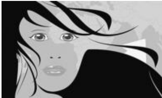
Hitzaldirako eta Komiki Lehiaketarako erabili duten irudia. HITZA

Gizartea » Hilaren 10ean hitzaldia izango da, eta martxan da II. Tolosaldeko Emakumeen eta Migrazioen Komiki Lehiaketa.