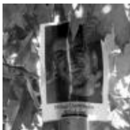
Era haueko kartelak kendu dira.