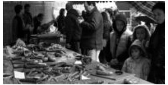
Iaz ere babarruna eta txerriaren festa egin zuten. IDOIALA HILDALGA

Hauspibarra kultur elkarteak iganderako prestatu duen festan parte hartzerako gonbidatzen ditu herritar guztiak.