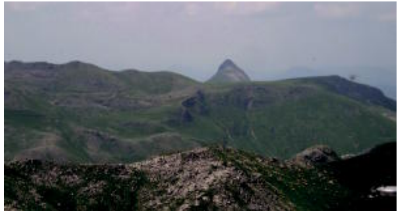
Malloetan zehar ibiliko dira larunbatean Oargiko mendizaleak.

Antolatzaileek zortzi ordu inguruko ibilaldia izango dela aurreikusit dute. Interesatuak izena eman dezakete 688698642 telefono zenbakian edo info@oargi.org helbidean.