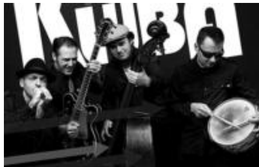
The Kluba taldeko kideak.