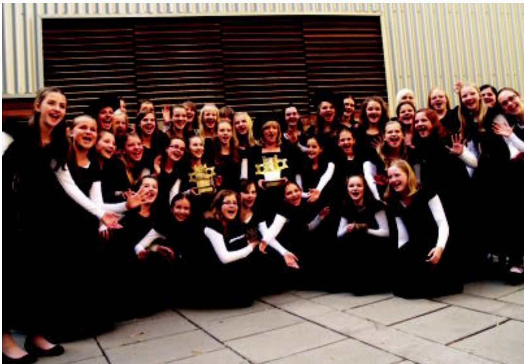
Letoniako Rida Katedraleko Haur Abesbatzeko kideak sariekin, pozik, herenegun. I. LAHIDALGA