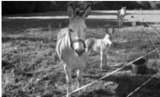
Asto jatea egingo dute bihar, pilotalekuan, 21:00etatik aurrera.