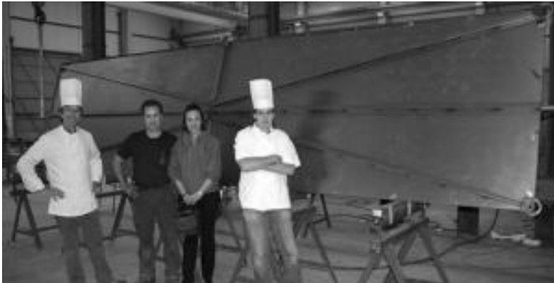
Tolosako Urto lantegian egin dute txokolate tableta egiteko moldea. IMANOL GARCIA