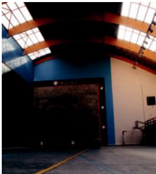
Aurrerantzean itxura hau izango du Elorri pilotalekua.

Espainiako Gobernuak udalei emandako diru laguntzarekin frontoiaren eta gimnasioaren teilatua guztiz berritu dituzte eta horrez gain hainbat konponketa eta aldaketa egin dituzte; esate baterako, ezker horma berdez margotu dute eta frontoiaren kanpo geldituzen diren hormak urdinez margotu dituzte. Harmailak ere margotu dituzte Bestalde, frontoitik