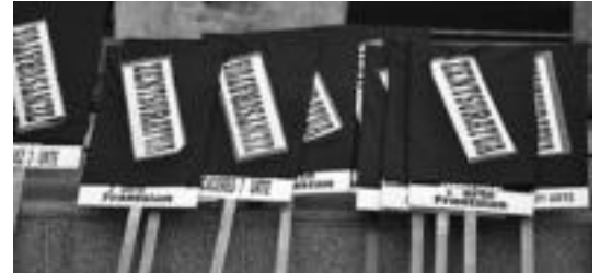
Presoen argazkiak estalita jarri zituzten debekuengatik.

Politika » Ohikoa den bezala, hilabeteko azken ostirala izaki, bilkurak egingo dituzte eskualdeko hainbat herritan.