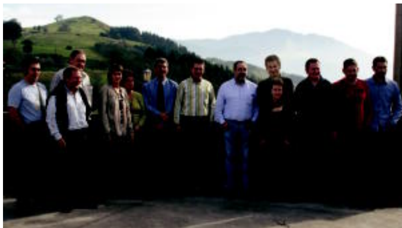
Foru Aldundiko, udaletako, Tolosaldea Garatzeneko eta Tolomendiko ordezkariak, atzo Alkizan eginiko aurkezpenean. I.G.

HELBURUA Garapen iraunkorra eskualdean bultzatu nahi dute; Foru Aldundiak hiru urtez lagunduko du diruz 6