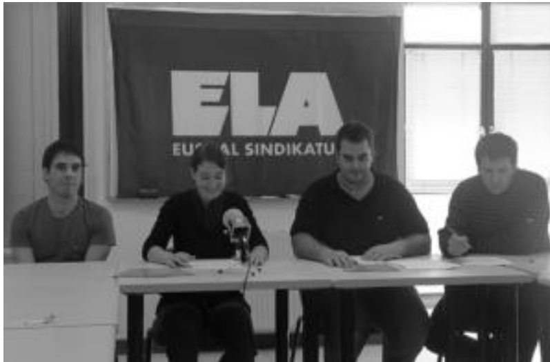
Amenabar, Amiano, Oianguren, eta Iturbe, LAB eta ELA sindikatuak ordezkariek, dekalogoaren aurkezpenean. E.L.

«Gobernu eta instituzio desberdinek burutzen dituzten politika publikoen inguruan ere» baikortasunik ez dagoela gehitu du Amianok, azken urte hauetan «atzera pauso nabarmenak eman direla-