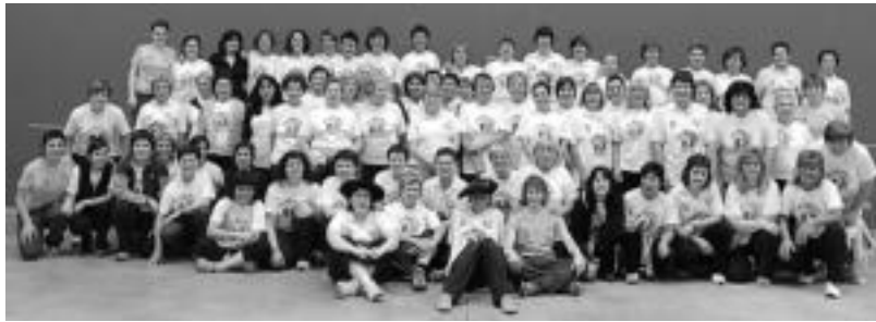
Iazko Emakume Pilotari Egunean 80 bat emakume bildu zen Iruran. HITZA

Ibarra » 18 urtetik gorako emakumezkoentzako ikastaroa izango da; duela bi urte egin zuten lehen aldiz.