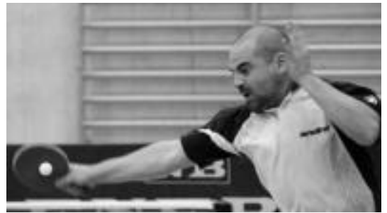
Denboraldiko lehen partidak jokatu dituzte eskualdeko jokalariek. HITZA

TOLOSA ● Orixen institutuan gurasoentzako eskolak antolatu dituzte. Hala, lehendabiziko saioa gaur bertan izango da. Bertan, seme-alabaren lagunez eta autoestimiaz mintzatuko dira. Beraz, Orixen, Gorosabeleko liburutegian bilduko dira 18:30ean.