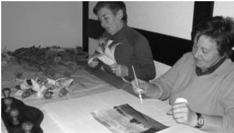
Esulan ezberdinak egiten ari dira bi emakumeak, kasu honetan, Albizturren. ESTI EZEIZA