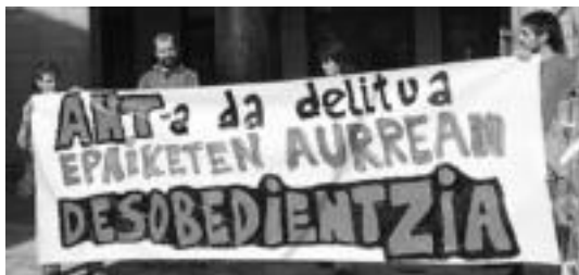
Elkarretaratzea egin zuten epaiketaren aurka egiten ari ziren bitartean. E. EZEIZA

Lehen akusazioa «desordena publikoak» egotzita delituztat jarri bazuten ere, epailek falta gisa epaitzea erabaki zuten. «Gauzak hala, fiskalak egun bakoitzeko 6 euroko isunarekin, 30 egun eskatu ditu desordena publikoak direla eta, eta 6 pertsonetatik 2ri, ertzainak iraundu zituztela egotzita,