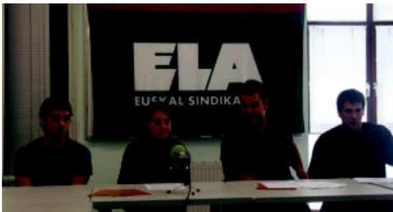
Atzo aurkeztu zuten dekalogoia LAB eta ELA sindikatuetakoko ordezkariak. ESKEINE LEGORBURU

ZABALKUNDEA Tolosaldeko eta Goierriko herri guztietan landuko dute, lantegiz lantegi datozen egunetan 2