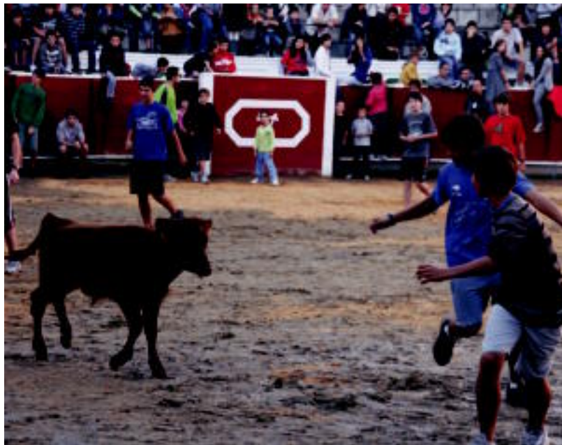
Jende ugari hurbildu zen atzo arratsaldean, zezen-plazara, zezen txokoak ikusteko nahiz hauen aurrean korri egiteko. E. E.

Horretarako, eguraldiaren laguntza izan zuten. Izan ere, goiz guztian, euririk atsedenik eman ez bazuen ere, azkenean, arratsaldean atertu zuten, eta kalera, ateriaren beharrik gabe atertu ahal izan ziren. Horrela, bazkaltzeko egokitu zuten tokiaren ondoan, toka txapelketa jokatu zen. Bestetik, aipatu bezala, zezen-plazan,