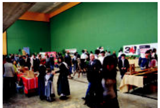
Postu ugari bildu ziren frontoian, eguraldia zela-eta bertan egin baitzuten s.g.

Jendeak oso ondo erantzun zuen eta horrek animatu egiten du. «Ez dakigu esaten iaz baino jende gehiago edo gutxiago izan zen baina giro ezin hobea izan zen, ar gehiago eurria egin zuela kontuan hartuz».