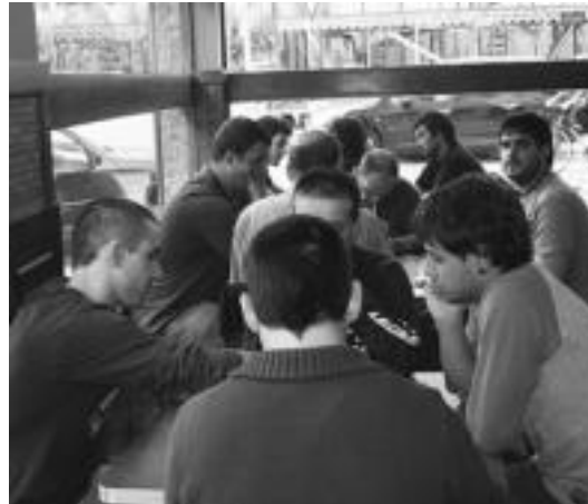
Mus txapelketa jokaatu zuten 66 eta Ordizia tabernetan. N. LATABURU