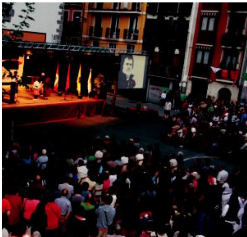
Ehunka lagun bildu ziren Errebote plazan; taulatik «Remi gure bihotzean geratuko dela» gogoratu zuten.