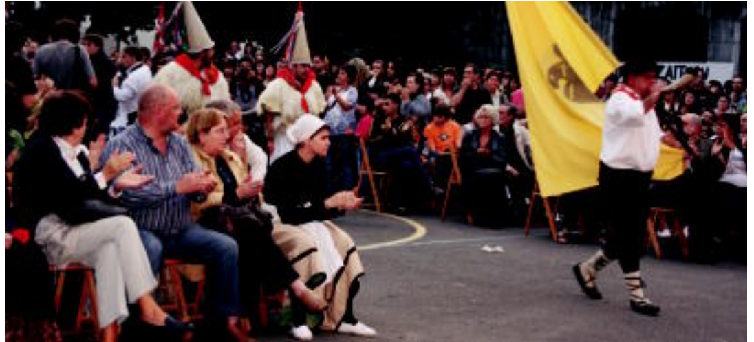
Donostiako Alde Zaharreko zarpantzarrek iragarri zuten omenaldi-ekitaldiaren hasiera; ordurako plaza jendez beteta zegoen. E. EZEIZA

sortu zuten bere inguruko lagunak. Hauek urtean zehar ekintza ezberdinak antolatzeko asmoa dute, eta atzokoa izan zen lehen-dabizkkoa.