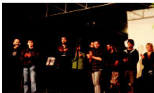
Hainbat koadrila eta elkarteren nikiak eskegi zituzten; Ayestarane Burgosko lagunak ere etorri ziren omenaldian parte hartzera. E. EZEIZA