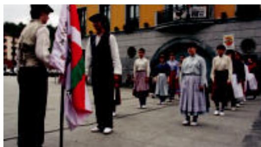
Senidetze ekitaldian dantzarien emanaldia izan zen.

IBARRA Euskal Herria Eguna ospatu zuten atzo Ibarrek eta Lizarrak; bi herriak senidetu ziren 4