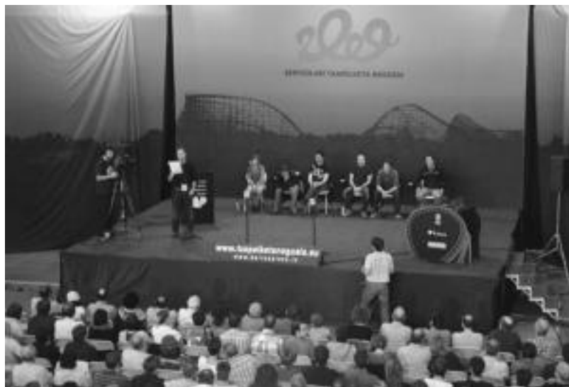
Leitzako Udal Kiroldagian jokatu zuten atzo Bertsolari Txapelketa Nagusiko bigarren kanporaketa.