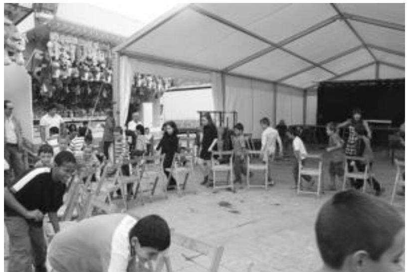
Umeek aulkirik gabe ez geratzeko ahalegina egin zuten. N. LATABURU