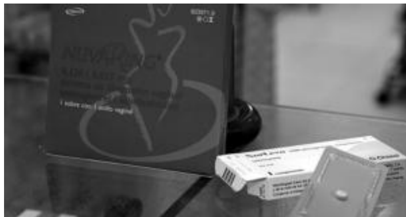
Botikariek biharamuneko pilula errezetarik gabe banatzearen erabakian kontraesanak nabarmendu dituzte, izan ere baginako eraztuna, adibidez, errezetarekin eskuratu behar da. R. CALVO

Ez dira ohikoak, arinak dira. Hala ere, urdaihesteetako arazoak, batez ere goragalea, sortu ditzazke; pilula hartu eta hiru ordu baino lehen oka eginez gero berriz ere hartu behar da. Zefaleak, zorabioak eta hilekoaren zikloaren aldaketak ere sortu ditzazke, eta titi-sentsibiltatea ere hareagotu ahal du.