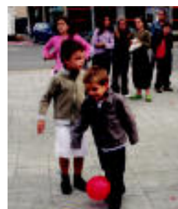
Haurrak puzgarriekin jolasean. NL

TOLOSA Atzo ere izan zuten zer gozatua; gaur, besteak beste, Manenten kontzertua 7