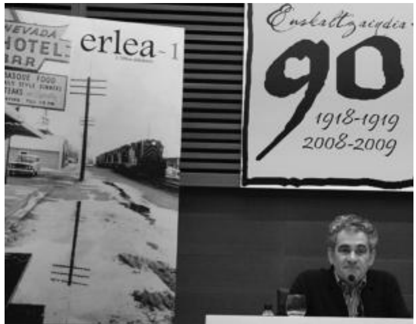
Bernardo Atxaga, Kursaalaren atzo egin zen aurkezpen ekitaldian.

TOLOSA » DYA Gipuzkoako antolatuta, DEAKo ekipoen erabilerarako ikastaroa antolatu dute urriaren 19 eta 20rako Tolosan. Bi egunetako ikastaroa 16:00etatik 20:00etara izango da DYAKo ordezkaritzan, hau da, Larramendi 7 helbidean. Bihotzaren taupadak neurtzeko, hilgarriak eta desfibrilazioa behar duten arritmiak identifikatzeko balioko du ordenagailuko sistema honek. Matrikularen kostea 100 eurokoa da eta ikastarorako txostena barnean hartzen du. Izena emateko edo informazio gehiago jasoitzeko deitu 943 464622 telefono zenbakira.