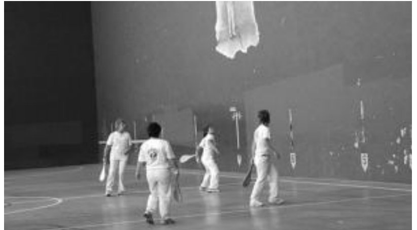
Zaldibiako pilotalekuan jokatu ziren lehen jardunaldiko partida batzuk; bertan eskualdeko pilotariak izan ziren. E. EZEIZA

■ Ordularia. Joan zen urriaren 2an, ordulari bat aurkitu zen Irurako jaietan. Harremanetan jartzeko deitu telefono zenbaki honetara: 619 57 61 25era.