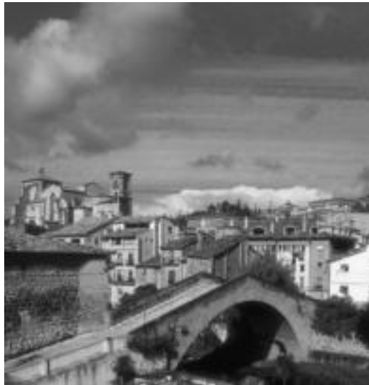
Lizarrarekin anaidetuko da Ibarra larunbat honetan.