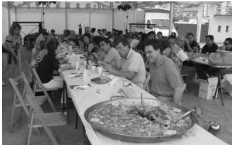
Aurten ere herri bazkaria izango da Berazubin. A. IMAZ

Jai hauen ezaugarri berezietako bat musika dela diote Berazubi au-