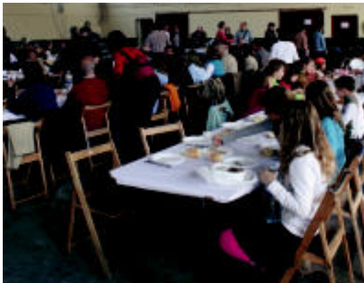
Jendetza bildu ohi da auzoko bazkarian; urriaren 18an egingo dute. A. OTEZABAL