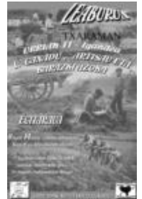
09:00etatik 14:00etara izango da azoka. HITZA

Azokan parte hartuko duten guztiak, bai antolatzaileak eta baita sal-