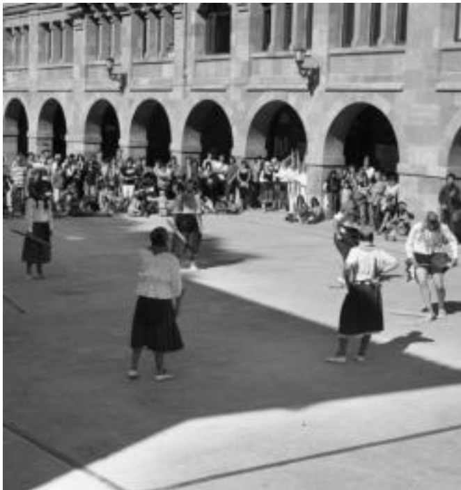
Aurrerako dantzarien Xiberoako makil dantzak giroa gori-gorian jarri zuten. A. IMAZ