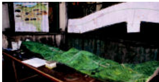
Gazume eta erraustegiaren inguruko erakusketa jarri zuten.