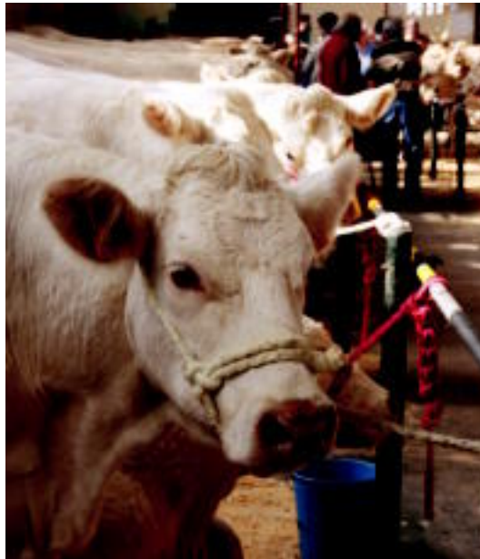
Limousin, blonda eta pirenaika arrazako abereak bildu ziren. R. CALVO

Abelburu dotoreak ikusi ahal izan ziren eta salmantan jarri zituzten 27 buruetatik 6 besterik ez zituzten saldu. Nabarmendu beharreko salmentarik ere egon zen, enkantean jarritako Limousin arrazako behietako bat 3.600 euroan jarri zuten eta azkenean 4.200 euroren truke saldu zuten.