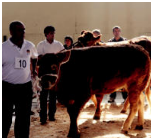
Abere ugari eraman zituzten Ferialekura.

LEITZA Jai giroan ospatu zuen atzokoan Aurrera Kirol Elkarteak bere eguna; ekitaldi ugari izan zituzten egun osoan zehar herriko plazan 7