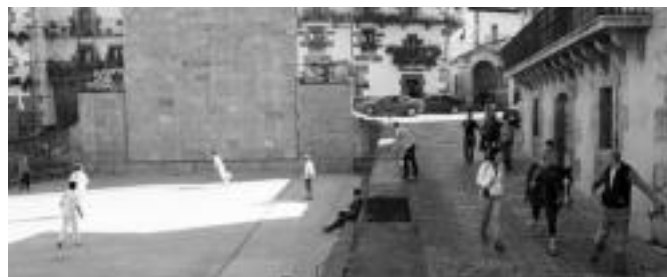
Aurrera Elkartetik plazara tirolinaren bidez. Plazan pilotan eta zaldiz ibili ziren. A. IMAZ