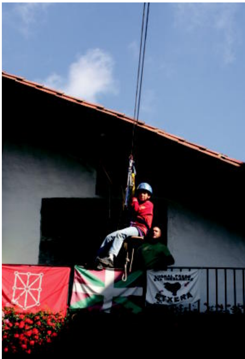
Tirolina jarri zuten balkoitik, eta gaztetxoek ederki igaro zuten. A. IMAZ