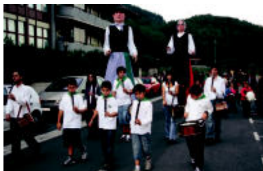
Plazatik herriko elkartera kalejira egin zuten. I.T.

BERASTEGI Hilabete honetan jakingo dute herritarrek Berastegiko udaletxeak izendapena izango duen; bailara suspertzeko balioko du 6