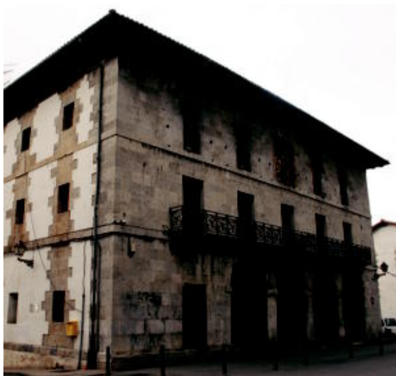
Eraikinaren eta bere inguruaren babesa lortuko luke izendapena lortuko balu udaletxeak. A. IMAZ

HASIERA Irazu, Agirre, Mendiluze eta Muñoa ariko dira txapelaren bila; gaur hasiko da txapelketa Zestoan 2