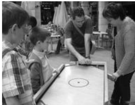
Adin guztiei zuzenduriko jokoak egiten dituzte. HITZA

Zurezko jolas tresnak ekarriko dituzte Herrialde Katalanetako artista hauek. Lehendabiziko saioa 10:30etik 13:30era izango da,