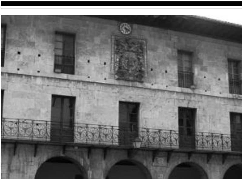
Monumentu izendapena lortuko balu eraikina beraren eta bere inguruaren babesa lortuko luke udaletxeak. A. IMAZ