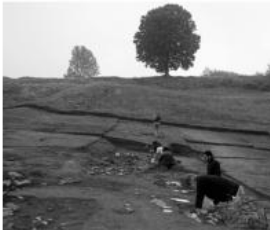
Basagain eremuaren zati bat. Bertan indusketa lanetan boluntarioak. A. IMAZ

esate baterako zerealak. Basagainen nire ustez oraindik eta garrantzi handiagoa dauka: herri hau harresi batez inguraturik zegoen; ingurune guztia bikain ikusten da bertatik: Oriak bailara, Ernio inguru eta baita kosta ere; eraikuntza materialak aurkitu ditugu; burdinezko eta brontzezko piezak; bur-