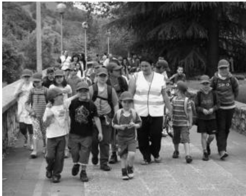
Ekainean egin zuten lehendabiziko froga eta orain martxan jarri dute. N.L.

Hezkuntza » 40-45 haur inguruk oinez egiten dute orain eskolarako bidea; gaztetxoaren autonomia bultzatzeko bidea da.