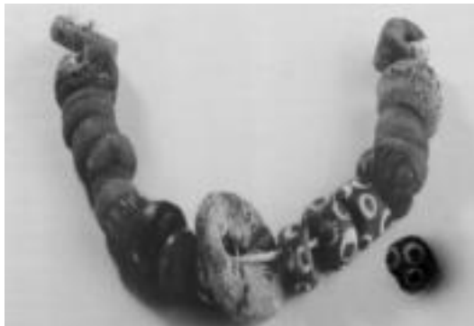
Liburuko pultseraren zati berdina aurkitu dute aurten Basagainen. A. IMAZ

din kantitate handia, herrian bertan lantzen zuten seinale... eta hori gutxi balitz, apaindutako estela bat agertu zen iaz. Etxeen inguruan azaldu izana eta ez hilerrian, iker-tu beharreko gauza bat da.