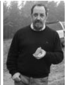
Peñalberrekin. A. IMAZ

Gipuzkoako Foru Aldunditik etorri ziren aste hasieran lekua ikustera. Garrantzi handia duen gunea dela esan genien, emaitzak ere maila berekoak direlako. Indusketekin jarraitzeko, apostu bat merezi duen lekua da Basagain. Baliabide gehiagorekin egiten baldin badira hobe, baina gutxienez jarraipena nahiko genuke; lanak etetea akats bat litzateke. Baina ikusiko da.