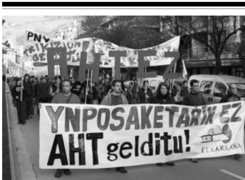
Iaz Tolosan egin zen Abiadura Handiko Trenaren aurkako manifestazioa. E. EZEIZA