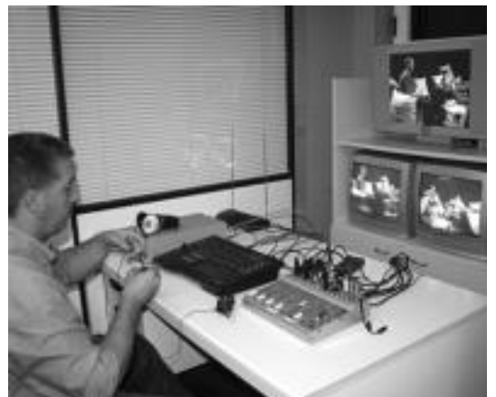
Programazio berria abiarazi du 28 Kanalak; eskualdeko alkate guztiak elkarriketatuko dituzte; lehena Hernialdekoa izan da. N. LATABURU