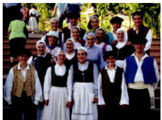
Oinarriko eta jarraipen ikastaroak antolatu dituzte helduentzat; besteak beste, arin-arina eta fandangoa ikasiko dute. HITZA