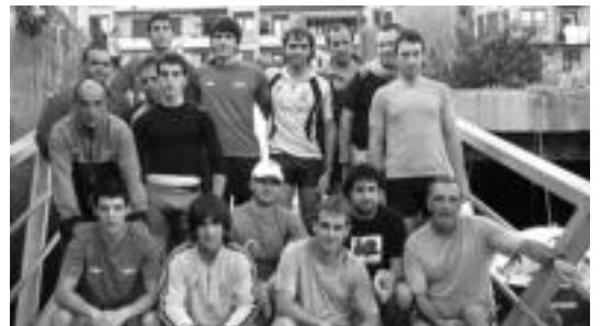
Maila bakoitzeko zortzi arraunlari eta lemazain bat ariko dira. HITZA

Orain delabaste jaso zuten tolosarrek kataluniarrek utzitako llaüt ontzia eta ordutik egunero ari dira entrenatzen Pasaian. Llaüt ontziak ez dira hemen erabiltzen diren traineruak bezalakoak. «Traineru baten zabalera du, baina trainerilla baten luzera, oso oso motela da, ez dago txapelketetarako sortua, arraunkera tradizionalen pentsatutako ontzia da», argitu du Elizasuk. Azken bi asteetan, hortaz, ontzi berriari tankera hartzen aritu dira tolosarrak. «Neurri alde-