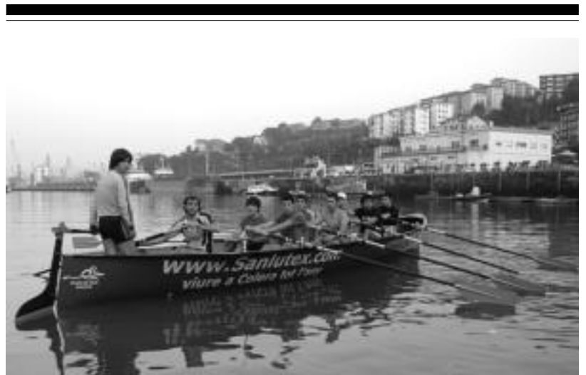
TAKeko bi taldek hartuko dute parte Tarragonako txapelketan; irudian seniorren entrenamendua ikus daiteke. HITZA

KULTURA SAILAK DIRUZ LAGUNDUTAKO HEDABIDEA