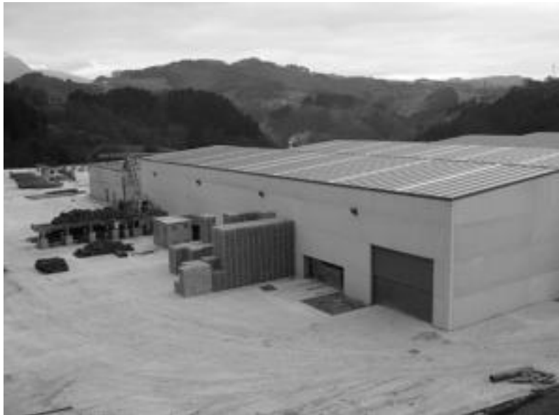
Urbizu enbaketak S.L. enpresak martxan jarritako zerrategia Altzo Azpi auzoan dago. N. URBIZU

Udalak ez errekurritzea erabaki du, «baina norbaite errekurrituko balu, errekurtsioa atera arte epaia ez da firmea». Epaia espedientea atzera eramatea eskatzen du eta azterketa egin ostean, eskatzen diren neurriak bete beharko litzuzke. «Gaia asteleheneko plenera eramango dut eta gure planteamendua promotoreari azterketa egin dezala eskatzea izango da epe bat jarritz. Behin udal txean aurkezten duenean tramitatu