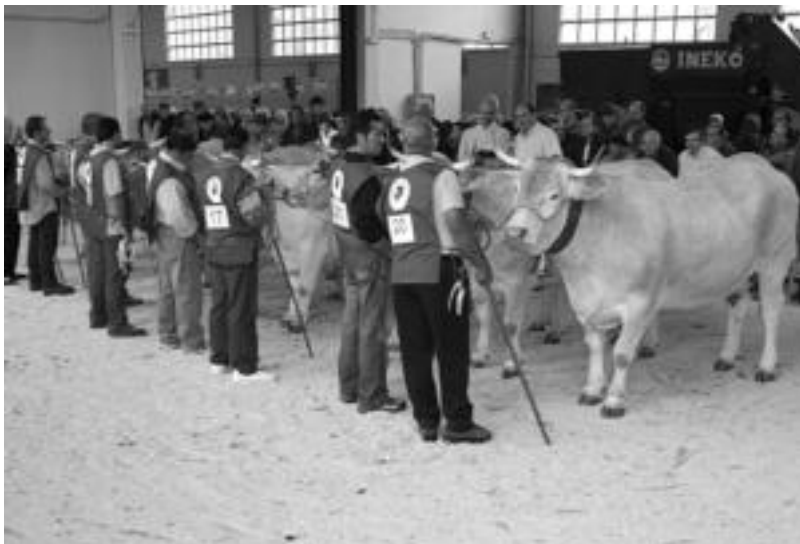
40. Abelgorri lehiaketa jokatu da etzi goizean, Ferialekuan; 08:00etarako eraman behar dira abereak. NEREA URIBUI

Era berean, Pasai Donibanetik San Pedrorra txalupan igaroko dira eta bertatik joango dira Donostiara bi orduko ibilaldia eginda eta bideetik «ezkutuan geratzen diren paisaiak ezagutzuz». Donostian Kilometroak izango dela baliatuz bertara joateko asmoa dute, ondoren, Ibarrara itzultzeko 15 minutuero tren bereziak egingo dira-eta.