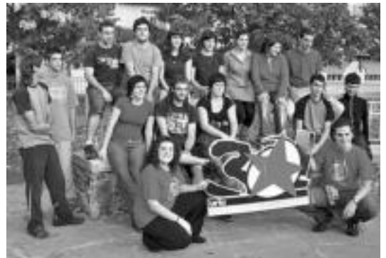
Gaspe Independentistek Gaspe Eguna antolatu dute Leitza hilaren 17an. HITZA

■ 21:30ean. Luntxa Aurreran eta festarekin jarraitzeko Agerralde gizon orkestra Aurrerako atarian.