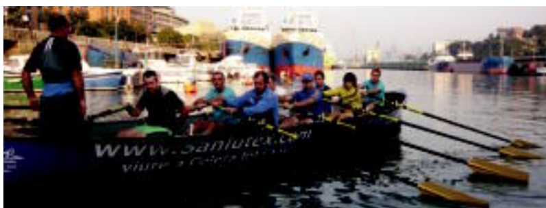
TAKeko seniorrek ere gogor entrenatu dute txapelketarako. HITZA

TOLOSALDEA Orioko taldea eta Tolosako beterano eta seniorrak ariko dira 6