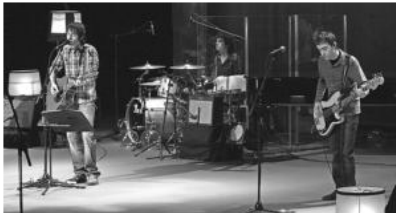
Bide Ertzeanek urtarrilean Leidorren eskaini zuten zuzenekoaren une bat. KUSK

harrak egonagatik ere, gaurkotu edo moldatu egin beharra izan dituzte; «duela hamar urteko abesti bat ezin da gaur egun garai hartan bezala jo, ez baita berdin sentitzen, horregatik eguneratuta daude».