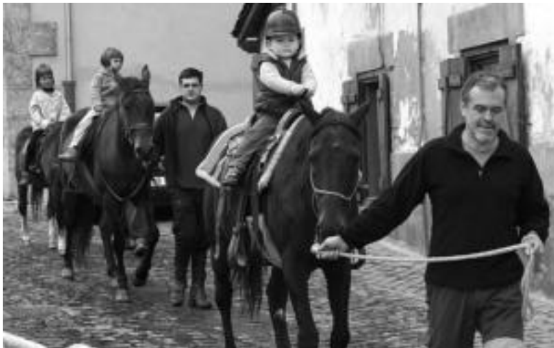
Aurrera Kirol Elkartearen Eguna ospatuko dute etzi. Iaz bezala zaldiz ibiltzeko aukera edukiko dute haurrek. N.U.