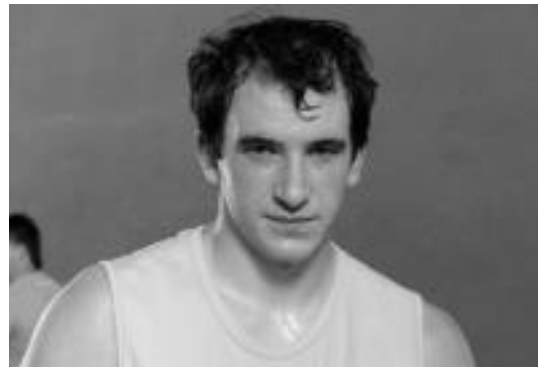
Jon Rekondok II. Mailako Nafarroako Txapelketa irabazi zuen.

Triangulon arratsalderako manifestazioa egiteko asmoa baldin bazuten ere, «polizia armatuaren presentzia izugarriaren ondorioz, irteera lekuz aldatzea erabaki zen, garbi baitzegoen ez zutela egiten utziko eta gainera manifestarien aurka oldartzeko gogo bizia nabaritzen zitzaizen. Beste leku batera mugitu arren, polizia erantzuleen presentziak jarraitu egiten zuten eta parte hartzera etorri ziren guztien artean manifestazioa bertan behera utzte erabaki zen. Horren ordez irakurketa burutu zen; Eusko Gudariak abestu eta eskualdeko gudariaren 400 argazki eta xingola beltza zuten hainbat ikurrina jarri ziren Tolosa guztian zehar».