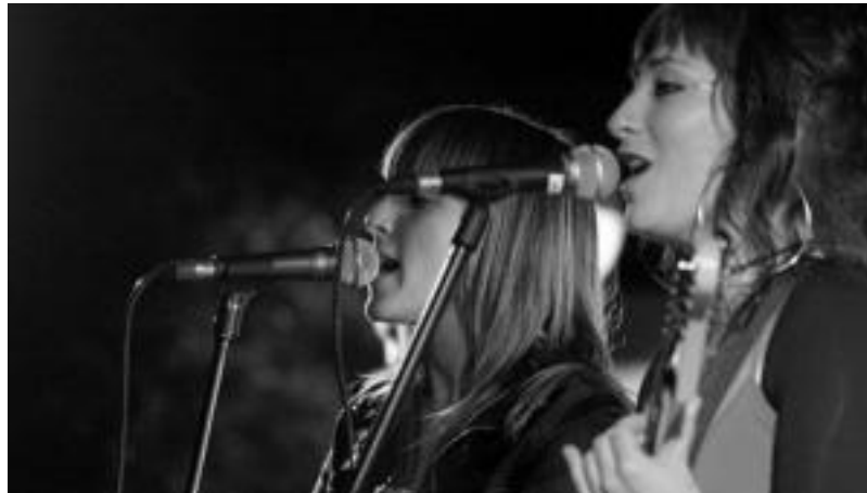
Lain talde billabonatarra entzuteko aukera izango da larunbat gauean, Bonberenean.

Stupenda Jones berriz, Araba eta Nafarroaren arteko mugan dugu, den harrobiko rock taldea dugu, La Polla Records, Los del Rayo edota Kaoitiko bezalako talde handiek ere osatzen dutena. Haiek Sakanako Olazti herrikoak dira,