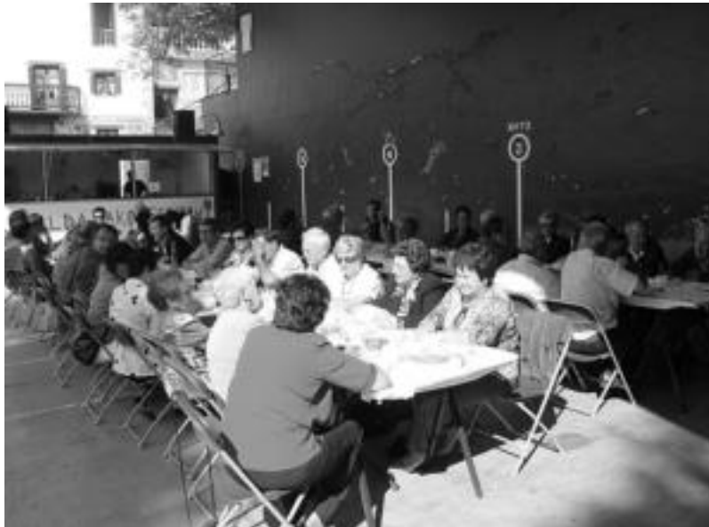
Meza Nagusiaren ostean, frontoian hamaiketako egin zuten.