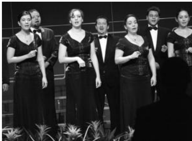
Cantemus Mixed Choir abesbatza, iazko Nazioarteko Abesbatza Lehiaketan Sari Nagusia lortu zuena. IDOIA LAHIDALGA