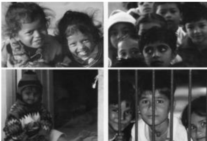
Hainbat postal jarri dituzte aukeran. HITZA

Amaroako Dantza Taldeak auzotarrak eta ingurukoak animatu nahi dituzte parte hartzera «aktibitate alai eta osasuntsu honetan; ikasi dantzan disfrutatuz, gero dantzan disfrutatze».