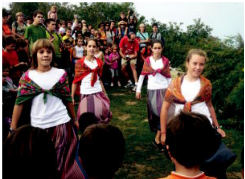
Kukuarrin elkartu ziren denak buzoia jartzeko; ondoren dantzariak agurra dantzatu zuten. HITZA