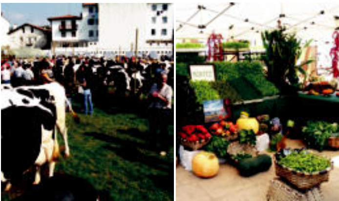
Baseritar askok eraman zituzten euren aberreak Asteasuko azokara. Ibarren ere abere ugari ikusi izan ziren eta 22 bat postu jarri zituzten Emeterio Arrese parkean.

Azoka bereziak Azoken eguna izan zen igandekoa; Asteasun, Ibarren eta Bidegoian bertako produktuk nagusitu ziren.