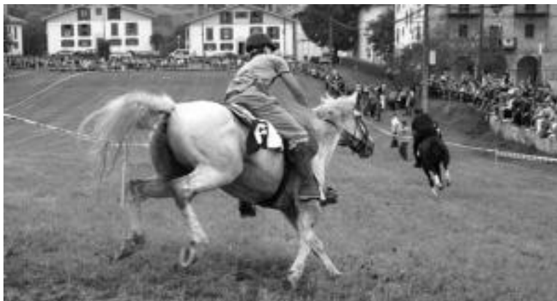
Zizurkilgo lasterketako une bat. I. LAHIDALGA

Artubi Elkarteak kideak beste behin ere «oso gustura» geratu dira lortutako emaitzarekin. Partaidetza aldetik «nahiz eta jendeak errepikatu, jende berri asko» ikusi dutelako. Albaitarien iritziz «aurten zaldiek hobeto burutu dute ibilbidea». Zaldiak, albaitarien