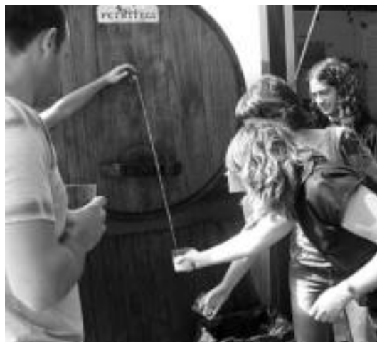
Aldaban, sagardo kupelak girotu zuen herri bazkaria. IDOIA LAHIDALGA