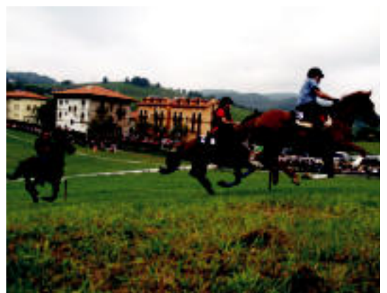
Goian Bedaiko Zaldi Raideko une bat. Behean, Zizurkilgo lasterketakoa. I.L.