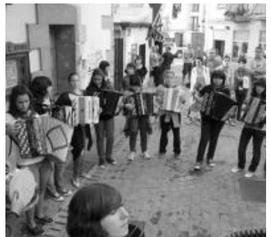
Loatzo musika eskolako ikasleak Irurako kantujiran.