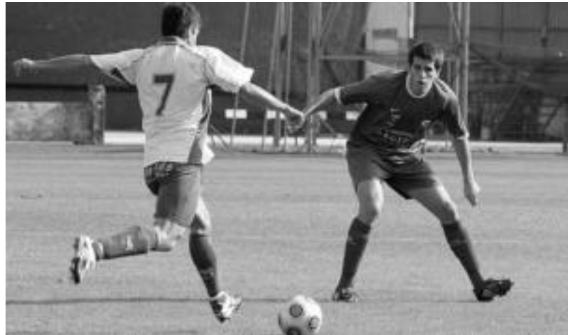
Tolosak Ordiziaren aurka jokatu zuen derbia joan den larunbatean, Berazubiko estadioan.

Lurraldekako Ohorezko Mailan jokatzeko dute urdinekin. Hala, joan den larunbateko norgehiagokaren ostean, sailkapeneko zazpigarren postuan dira, bost punturakin. Hurrengo partida, kanpoan, Zarautzen jokatu du.