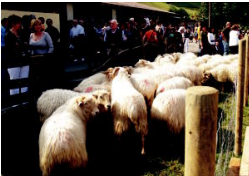
Goian, Ibarra pintxo lehiaketako une bat. Behean animaliak Asteasuko azoka berezian. IDOIA LAHIDALGA

KIROLA Bedaion II. Zaldi Raidean giro polita izan zen; Zizurkilen, Telleria garaile zaldi lasterketan 7