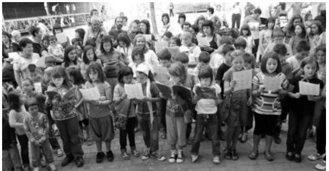
Iruran atzo egin zen kantujiran lagun ugari elkartu ziren kantuak abesteko. I. GARCIA