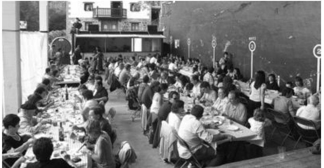
Ehun lagun inguru elkartu ziren igandean Aldabako frontoian herri bazkarian. IDOIA LAHIDALGA