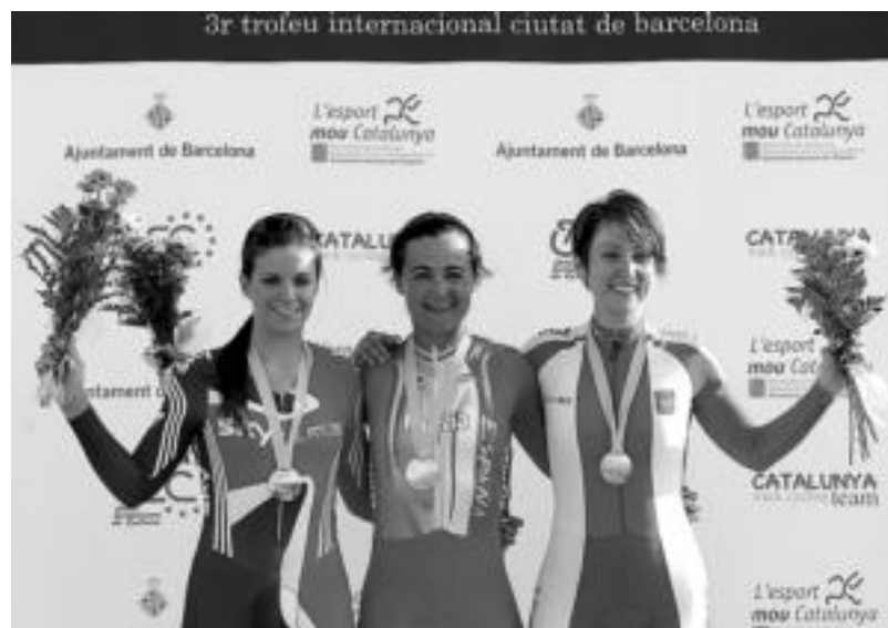
Urrezko domina jazarpeneko lortu zuen, eta brontzezkoa puntuaziokoan.

Ostiralean hasi zen Txapelketa, eta egun horretan jokatu zuten jazarpeneko proba. Ikaztegietakoa