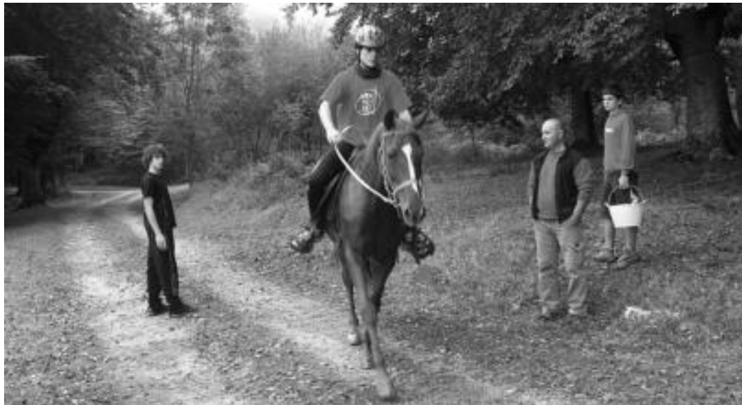
Bedaioiko II. Zaldi Raid lasterketan parte hartu zuen zaldunetako bat. IDOIA LAHIDALGA