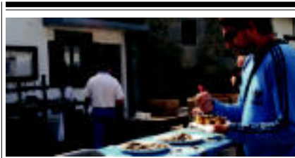
Bidegoian, urtero bezala, sardinak banatu zituen udalari hiru euroren truke. L. URKALAGA