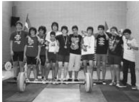
Txapelketaren amaieran Zarautz eta Villabonako pultsulariak.

Emaitzak eskuan, Danenako Adrian Sasiainen lana azpimarratu behar da, irabazteko aukerak