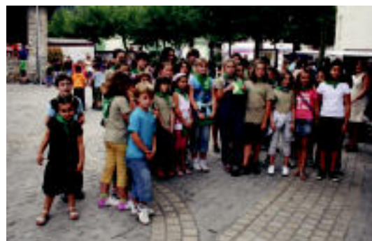
Goizean gaztetxo ugari hartu zuen parte Iruran, marrazki lehiaketan. A. IMAZ

VILLABONA Adrian Sasiain pultsulariak lau urrezko domina eskuratu zituen atzoko lehian 6