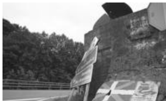
Olarrain auzoan jarri dute berriro ere Etxebarrietaren omenezko plaka.

Ezezagunek, duela denbora bat, Txabi Etxebarrietaren omenezko plaka kendu zuten Olarrain auzotik. Aste honetan berriz, etakidearen omenezko plaka berri bat jarri dute ezezagunek, Jorge Oteizak