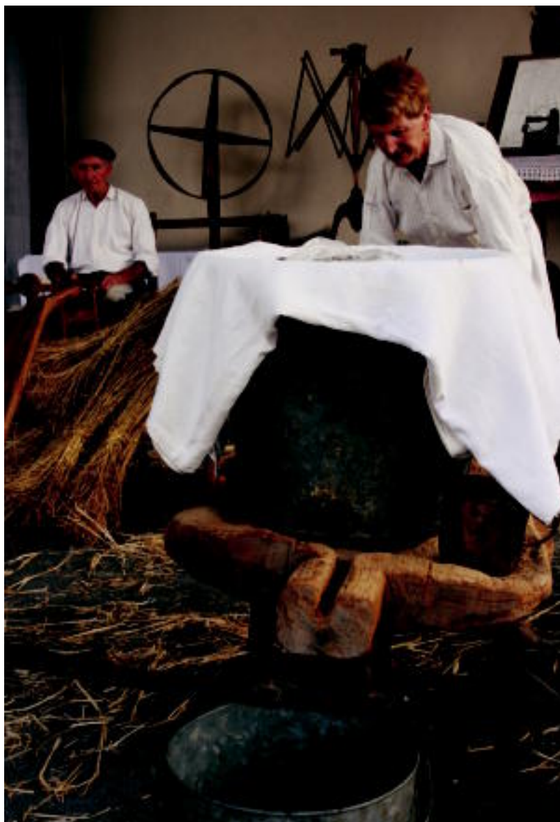
Ikaztegiatoko plazan ikus zitekeen postuetako bat. R. CALVO