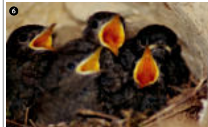
BENEFARDOA » Haizea jurtok une eder hau ere kontatu digu: «Txorikumeak, amak janaria dakarrien momentu berean. Baxe nafarroko toki batean ateratako irudia da». www.baxenafarroa.com