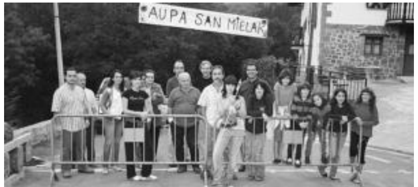
Iruran sokadantza dantzatu zuten mutilek goizean. Aldaban suzuria jaurti zuten jaiak hasiera emanaz. A. IMAZ