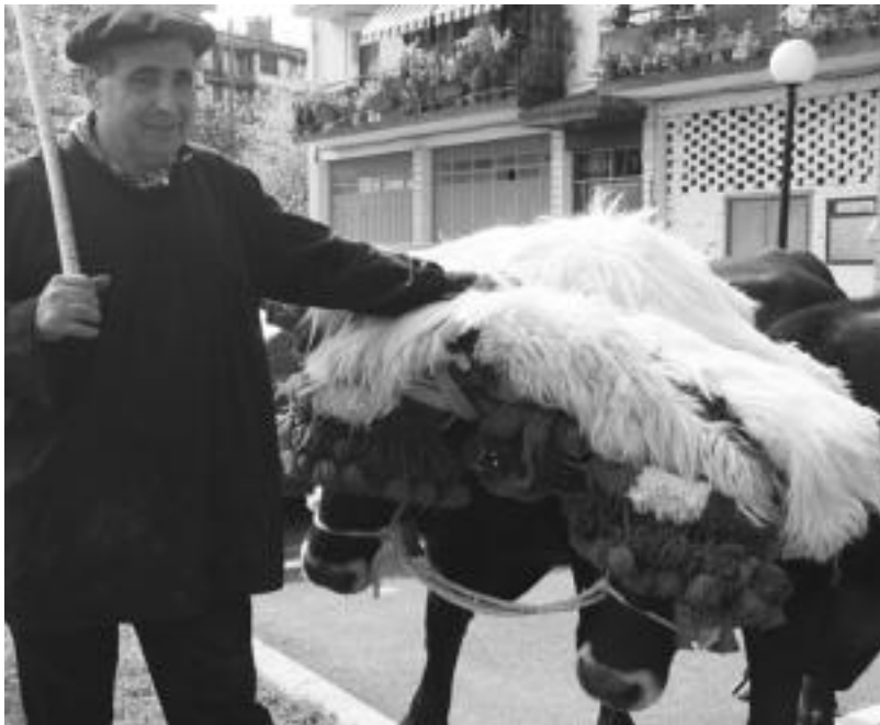
Besteak beste, zaldiak, behorrak, usoak, untxiak eta idi pareak ikusi ahal izan ziren plazan. R. CALVO