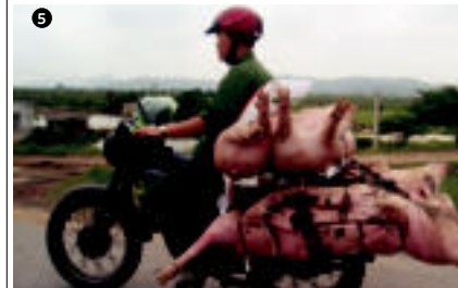
VIETNAM » «Liko Amabarenen hau ere kontatu digu Vietnamen ateratako irudi honen inguruan: «Aze algarak egin genituen irudi hau ikusi genuenean! Ia ezin sinetsi! Baina hau posible al da? Vietnametik bai dakitela behintzat erentagarritasuna aterazten moto hauek! Baina ondo pentsatuta, berriz gaitzekin». www.aitziberlekuna.com