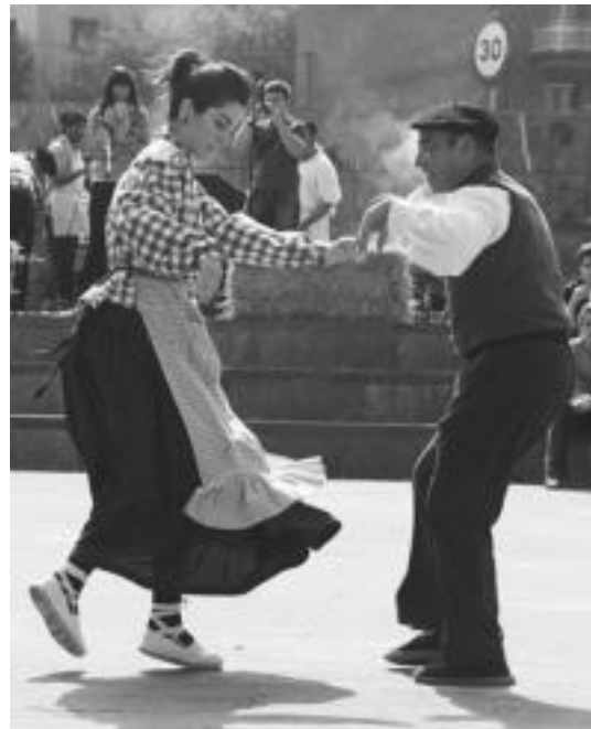
Bikote batek arratia dantzatu zuen goizean. R. CALVO