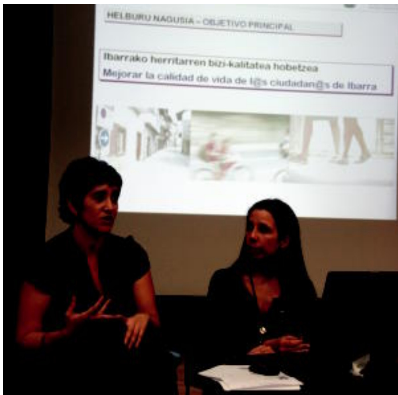
Bitaka enpresako kideak Mugikortasun Iraunkorraren Plana aurkezten. R. CALVO