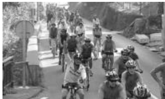
110 lagun inguru elkartu ziren Kaskagorren Pentatloian. HITZA

Garai bateko Erreka sagardotegiaren parean, afaria egingo dute, lasterka herrira iritsi aurretik. Azken froga parranda edo gaupasa izanen da. «Lehen Uitziko jaietara joaten ginen baina orain batzuk herrian bertan gelditzen dira. Kanpotik etortzen direnentzat berriz