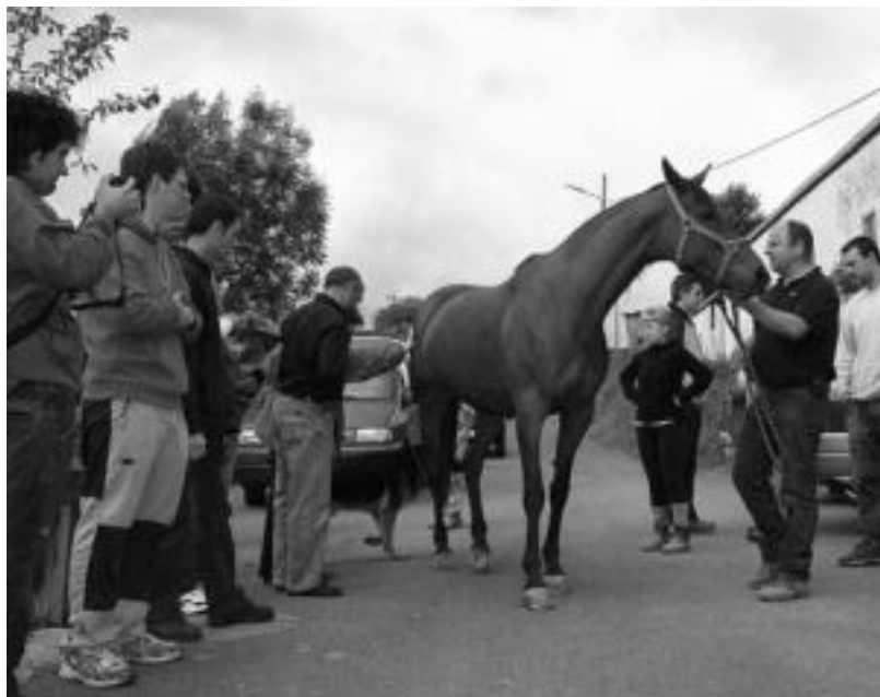
Artubi Elkarteak Zaldi Raid ikastaroa antolatut zueneko irudia. NEREA URRIBIZU