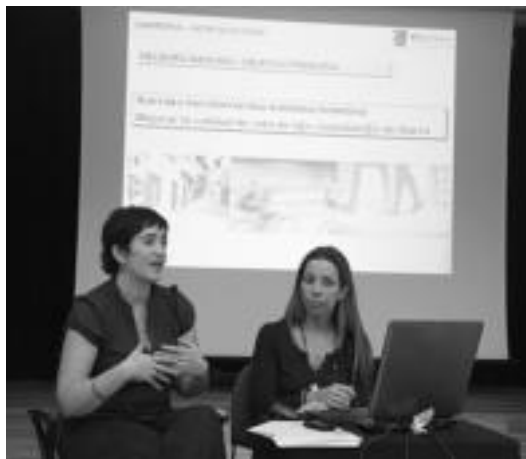
Bitakako bi kide izan ziren asteazken iluntzean kultur etxean. R. CALVO

Oinezko gehienak emakumezkoak dira Ibarren, %66, 20 urte ingurukoak dira eta gehienak aisialdiarekin lotutako ibilbideak egiten dituzte. Bitakak oinezkoen kopurua handitzeko espaloiak 1,5 eta 2 metro tarteko zabalera edukitzea komeni dela dio eta baita paretan ar-