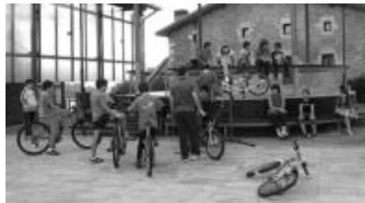
Plazan haur batzuk atzo beraien bizikleta txeketuz. HITZA

ADUNA • Azken egun hauetan egingen ari diren Mugikortasun Iraunkorraren Astearen baitan, atzo Adunan bizikleten txekoa egin zuten, norberak bere bizikleta zein egoeran duen ezagutu eta aldi berean bizikleta ahalik eta hobekien mantentzeko helburuarekin. Herriko plazara 30 bat lagun joan ziren beraien bizikletarekin eta berant egin ahal izan zuten txekoa.