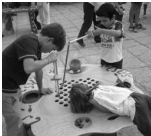
Egurrezko jostailuekin ibiltzeko aukera izango dute haurrek. HITZA

Tombs Creatius egurrezko jolasak egiten dituen talde bat da. Lau urtetik gora daramatate adinguz-