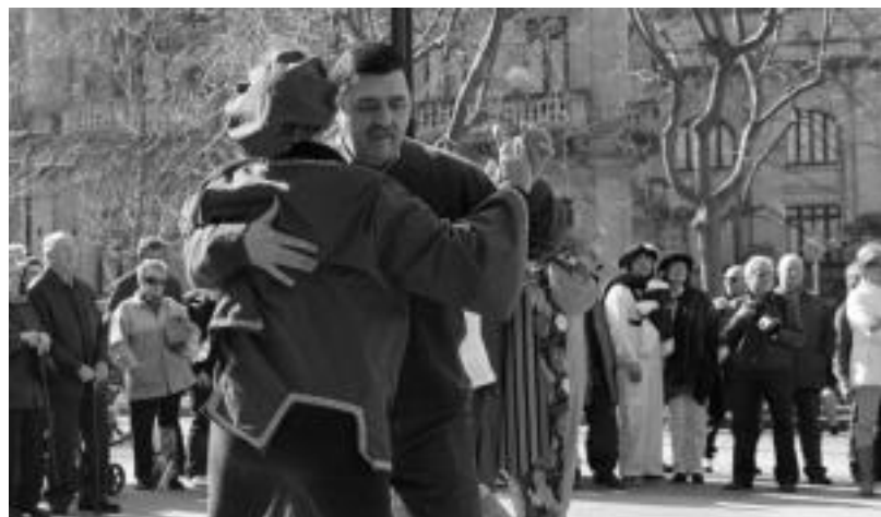
Agata elkarteko kideak maiz irteten dira kalera tangoa dantzatzera. HITZA

Duela 14 urte sortu zen Agata elkartea. 130 kide inguruk osatzen dute, tango irakasleak eta baita afizionatuak ere. 50 urtekoa izan da orain arte adinaren batez beste-koa, baina Cifuentesek azaltzen duen bezala, «azken aldian jende gazte gehiago ari da animatzen. Urtean izaten dituzten jardueren artean, Zarautz, Irun edota Donostiako festetan parte hartzea dago, besteak beste, eta Donostiako tango jaialdian ere parte hartzen dute. Igande arratsaldetan elkartzen dira Donostiako egoitzan, eta tangoaz hitz egiteaz gain, dantzatu ere egiten dute han.