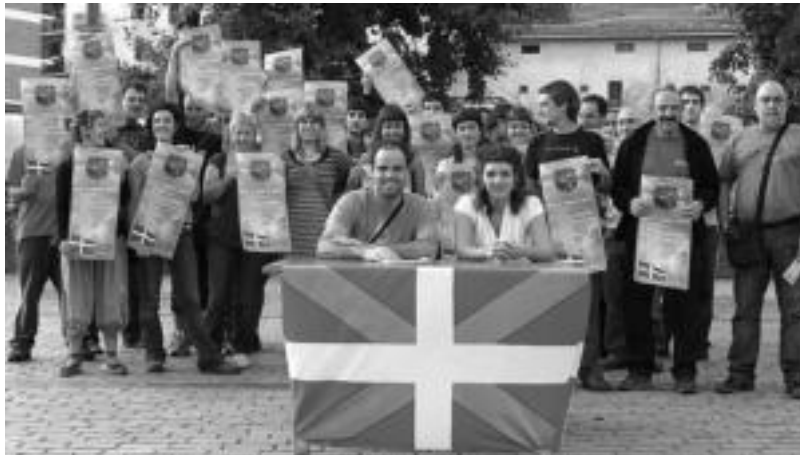
Ibarroko hainbat elkarteek 'Euskal Herria Eguna' aurkeztu zuten atzo herriko plazan.

Ibarren eta Lizarren arteko lehen hartu-emanen ostean, bi herrietako hainbat elkarterengana