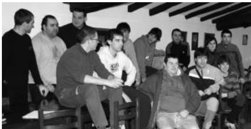
Urte hasieran martxan jarritako helduen Bertso Eskolak jarraipena edukiko du. A. IMAZ