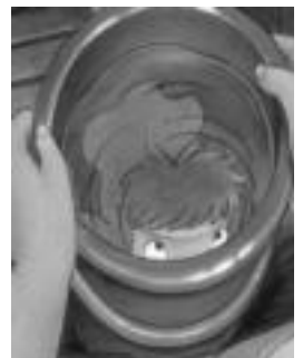
Ponyo filma ikusiko dute gaur. HITZA

Etzi berriz, 22:30eko saioan Resaca en Las Vegas filma ikusteko aukera izango da. Tood Phillips da zuzendaria eta hiru lagunek Las Vegasera egiten duten bidaia kon-