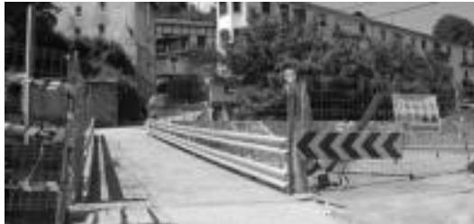
Bizilegunek irigarritasun arazoak dituztela diote; irudian 2004. urtean tren gaineko zubia berritzeko egindako lanak ikus daitezke.

Irigarritasun arazoak, nagusi Auzotarren iritziz Monteskuen irigarritasun arazoak dituzte. Auzora igotzeko bi bide daude gaur egun, Tolosako San Frantzisko pasealekuko atzealdetik (Soldadu kalea) edota San Esteban auzotik gora abiatuz. Bi errepide hauek lo-