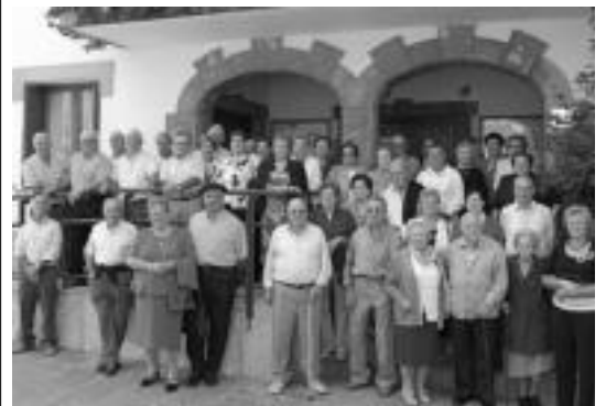
laz jubilatutako askok hartu zuten parte ekitaldi desberdinetan. HITZA