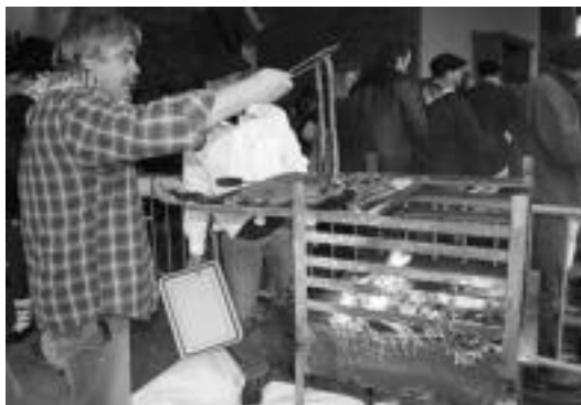
Talo artean txistorra jan ahal izateko frijitzen. A. IMAZ

Jaiari hasiera goizeko hamaiketan emango diote txalaparta doinuekin eta azokaren irekiera izango da. Bertan, postu ezberdinak ikusteko aukera izango da. Alde bate-