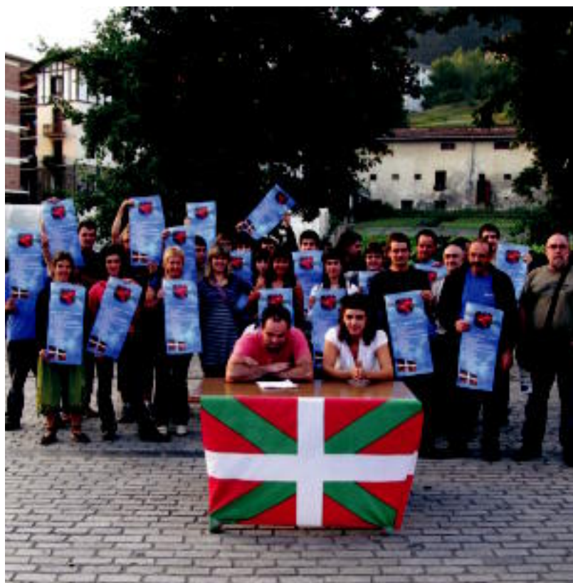
Urte guztian elkarrekin ekintza ezberdinak burutuko dituzte; lehen, urriaren 10ean; irudian, atzoko aurkezpena. A. IMAZ

HELBURUAK Euskal herritarrek direla aldarrikatzea eta bi probintzietako herrien senidetzea burutzea dira asmoak >7