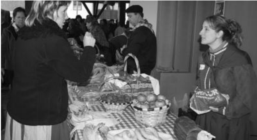
Duela bi urte egin zen Euskal Jaian postuetan jarri ziren hainbat barazki ikus daitezke irudian; aurten ere izango dira. A. IMAZ