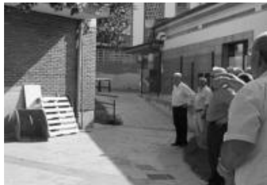
Urtero bezala, aurten ere izango da toka txapelketa larunbatean. R. CALVO