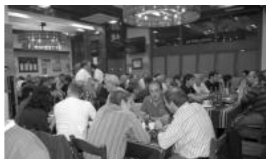
Larunbat gaueko bazkideen afaria.

Igandean, gonbidatuen bazkarian 100 lagunetik gora izan ziren, Orfeon de la Castaña taldearen abestiek ingozatuz.