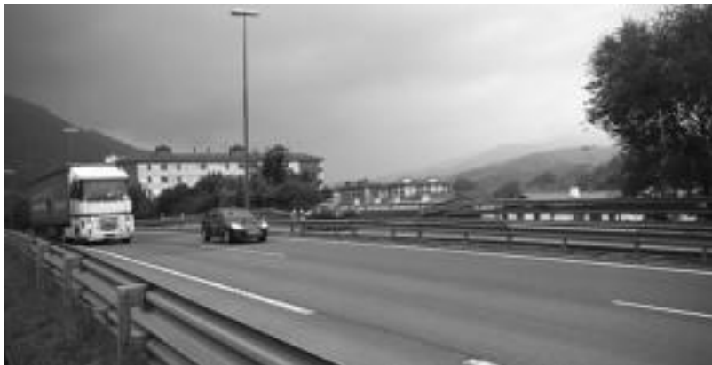
Villabona zeharkatzen duen N-1 errepidetik ibilgailu ugari igarotzen dira. I. GARCIA