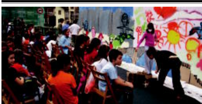
Vilabona eta Zizurkilgo haurrek graffitiak egin zituzten Zubimusun. Bertan autorik gabeko ingurua boti inagiatu eta marraztu zuten.