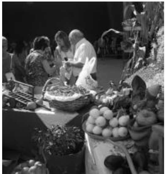
Iaz ere Ibarrako produktu asko erosi ahal izan ziren azoka berezian. A. OTEZABAL

Goiza bukatzeko antolakuntzan, laguntzen, postuetan eta lehiaketan aritzen direnek bazkaria izango dute plazan. Horretarako txartela aldeaz aurretik hartu behar dutelarik.