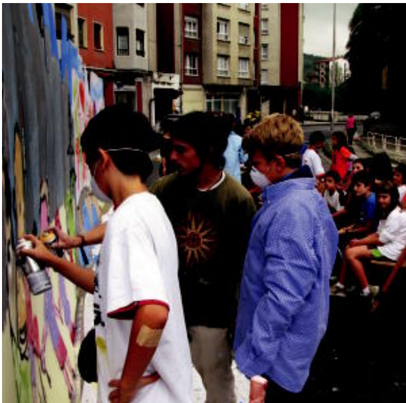
Atzo, Villabonako eta Zizurkilgo haurrek graffitiak egin zituzten Zubimusun. ASIER IMAZ