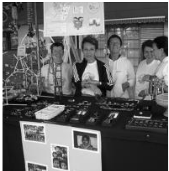
Ibarratik Misio Taldeak bi postu jarriko ditu San Bartolome plazan.