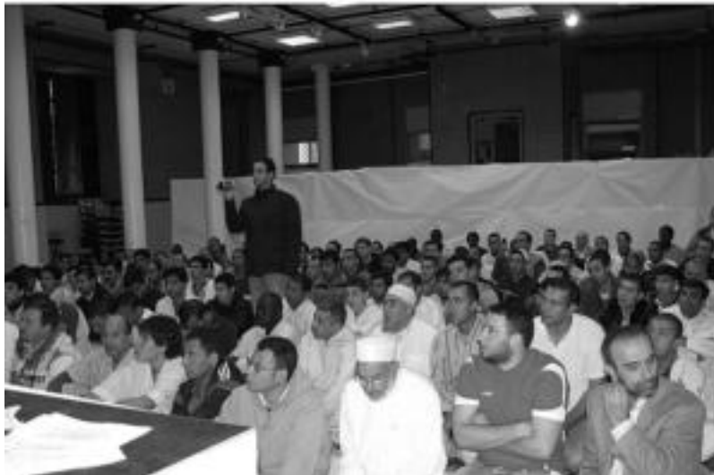
Igandeko ekitaldian, errezatu, abestu eta abar egin zuten; estreinakoz, Kultur Etxean egin dute. HITZA

Ramadan egiten duena bi unetan pozten da. Alde batetik, egunero, baraualdia amaitzeko unea iristen denean. Bestetik, egun handian, hau da, azken epeira