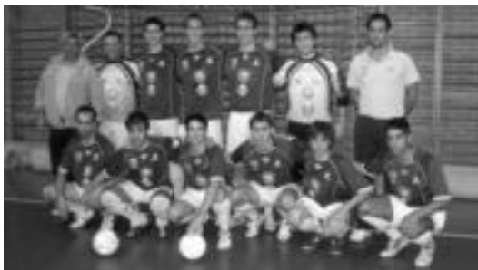
Denboraldi honetan jokalariek gazteak dira nagusi