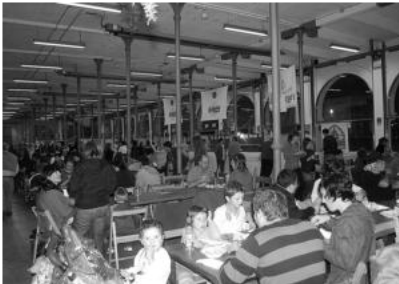
Larunbatean eta ostegunean izan zen jende gehiena Garagardo Festan.

Euri asko egin du asteburuan, eta Zerkausiaren kanpoaldean jarri behar zituzten mahaiak ezin izan zituzten jarri, ez eta Zerkausiaren beheko solairuan ere, eta ondorioz aurreikusitakoa baino jende gutxiagorentzat egon da lekua bertan afaltzeko.