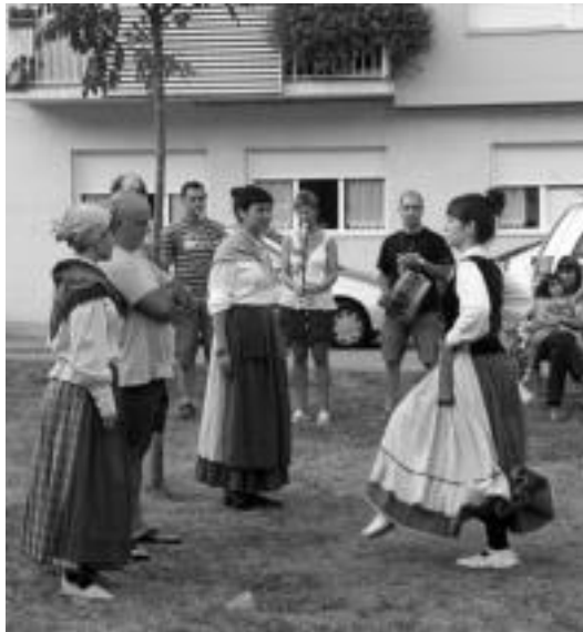
Ekitaldi ugari antolatu zituzten, tartean helduen dantza soka emanaldia. E. EZEIZA

Udal Alternatiboak lehenik eta behin eskerrak eman nahi izan dizkie jaiak egin ahal izateko «ezinbestekoz, borondatez etorritako musika taldeei, herri kiroletako partaideei, zestapuntakoei, segalariei, enpresa laguntzailei...».