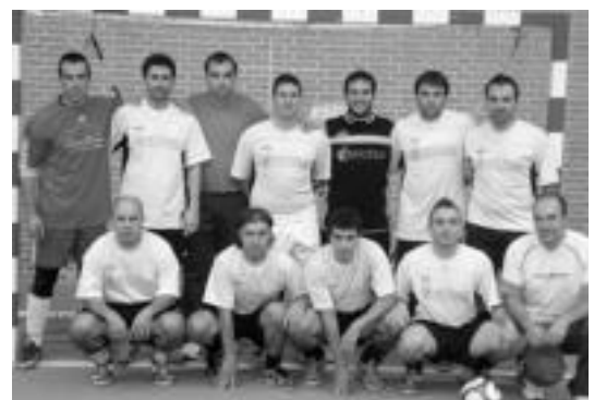
Klinika Dental Aldaz taldea, azpitxapelduna. HITZA