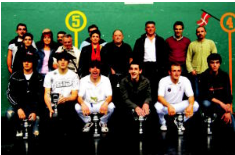
Herenegun jokatu zituzten Amezketa finaleko partidak; jende ugari izan zen Larrunarri pilotalekuan. SARA GOMEZ