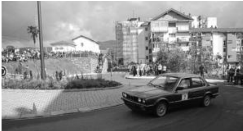
Atzeko trakzioa duten autoek ikusgarritasuna jarri zuten biribigunean.