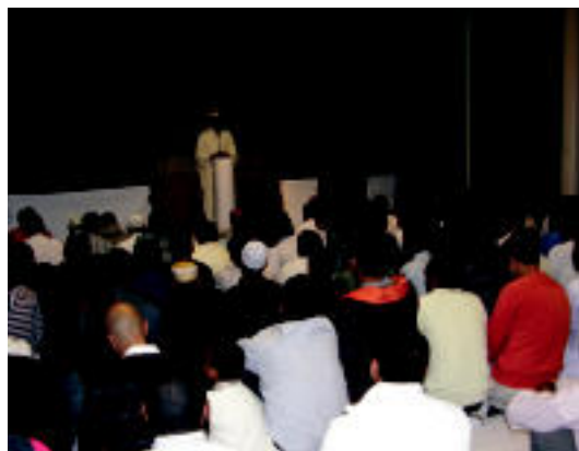
Tolosako Kultur Etxean egin zuten festa herenegun goizean. HITZA

ZIZURKIL 17 auto lehiatu ziren eta antolakuntza «oso gustura» azaldu da txapelketarekin z