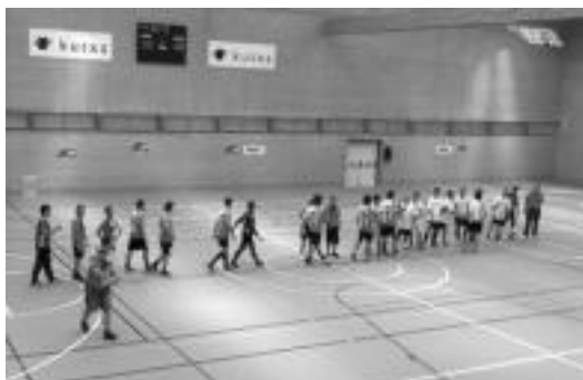
Finalaren partida hasi baino lehen, bi taldekoak agurtzen.