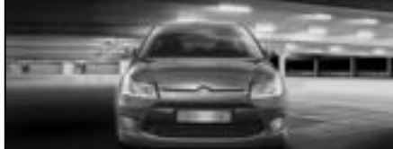
CITROËN C4 HDi 11.600€tik

2000E PLANAREN MEMENTOA DA CITROËN MEMENTOA DA