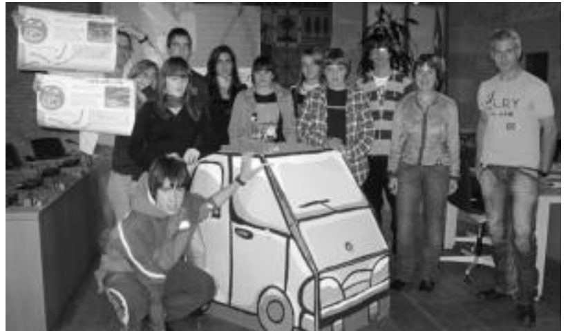
Atzo aurkeztu zuten Tolosako Mugikortasun Astea, Udaleko, Zuloaga Txiki eta ikastetxeetako kideek. E. EZEIZA

Peñagarikanoren esanetan, lehen ere antzeko zerbait egin zuten, eta «egun bi noranzkotan igaro daiteke bialeetik, duela bi urteko Mugikortasun Astearen proba bat