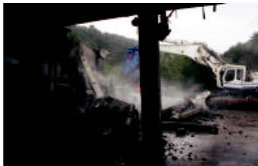
Paper fabrikaren eraikin zaharra eraisten, atzo. I.T.

Behin betiko izaera eman dio Udalak asteroko azokari 4