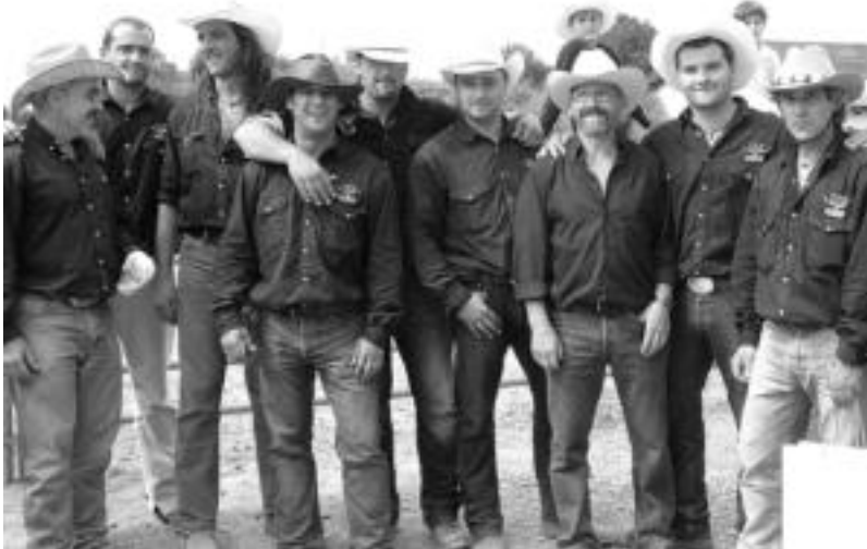
Euskal Western elkarteak antolatutako txapelketan eskualdeko batzuk izan ziren, Zaldibarren. HITZA

Atal honetan zuen kezak, iradokizunak, eskertzak... argitaratzen ditugu ostiralero. Horiek guri helarazteko hainbat bide dituzue: Interneten, 'www.tolosaldekohitza.info' webguneko 'Zurea da hitza' atalean; e-mailaz, 'tolosaldean@tolosaldekohitza.info' helbidean eta 943 655695 telefono zenbakian.