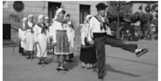
Ibarroko III. Dantzari Txiki Eguneko Alurreko txikiaren emanaldia. A. IMAZ

Gazteei dagokionez hiru talde izango dira: 10 eta 12 urte bitarte-