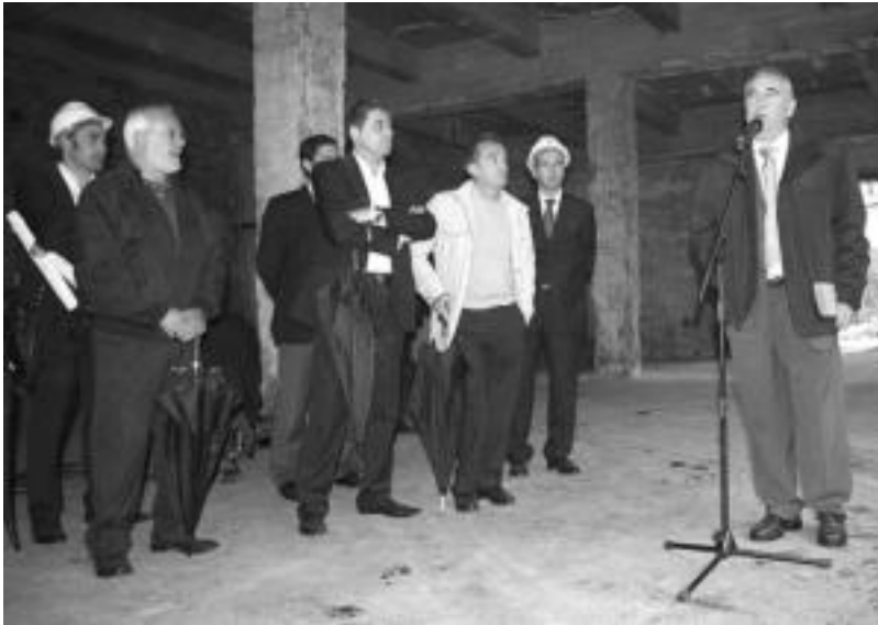
Paper fabrikaren eraikina nola eraisten duten ikusi zuten Eusko Jaurlaritzako eta udaleko ordezkariak, atzo, i. t.