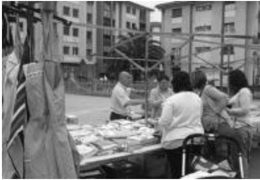
Jakiez gain arropa ere erosi ahal da Ibarroko ostegunetako azokan. R. CALVO