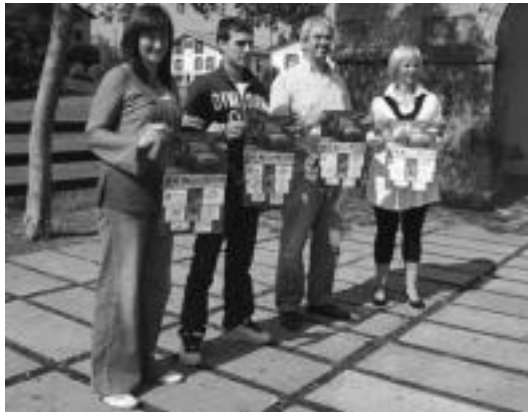
Antolatzaileak probaren kartelarekin. I. GARCIA

Guztira 22 gidariak parte hartuko dute eta Cuestak azaldu duenez, «ez bada ere oso zenbaki altua, parte-hartzaileak kalitate handikoak dira. Txapelketan parte har-