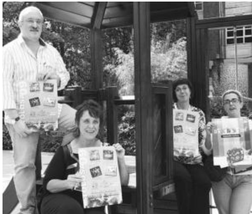
Komertzio foroaren ordezkariak atzo eginiko aurkezpenean. I.T.

Diru laguntza Eusko Jaurlaritzaren Merkagune programak finantzatuko du jar-