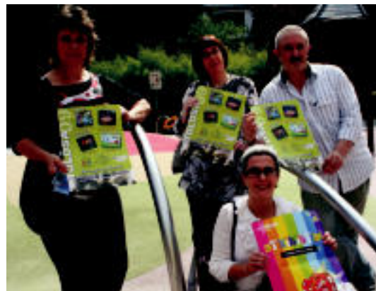
Komertzio foroaren ordezkariak, atzo, ekimena aurkezten.