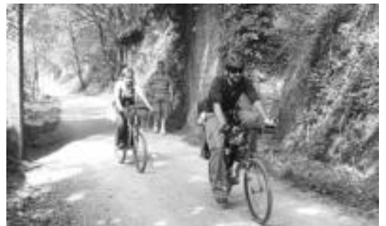
Urtero jende ugari elkartu ohi da Maratoi Erdian eta Bizikleta Martxan. HITZA