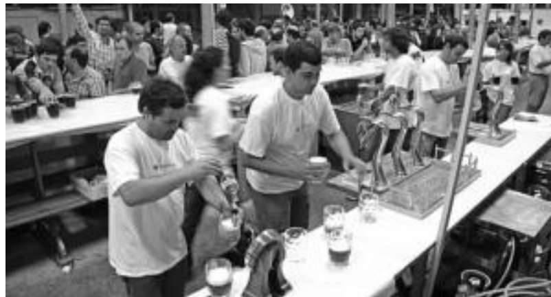
Pasa den urtean ere jende ugari izan zen Garagardo Festan. DIARIO VASCO

Ederki edan eta jan nahi duenak, beraz, gaurtik aurrera aukera paregabea izango da Zerkausian, giro paregabeaz lagundurik, gainera.