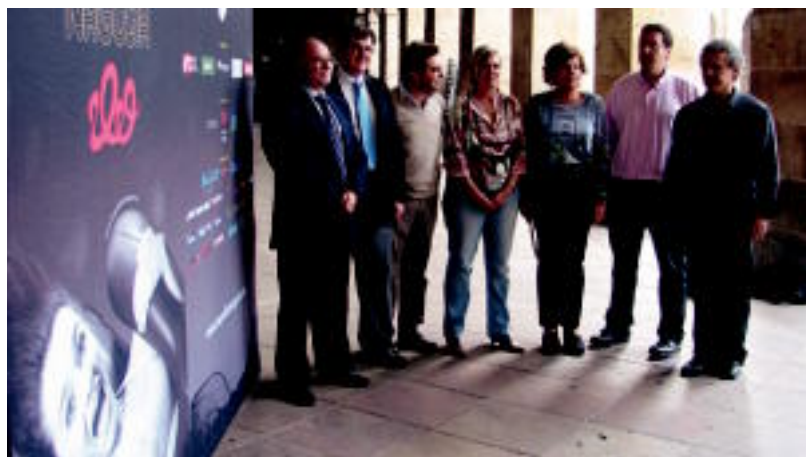
Bertsozale Elkarteko arduradunak eta babesleak, atzo, XV. Bertsolari Txapelketa Nagusiaren aurkezpenean. G. EIZAGIRRE

KANPORAKETAK Bi hartuko ditu eskualdeak: Leitzakoa urriaren 10ean izango da, eta Tolosakoa, azaroaren 14an z