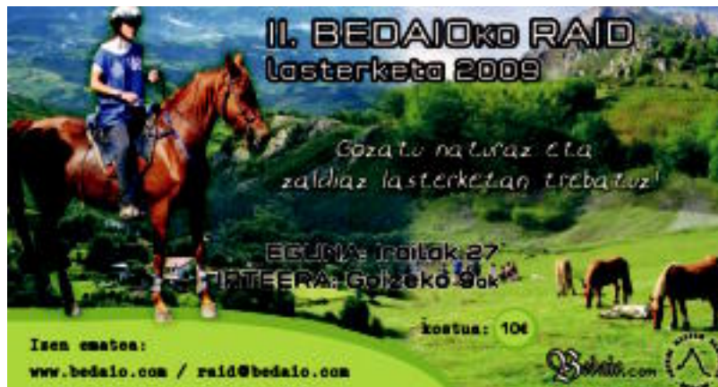
Bedaio II. Zaldi Raid Lasterketako kartela. HITZA

Bedaio » Iazko arrakasta ikusita bigarren antolatu du Artubi elkarteak; 10 euroren truke eman ahalko da izena.