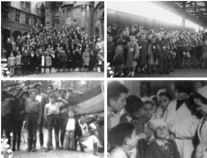
Erakusketan ikus daitezkeen irudietako batzuk. IDI EZKERRA FUNDAZIOA