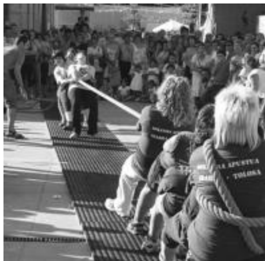
Sokatiralarien lehia aurtengo Bartoloetan. BARTOLAREN JAI BATZORDEA