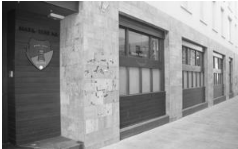
Behar-Zanaren egoitza berria kanpotik ikusita. I. GARCIA

Zaharberritze eta eskulan tailerrentzat bi aukera izango dira: astelehenean 17:00etatik 19:30era eta asteartetan 10:00etatik 12:30era. Hilaren 21ean hasiko dira tailerrek eta prezioa 75 eurokoa da. Azken bi tailer hauek Sacemen egingo dituzte.