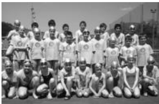
Modalitate ezberdinetan aritzen dira igerian eskualdeko gaztetxoak. HITZA

Denboraldi berriari ekiteko prest da jada Tolosaldea Igeriketa Kirol Taldea. Aurten ere, igeriketa ikastaroak eta hobekuntzarakoak emango dituzte Usabal kiroldegian. Hauek sei urtetik gorako neska eta mutilei zuzenduta daude.