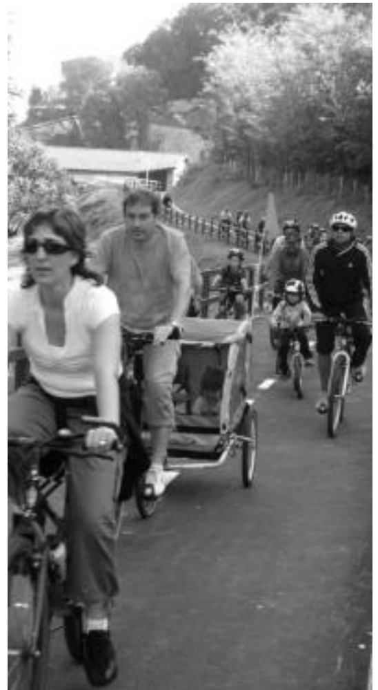
Iaz Asteasu eta Zizurkil arteko bidegorria inauguratu zuten herritarrek Mugikortasun Astearen baitan.

Igandean Bizikleta Martxa egingo dute Asteasu, Anoeta eta Ikaztegieta artean. Martxa honekin Tolosaldeko bidegorriak ezagutzeko aukera eskaini nahi dute eta bi ibilbide izango dira. Biak ala biak 10:00etan hasiko dira, lehena Asteasuko plazatik aterako da eta handik Zizurkilera, Villabonara, Irurara eta Anoetara joango dira. Bigarrenegoa, aldiz, Ikaztegieta plazatik irtengo da eta handik Alegia eta Tolosa gurutzatuta Anoetara joango dira. 11:30ean hamaiketako egingo dute Anoetako plazan eta 12:00etan itzuliko dira. Parthartzaile guztien artean bizikleta bat zozketatuko dutela ere esan dute antolatzaileek.