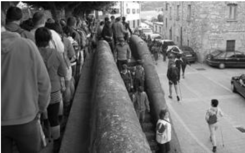
Egunean bertan ehundik gora mendizalek eman zuten izena, antolatzaileen harridurarako. ESTITXU AZPIROZ