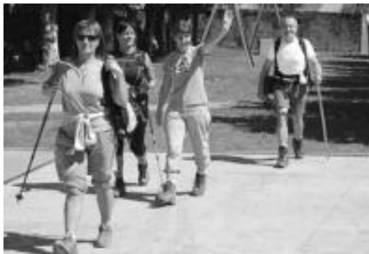
Mendizale gehienek 5 ordu inguruan osatu zuten 23 km-ko ibilbidea.

Antolatzaileen esanetan aurretik 150 mendizalek eman zuten izena. Egunean bertan, ordubete lehenago, izugarriko ilarak sortu ziren. «Aurten egia esanda, deialdia askoz gehiago zabaldu dugu. Nafarroako Mendi Federazioaren zirkuituan sartu dugu Mendi Mar-