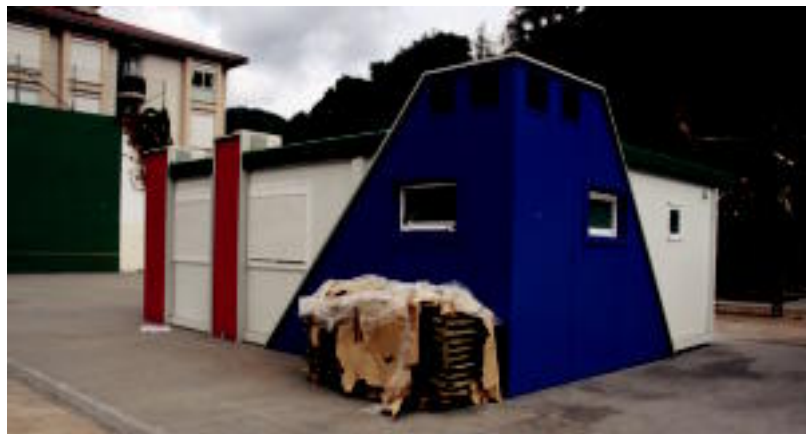
Kalebeherako auzoko Erbeta parkean kokatu dute modulu aurrefabrikatua.

BERRIKUNTZA 'www.tolosaldeagaratzen.compartir.org' bidez ibilgailu pribatuak partekatu ahal izango dira 6