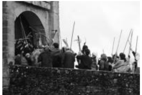
Ozaetan (Araba) grabaketa eta jai antolatuta dituzte hilaren 19an. EAL

Aldebatetik Astiz eta Maimur liburudendetan apuntatu ahal izango da. Bestalde mendibilaurre-ra@hotmail.com helbide elektronikoa eman ahal izanen da izena.