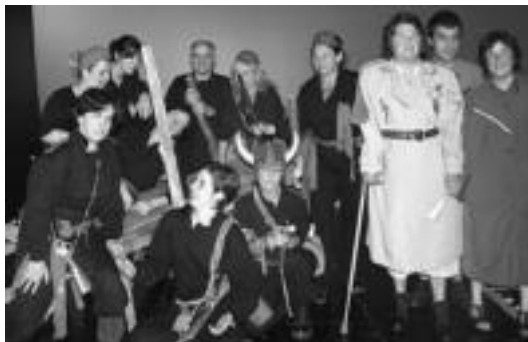
Antzerki tailerrekoek iaz eskaini zuten antzeztanaren une batean. E. EZBIZA

Guztira 10 ikastaro daude aukeran ikasturte honetarako. Antzerkia, argazkigintza, dantza garaikidea, egurra lantzea, ehoziri lana eta patchworka, pintura/marrazketa eta zeramika dira helduei eskainitakoak. Gaztetxoentz, berriaz, baleta eta eskulan tailerra dituzte eskura.