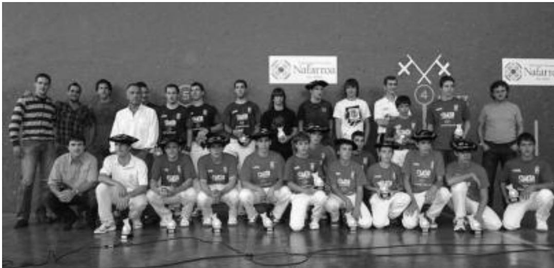
Leitzako V. Txapelketaren finalak herenegun jokatu ziren Amazabal pilotalekuan. Amaieran bost bikotek jantzi zituzten txapelak.