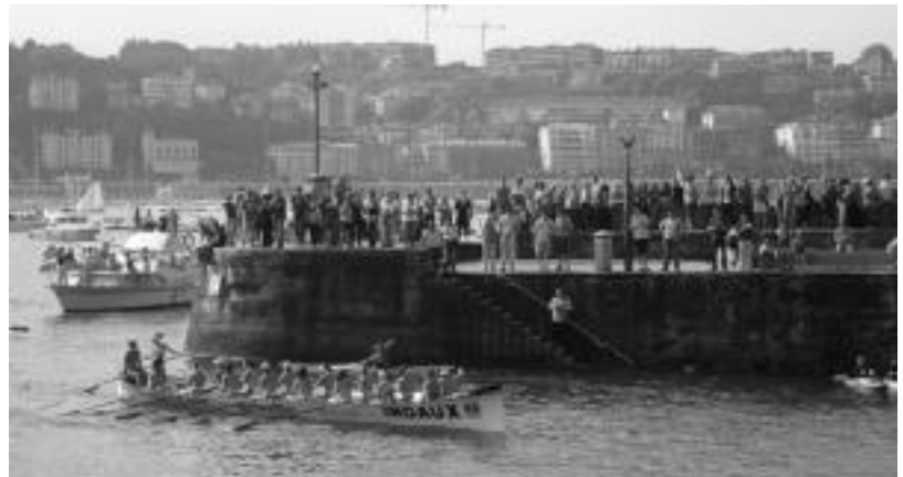
Tolosa-Getaria trainerua Donostiako portuan.

Emakumezkoen estropada indarra hartzen ari da. «Larunbateko sailkapen estropadan jende pila