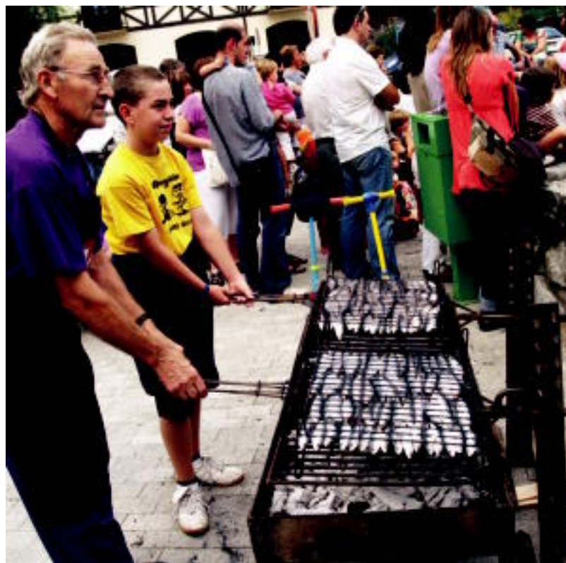
Sardina jatea egin zuten Kalebeherako jaietan; Alegiko auzoko ekitaldirik jendetsuena izan zen hau. IDOIA LAHALDAGA

IBARRA Edu Murumendiarazen ordez ariko da donostiarra; aurki hasiko dute ikasturtea 6