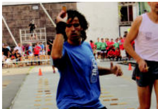
Donezteben Eneko Garmendia lokotx biltzen.

Gaineratzen, giro polita izan da partidetan. Igandea ere seguru, animo, oihu eta jende faltarik ez da izango Amezketan.