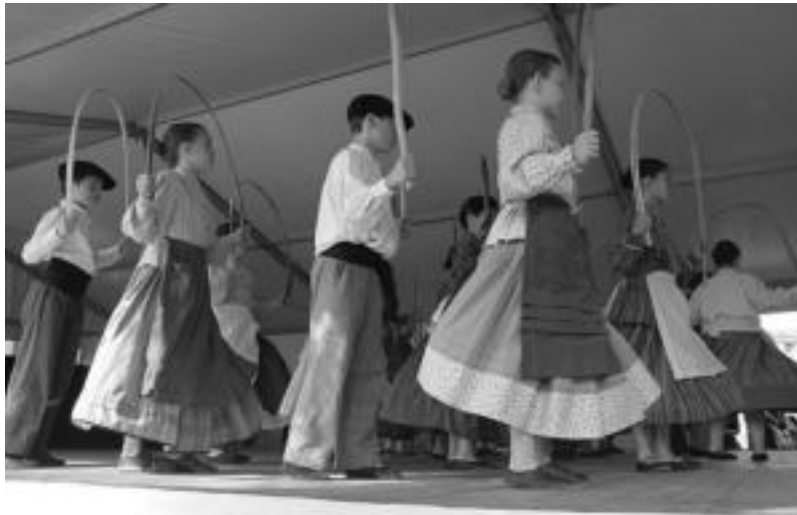
Geroz eta gehiago dira Alurr dantza taldeak eskaintzen dituzten eskoletan parte hartzen duten gazteak. R. CALVO

Horrexegatik jada eginda dituzten hiru ikuskizunetan zenbait aldaketa egiteko asmoa dute, hartara «ikuskizuna eskaini dugun herrietan ere berrikuntzak eskaini ahal izateko». Horretarako Sua