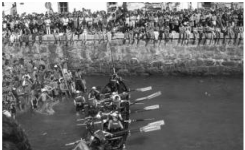
San Pedroko trainerua, estropada bukatuta, Donostiako portuko arrapalaren ondoan.

Estropadaren ondoren sanpedrotarrek herrian harrera beroa izan zuten. «Banderak irabazi ditugunean ACT Ligan ere harrera ona egiten digute eta pixka bat ere emozionatu egiten gara», dio arraunlariak. «Herria ikusten duzu nola animatzen dizun eta hor konturatzen zara zer garrantzia duen». San Pedron arraun zaletasuna berpiztearen erru handia du egungo traineruak. «Azkenaldian jendea portatzen ari da. Baina hori betikoa da, ondo dabilenean orduan jende gehiago agertzen da». Donostiako giroa ere «emozio handikoa» dela dio: «Portura sartzen zarenean eta arrapalara joan, ingurua jendez ikusten duzunean asko emozionatzen zara. Beldurra