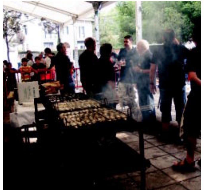
Herenegun izan zen Kaleberako eta Zizurkilgo festetako azken eguna; lehendabizikoan dantzari txikien emanaldia izan zen goizean; bestean berriz, sardina erreak jateko aukera izan zen. I. LLAHIDALGA