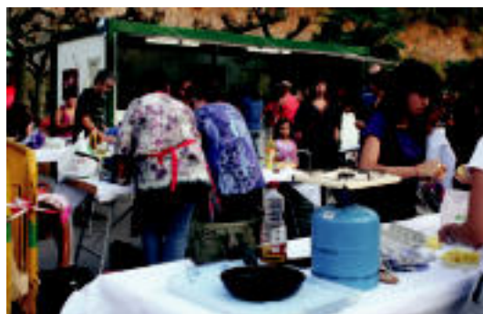
Patata tortila lehiaketa egin zuten atzo. E. MAIZ

EKONOMIA Krisiaren nondik norakoak eta eskualdeko udaletxeetako egoera aztergai 6-7