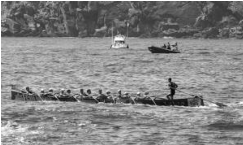
San Pedroko trainerua aurreko igandean Kontxako banderaren lehen jardunaldian.