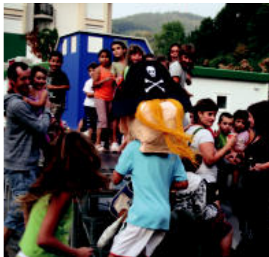
Atzo buruhandiekin festei hasiera ematen. E. MAIZ

Festei amaiera emateko, 20:30ean zahagiardoa eta ondoren, 22:00ak aldera, Mus Txapel-keta jokatu dute.