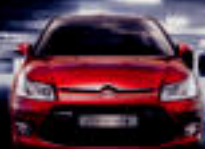
CITROËN C4 HDi 11.600€tik