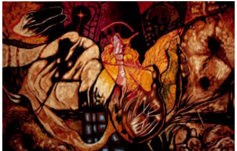
19 lanek osatzen dute bilduma, eta hau da bere ustetan, indartsuenetako bat. E. EZEIZA