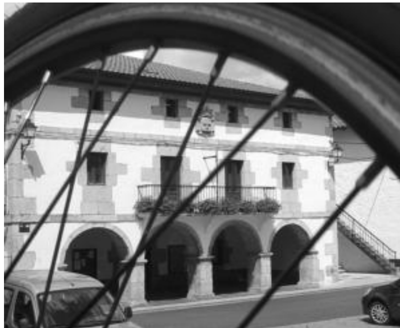
Abaltzisketako udaletxetik igaroko gara ibilbide honetan.