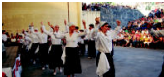
Ingurutxoak dantzatu zuten auzokideek Bedaion, herenegun. SARA GOMEZ

TOLOSALDEA Azken eguna izango da Alkizan, Bedaion, Elduainen eta Lizartzan 6