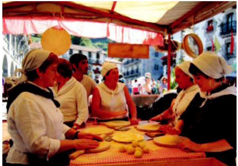
Protagonistak taloak eta euren egileak, talogileak, izan ziren plazan. SARA GOMEZ

11.00etan heldu zen eguneko ekitaldi nagusia, taloaren txapelketa, hain zuzen ere. Ez zen edonolako gainera, Nafarroako I. Talo Txapelketa izan baitzen. Txapelketaz gain, talo plateren erakusketa ere gin zuten, baita haurrentzako taloa egiteko tailerra ere. Honek bildu zuen jenderik gehien plazan, baina festa ez zen hemen amaitu. Taloaren usainaren bueltan, herri kirol saio paregabea ere izan zen ikusgai. Euskal Herriko Aizkolari Gazteen txapelketa izan zen plazan. Ondoren, Nafarroako Txinga-eroate Txapelketako txanda izan zen, eta azkenik, herri kirolen jaialdiarekin amaitzeko, Euskal Herriko Lokotx Biltze txapelketa egin zuten.