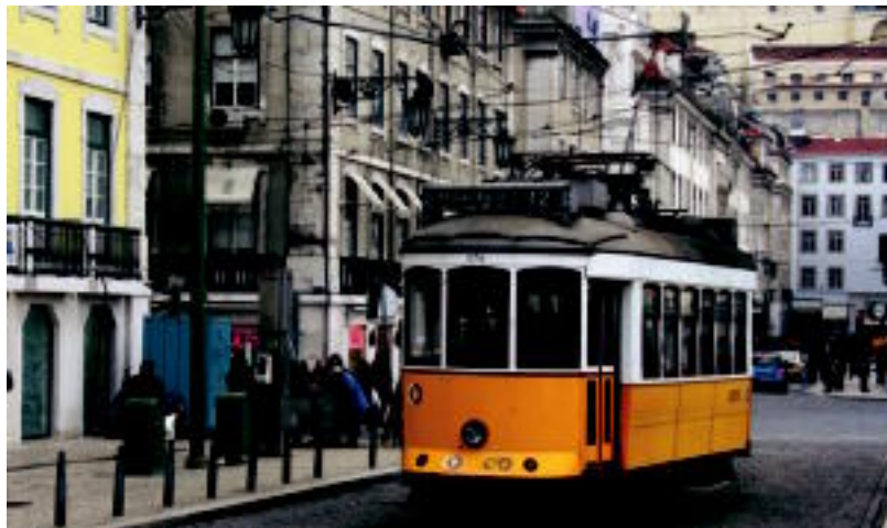
Lisboa edota Europako beste edozein hiriburu bisitatu ahal izango du saria eskuratzen duen harpidedunak. HITZA

■ Eskaintza. Irailaren eta urriaren gutxienez urtebeterako harpidedun ordantzaile egiten diren harpidedun berrien artean, bidaiia zozkatuko da, eta saridunak hautatu ahal izango du aukeran izango dituen bost eskaintzen artean.