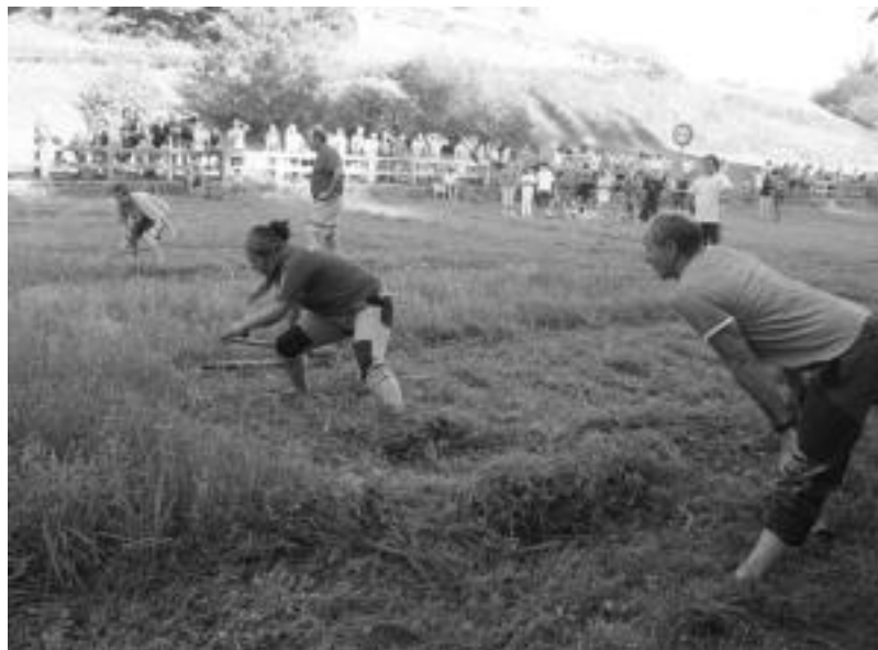
Lizartzan, Nazioarteko erara sega apustua ospatu zuten bi taldetan banatuta. ASIER IMAZ