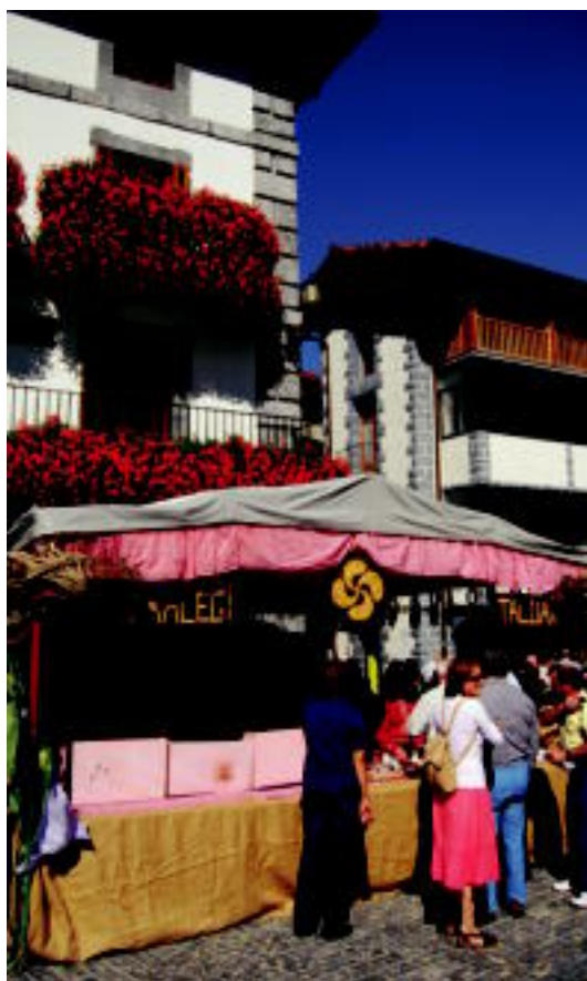
Villabona eta Saralegi herriko talogileak lanean aritu ziren. SARA GOMEZ