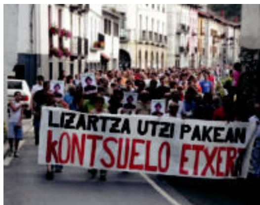
Herriko kaleak zeharkatu zituzten, kamera eta ertzainen presentzian. A. IMAZ