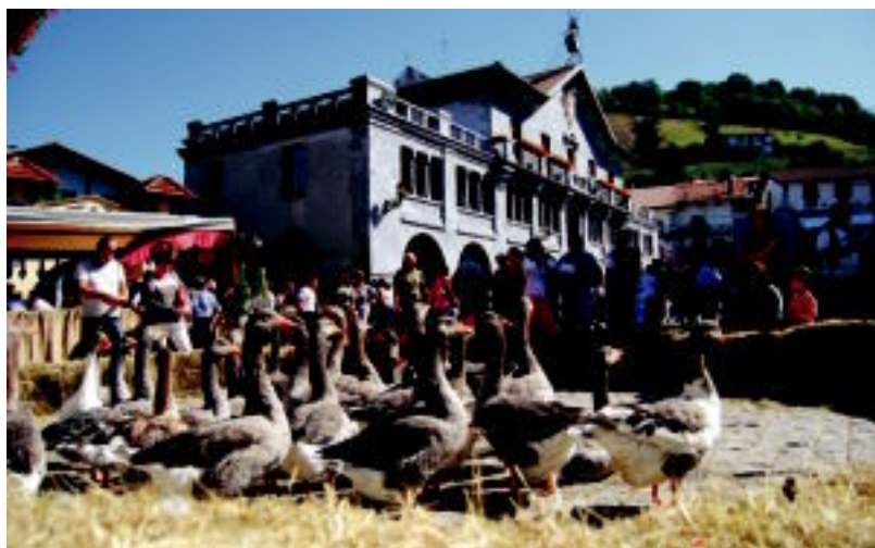
Animalien erakusketa ere izan zen herriko plazan; tartean, antzarak, astoak, txerriak, txerrikumeak,... SARA GOMEZ