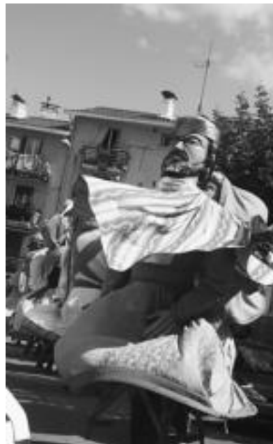
Izaskunen erraldoiak izan ziren atzo; Lizartzan 80 lagun inguru elkartu ziren herri bazkarian. E. EZEIZA