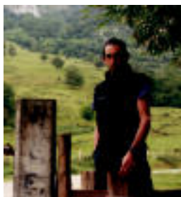
Heldu den udan berriz saiatuko da bere erroka gainditzeko. R. CALVO

TOLOSA Patxi Caminosek ez zuen lortu Txindokira 12 aldiz igotzea 24 ordutan <