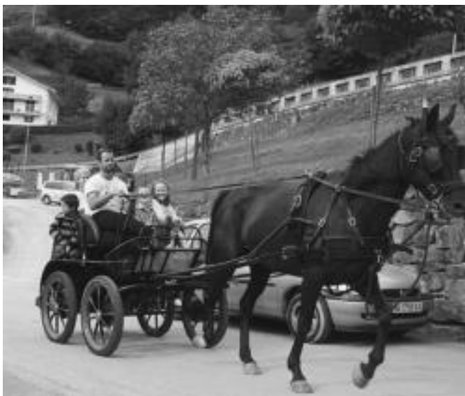
Herriatik barrena, zaldi gurdiaren gainean itzuli bat egiteko aukera izan zuten atzo Elduaingoek; Bedaion, haurrentzako jolasak izan ziren; ez hain haurrek ere parte hartu zuten. E. EZEIZA