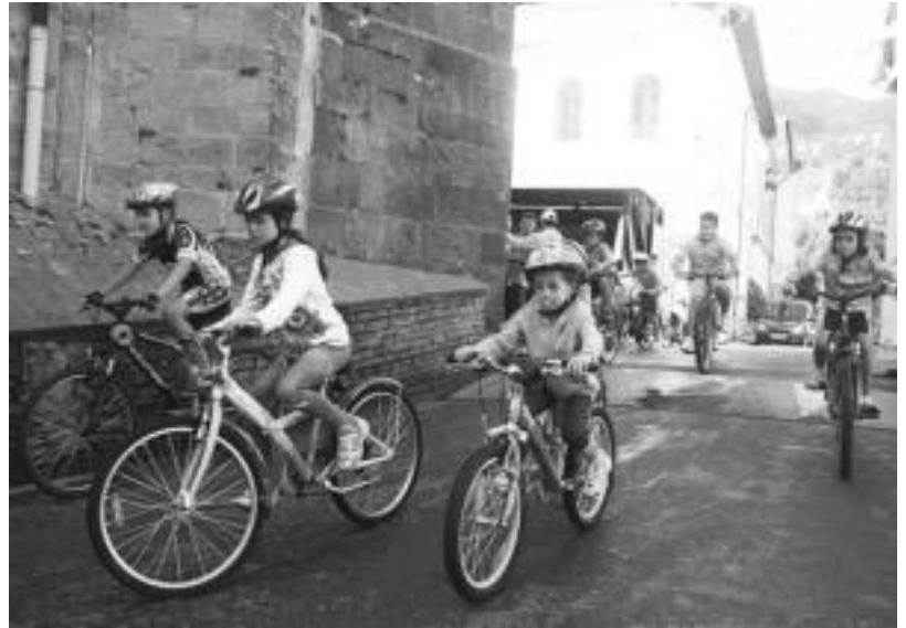
Txirindulari lasterketa izan zen atzo Alkizan; proba hasi aurretik, denek elkarrekin itzuli bat egin zuten.

18:30ean hasiko da herri kirol jaialdia. Bertan, hiru minutuko txanda batean 137,5 kiloko harriarekin ahalik eta altxaldi gehienak egiten saiatuko da. Orain arteko marka onena Izeta II.ak jarria da. 1996an, aiarrak 20 jasoaldi egin zizkion harri kubikoari, hiru minututan.