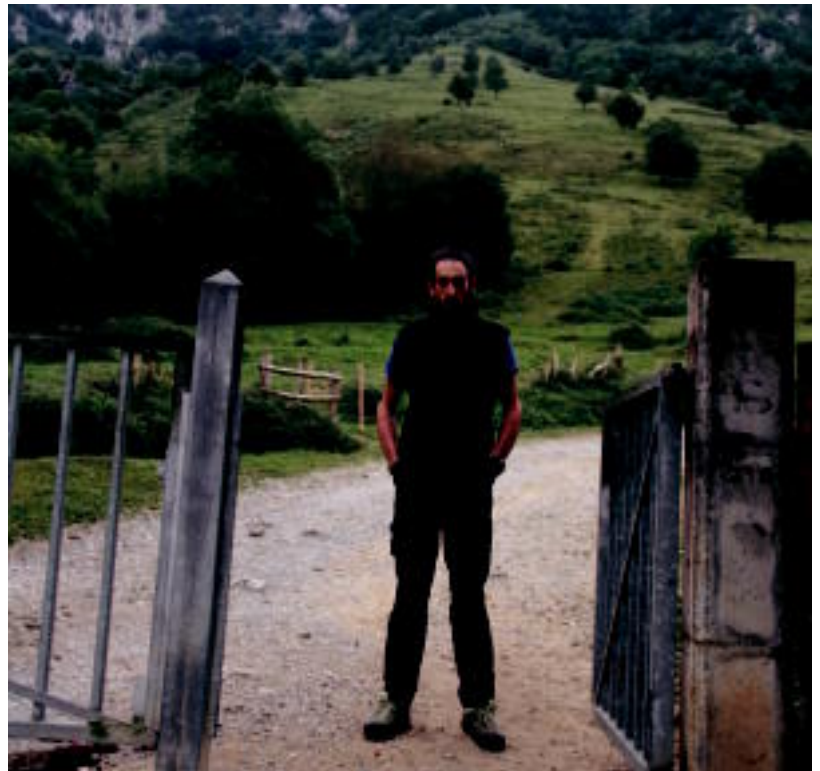
Aurtengoan lortu ez badu ere Caminos segituan hasiko da entrenatzen datorren udan berriz ere saiatzeko. R. CALVO

Caminosek asko eskertzen die erronka ikustera Txindoki inguruetara gerturatutako jende andanak emandako animoak: «Asko animatu ninduten, lasai egoteko esaten zidaten, batez ere nire osa-