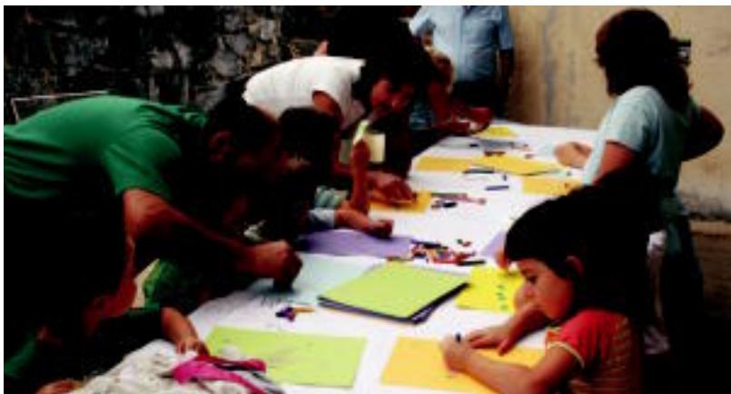
Lizartzan herri bazkaria egin zuten eta Bedaion txikienek marrazkiak egin zituzten. ESTI EZEIZA