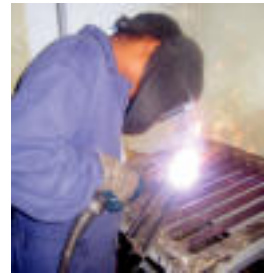
Txirbil-harroketazko mekanizazio kurtsoa emango dute aurten. I.T.

Doakoak izaten dira, Eusko Jaurlaritzako Hezkuntza sailak finantzen baititu.