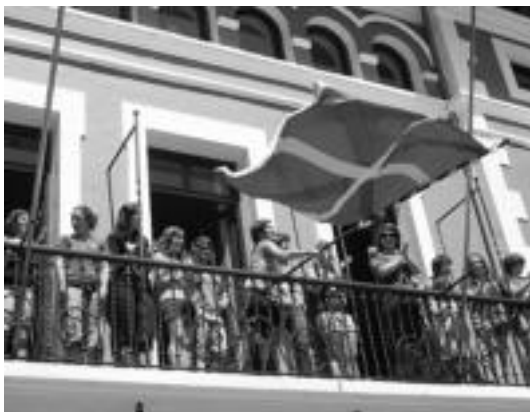
Tolosa-Getariako arraunlariak Euskadiko Txapelketa ospatzen.