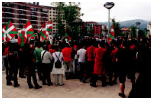
Villabonako alkateordea hil zen lekuan herritar ugari bilduta. A.I.

VILLABONA «Herrian erreferente bat» zela azaldu du Josune Arretxe zinegotziak 4-5