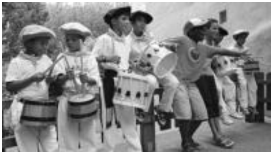
Ibarrako San Bartolome jaietako danborradan hartu zuten parte-gatetxoek. I.T.