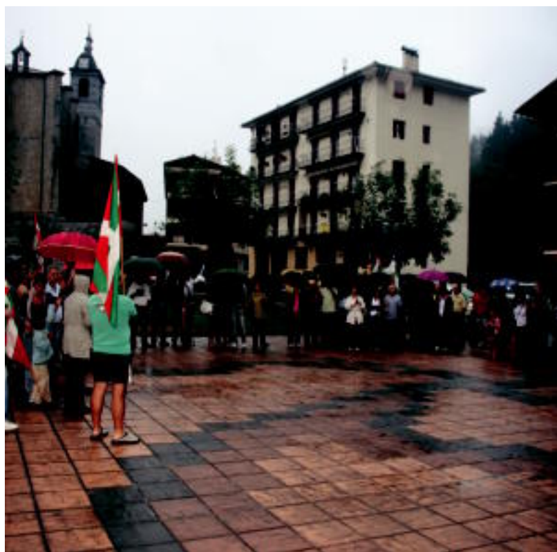
Herritar ugari hartu zuen parte atzo eginiko elkarretaratzean. A. IMAZ

KALEAN Frantziak Espainiaren esku utzi eta, 12.000 euroko fidantza ordainduta, aske geratu zen ostegunean 3