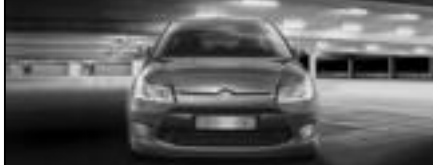
CITROËN C4 HDi 11.600€tik