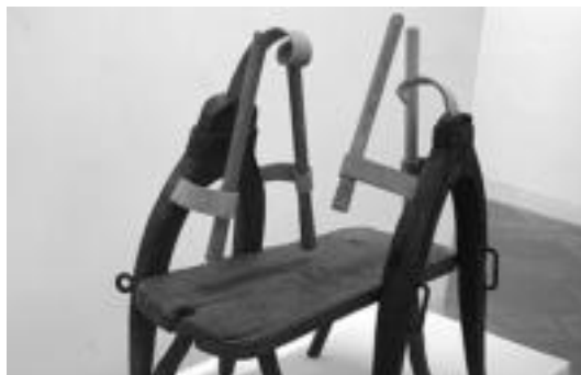
Txalaparta da 'Hotsez hots' bildumaren ardatza. E. EZEIZA