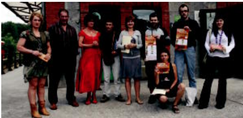
Plazaolako Partzuergoak atzo aurkeztu zuen '2009ko uda oihanaren bihotzean' gida Lekunberrin. N. URBIZU