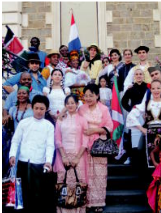
Txile, Kenya, Paraguai, Martinika, Haiti, Eslovakia, Birmania eta Bresseko dantzariak ere ari dira parte hartzen jaialdian, Alurrekin batera. HITZA

Isoireko Jaialdiaren antola- tzaileak «oso gustura omen dau- de» Alurr Dantza Taldearekin, «tradizioa eta modernitatea uzta- rten egin duten lana dela eta». Tal- deko arduradunek azaldu dutenez «frantziarrek ere egungo beste es- tilo batzuekin nahastu nahi dituz- tela beren dantza tradizionalak».