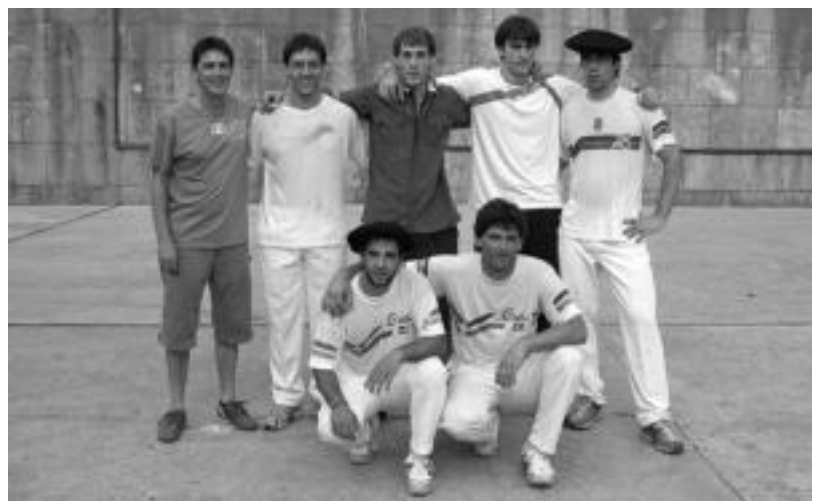
Aurtengo Plazako Txapelketaren irabazleak hurrengo astean jakingo dira. Irudian 2006ko finalistak. JAIONE ASTIBIA

Bestalde, Plazako Banakako Txapelketa gaur arratsaldean jarriko omen dute martxan.