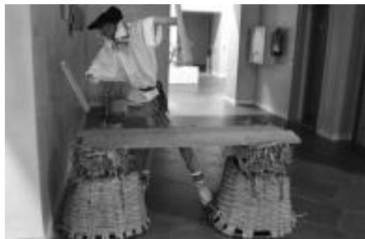
'Joxe Andrex' izeneko eskulturak ematen dio ongi-etorria bisitariari. E. EZEIZA