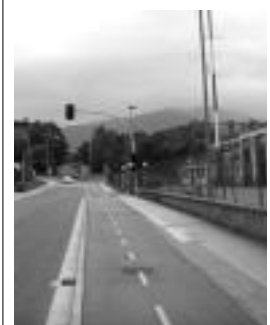
Semaforo berriak jarri dira. HITZA

Tolosakoarekin batera, Eibarko Arraten eta Legazpiko Korostin egin dituzte aldaketak.