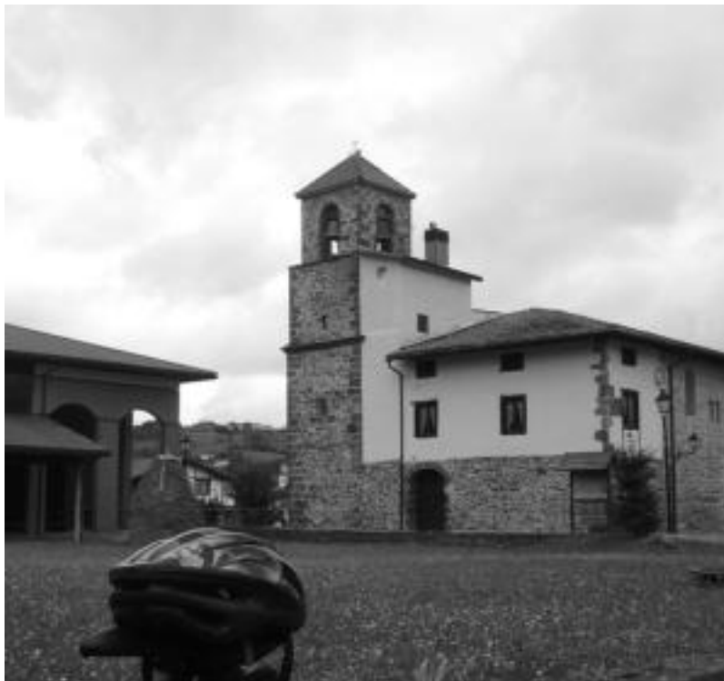
Atari soro frontoi berri eta ederra eta eliza ikus daitezke Gipuzkoako herri txikienean, Baliarrainen. JOXEMI SAIZAR

Txintzarrien herria Karmen jaietan izango da lerro hauek argia ikusterakoan. Ez da aukera txarra. Baina urte osoan ere badu zer ikusia herri honek: San Juan bataiatzailearen eliza (garai batean festak sanjoanetan egiten omen ziztuzten eta gero aldatu), udaletxea,