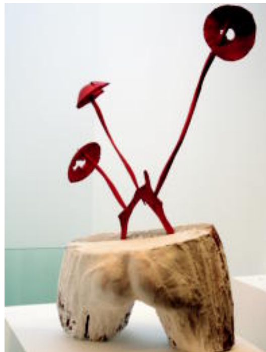
'Sustraietatik adarretara' da Aranburun ikusgai dagoen lanetariko bat. E. EZEIZA