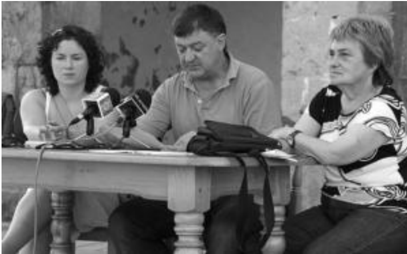
Ezker abertzaleko kideek prentsaurrekoa udaletxearen aurrean eman zuten.