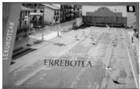
'Lekukotzak' bildumaren 8. alea: 'Euskaldunen Errebotea'.