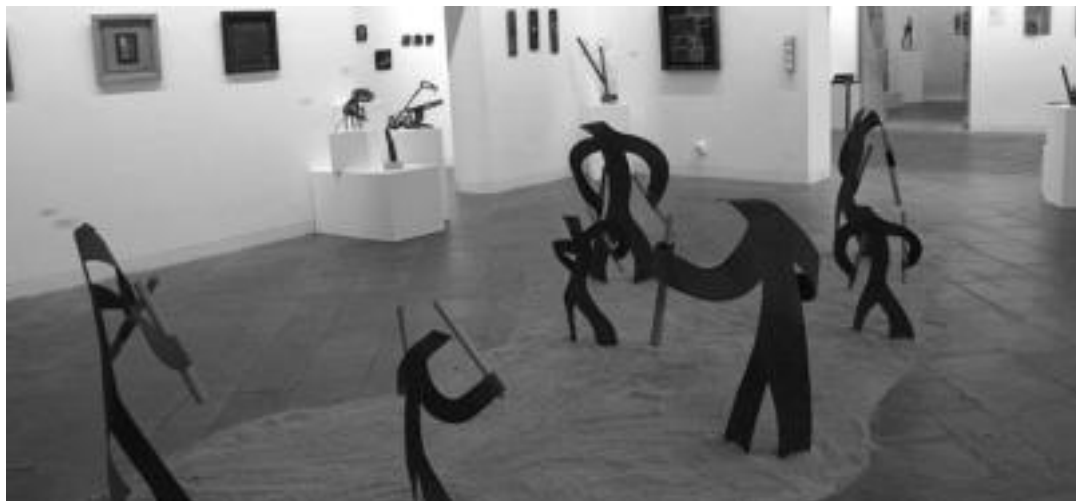
Egurra da lan guztien oinarrian dagoen materiala, baina hala ere, hau teknika ezberdinen bitartez landu ditu; baita beste material batzuekin osatu ere. E. EZEIZA