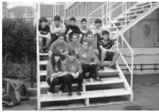
20 domina etxeratu dituzte Tolosaldea Igeri Kirol Taldekoek. HITZA

Gaur partida gehiago izango dira 19:00etatik aurrera. Alebinetan, Añorga eta Bidegoianen artekoa izango da lehen partida, eta Hernani-Aduna Brena bigarreana. Infantilen mailan, Alegia eta Villabona B-ren partida ikusi ahal izango da. Jarraian, Añorga eta Azkoitiaren artekoa. Etzi eta larunbatean ere norgehiagoga gehiago izango dira.