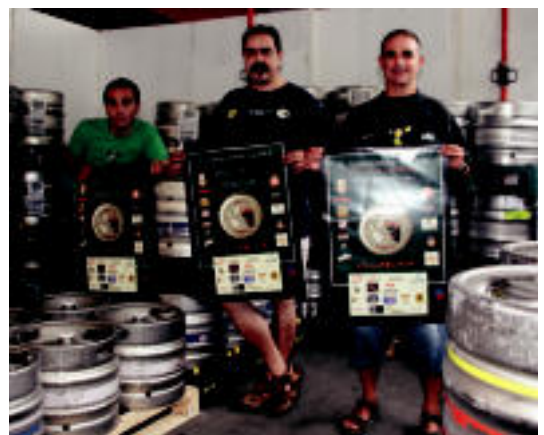
Irrintzi elkarteak antolatzen duen azoka Txermin ikastolan izango da. I.GARCIA

«Ez delako gure eskuduntza» Udalak ez ditu soldatak parekatuko