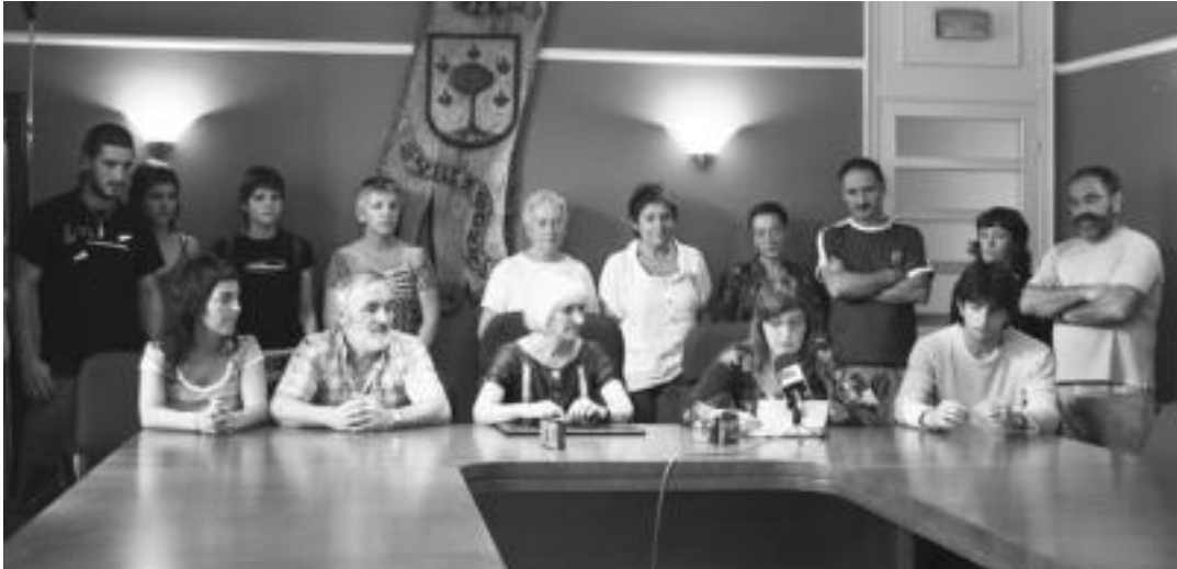
Villabonako ezker abertzaleko hautetsiek, ezker abertzaleko kideek eta Santiago egoitzako egoiliarren familiaretekoekin zuten agerraldia. R. CALVO