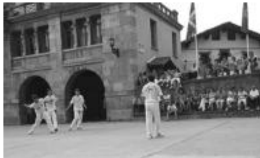
Leitzako XVII. Plazako Txapelketaren finala jokatuko da etzi. JAIONE ASTIBIA

Pilota » Finala Zeballos-Iriartek eta Aldaia-Olanok jokatuko dute; aurretik hirugarren eta laugarren postuak erabakiko dira.