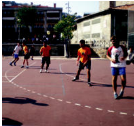
Laugarren urtez antolatuko dute futbol txapelketa. HITZA

diak aterako dira. Bi partidak hauek 16:00etan eta 17:00etan jokatuko dituzte, 20 minutuko bina zatik osatuko dutelarik partidak. Finalerdi bakoitzean irabazleek final handia jokatuko dute, 18:00etatik aurrera.