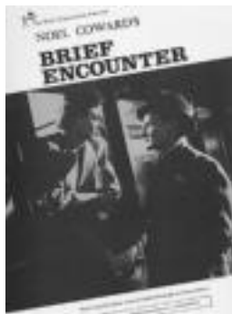
'Breve encuentro' filma ikusgai. HITZA

Oraingo honetan, esaterako, bi egunetan izango dira zine-forumeko saioak, bihar eta larunbatean hain zuzen ere. Bihar, Breve encuentro filma ikusi ahal izango da jatorrizko bertsoan, 19:30etik aurrera. Baita, larunbatean, 22:30ean