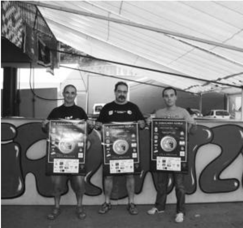
Irrintzi elkarteko zenbait kide, Garagardo Azokaren aurtenko kartela eskuetan dutela, barraren aurrean. I. GARCIA