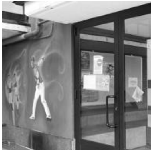
Irailaren 30a arte jasoko dituzte kiroldegia berritzeko proposamenak. R. CALVO

Proposamenak bidaltzerako garaian hainbat baldintza bete behar dira Udalaren hitzetan: «Baldintza horietako batek proiektuak diziplina anitzeko talde batek egina izan behar duela dio, beti ere, arkitecto baten gidaritzapean. Arduradun nagusia ezaugarri hau betetzen duen profesional bat izatea eskatzen dugu, Udalak, proiektua, irabazle suertatzen den talde ber-