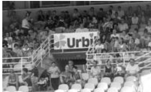
Jendetza bildu zen finalak ikustera Anoetan.

Astearte goizean Norvegiako Roa II taldea izan zuten aurrez aurre eta hauen aurka ere 1-0koarekin lortu zuten garaipena. Asteazkenean erraz gailendu ziren Donostia taldearen aurka (8-0). Ostegun arratsaldean Estatu Batuetako Elko Soccer taldearen aur-