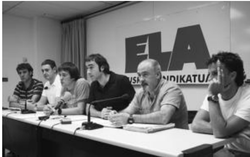
ELA sindikatuko ordezkariak eta Gorostidi enpresako langileen batzordeko kideak agerraldia egin zuten atzo. E. EZEIZA