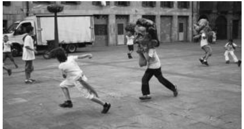
Goian suziria jaurti zuten ueña eta beheko irudian haurrak buruhandietatik ihes egin nahian. I. TERRADILLOS / E. IRAOLA

JAIK » Atzo San Fermin eguna izanik, jai giro hori irudikatzen saiatu ziren udaleku irekietan. Laskorain Ikastolak antolatzen dituen udalekuetan dabilzan 2 eta 8 urte bitarteko 160 haur inguru txuri-gorri jantzi eta San Fermin giroan barneratu ziren. Zezenaren aurretik korrika eta saltoka ibili ziren. HITZA