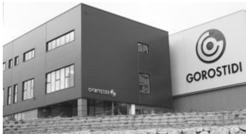
168 lagunek egiten dute lan Apatta Erreka industriagunean kokatuta dagoen Gorostidi enpresan. M. SOROA

te alde batera begiratu behar», arazoa konpontzen laguntzeko eskatu zieten Martinezek hauei. Honez gain, erakunde publiko horiekin guztiekin biltzeko prestutasuna agertu zuten eta baita, Gorostidiko batzordea osatzen duten LAB eta USO sindikatuetaordezkariekin ere. Egun, langileen batzordea, ELAko sei ordezkariak, LABeko bik eta USOkobatek osatzen dute.