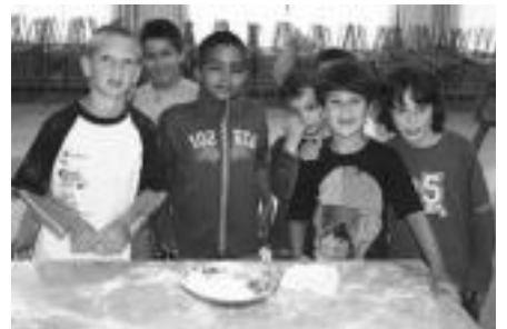
Erleta Eskolako jangelan, haurrak 'Sukaldean esperimentatu' izeneko udako tailerra egiten ari dira. Atzokoan erroskilak egin zituzten begiraleen laguntzarekin.