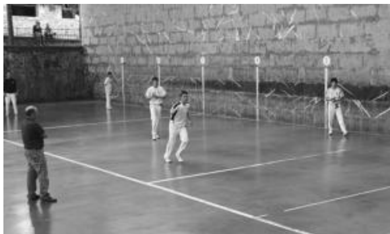
Joan den larunbatean hasi zen jokatzen Adunan, Transernio pilota txapelketa. N. URBIZU

VI. Transernio Pilota Txapelketa hasi zen joan den asteburuan. Lau mailako pilotariak ari dira lehiatan bertan. Larunbatean, esaterako, kadeteen mailan binaka aritu ziren. Lehen partidari Añorga eta Villabona aritu ziren elkarren aurka. Donostiarrek 4 tanto egin zituzten, eta besteek 16, garaipena erdietsiz. Bigarren partidari, Amezketakoak Hernanikoen aurka aritu ziren. Eskualdekoek irabazi zuten, besteak 5 tantorekin utziz.