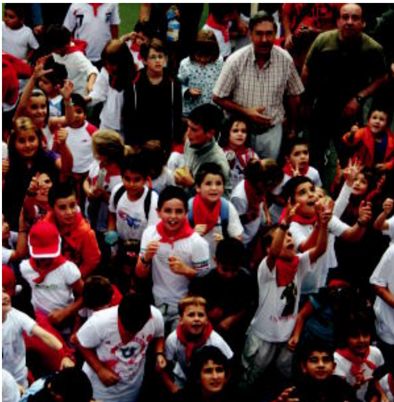
Plaza Berrian jai giroa zen nagusi atzo gaztetxoenen artean. E. IRAOLA

LANGILEEN EGOERA Abendutik EREan daude; uztailaren 31n amaitzen da, eta gero ez dakite zer gertatuko den 4