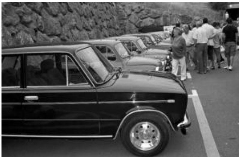
Larunbatean, 70. hamarkadan giroturiko festa bihurtu zen Garagardo Azoka. Irudian, garaiako autoak. HITZA

Irura » Aurreko azoketan izandako irabazi antzekoak izan dituzte; antolatzerik ekitaldien balantze baikorra egin dute.