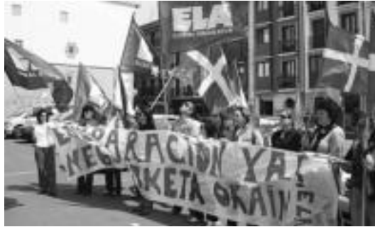
Egoitzako langileek egindako elkarretaratzeko irudia.

Villabona » ELA sindikatuak egin du deialdia langileen aldarrikapenekin bat egiten duela adierazteko.