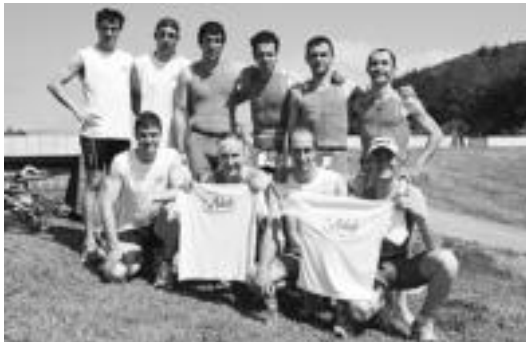
Mahala Triatloi Taldeko kideak. HITZA

Kirola » Gasteizen lehiatuko dira distantzia luzeko txapelketan igandean; ironmanetan emaitza onak lortu dituzte.